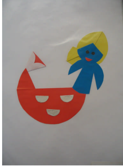
Resim 2.11: Kâğıt katlamadan denizkızı

Mukavva hariç her kâğıda uygulanır. Yelpaze, kedi merdiveni yapmada kullanılır. Kâğıda istenilen şekilde kesin hatlar kullanarak şekil vermektir.