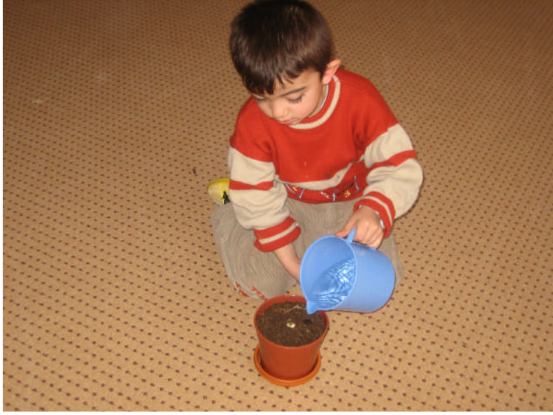
Resim 2.28: Çiçek dikimi