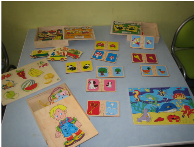
Resim 2.30: Eğitici oyuncaklar

Oyun ve oyuncaklar çocukların gelişimi için besin kadar gerekli olan ve yaşamlarının doğal bir parçası niteliği taşıyan uğraşlarıdır. Çocuğun oyundan en üst düzeyde yarar sağlayabilmesi ve gelişimlerinin desteklenmesi için nitelikli bir oyun ortamı ve materyalli sunulması büyük önem taşımaktadır.