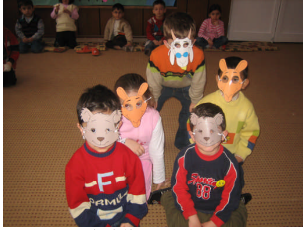
Resim 2.19: Drama çalışması