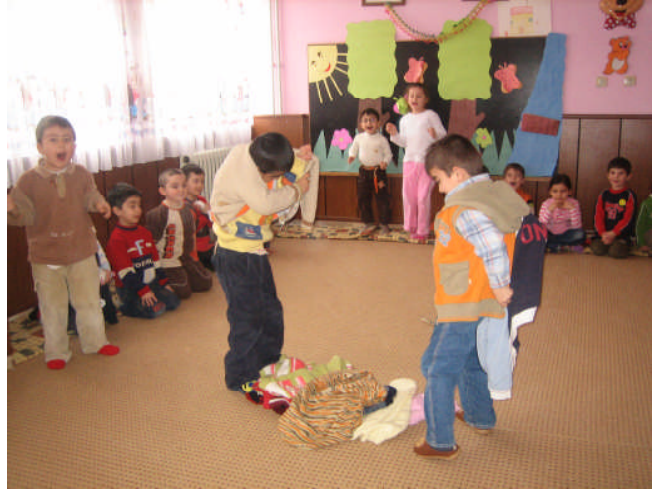
Resim 2.24: Hırka giyme oyunu

Oyun, çocuk için sadece eğitsel yönden değil onun ruh sağlığı açısından da büyük önem taşımakta ve duygusal ilişkilerin başlatılması için en iyi ortamlar hazırlamaktadır. Çocuk oyun sırasında son derece bağımsız kendi başına buyruk, kendi dünyasında özgür hareket ederek duygusal rahatlama elde eder.