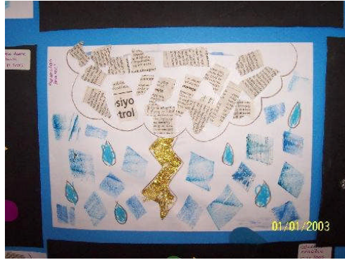
Resim 1.1: Gazete kâğıtlarıyla proje çalışması

Okul öncesi çocuğuna eğitim veren kurumlar olsun, evde yetişkinler olsun çocuğa resim yaptırırken zemin olarak çocuğa ucuzluğu ve kullanım kolaylığı bakımından genellikle kâğıt kullanırlar. Çoğunlukla da bu kâğıt, beyaz resim kâğıdı olur. Oysa her çalışmada değişik zeminler kullanılmak gerekir. Yapılan çalışmaların farklı zeminlerde yarattığı sonuçları görmesini sağlamak ve çocuğu bu doğrultuda çalışmaya alıştırmak, yaratıcılıkları açısından atılacak ilk adımdır. Daha ileride, çocuğun kendisinin istediği malzeme ile birlikte kullanacağı zemini de kendisinin seçebiliyor duruma gelmesi arzu ettiğimiz sonuçtur.