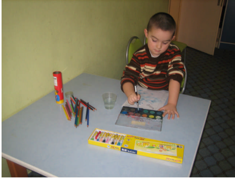
Resim 2.1: Sulu boya çalışması

Piyasada hazır olarak tabletler halinde veya tüplerin içinde macun kıvamında bulunabilir. Her ne kadar tüplerin içinde olanlar çocukların kullanımı için pratik ve ideal olsalar da ekonomik olmadıkları için öğretmenler tarafından kullanımı çok sınırlıdır. Ayrıca her kırtasiyede bulunması mümkün değildir. Okul öncesi çocuğu için tablet halinde olanlar kullanılacaksa da tabletlerin büyük boyutta olduđu markalar tercih edilmelidir. Böylelikle çocuk bu tabletleri sulandırıp renk çıkartmaya çalışırken kalın fırçasını boya tabletlerinin içinde rahatça döndürebilir.