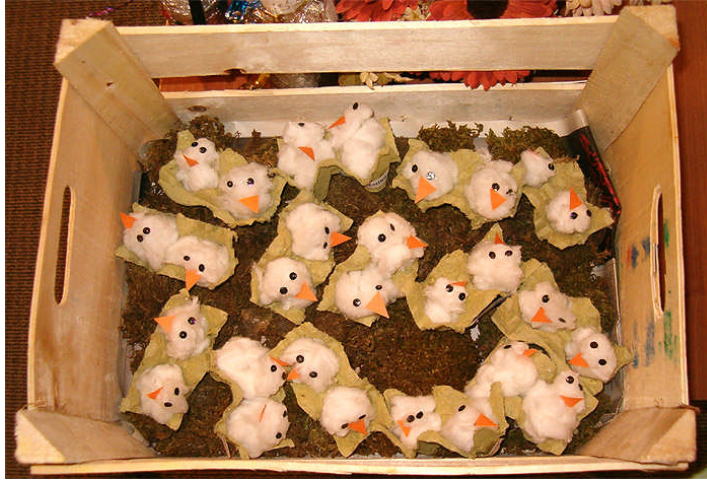
Resim 2.13: Artık malzeme çalışması

Artık materyal; çevremizde gördüğümüz ve kullandığımız, daha sonra da kullanılmayacağı için çöpe atmayı, bir başka yerde saklamayı ya da biriktirmeyi düşündüğümüz hijyenik olan tüm doğal, fabrika yapımı ya da el yapımı maddeleri içerir. Zaman içinde özelliği bozulmadan muhafaza edilebilen ve işe yarmayacağı düşünülerek çöpe atılan her şey artık materyaldir. Artık materyaller çoğu zaman çocuklar için, satın alınan çok pahalı oyuncaklardan daha değerli olabilmektedir.