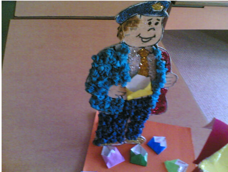
Resim 2.12: Yuvarlamadan postacı

İnce karton, fon kâğıdı, dergi sayfaları, elışı kâğıdı gibi kâğıtlardan kesilmiş şeritleri bir ucundan tutup yuvarlayarak kullanma işlemine denir. Şerit halince ince bir kâğıt, kaleme sararak yuvarlanabilir ya da makasın ucu veya buna benzer bir aletle kendimize doğru kuvvetli ve düzgün olarak çekip birden bırakınca da yuvarlanır. Bu ikinci tekniği altı yaş çocukları öğretmen yardımıyla uygulayabilirler.