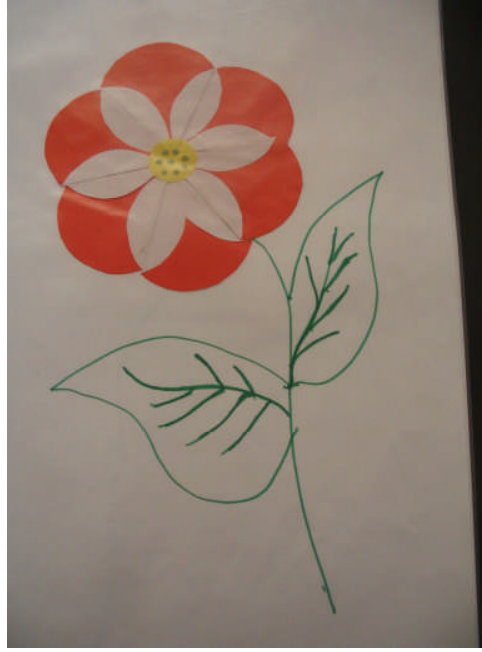
Resim 2.7: Kâğıt katlamadan çiçek yapımı

Ayrıca çocuklara deęişik boyutlarda çeşitli kâğıtlar sunmak gerekir. İnce, dar, uzun, geniş, şekilli (üçgen, kare, dikdörtgen, daire) olarak hazırlanan kâğıtlar bu etkinlik için ayrılan masa veya bölümlere yerleştirilebilirler. Çocuklar kullanımı güç maddeleri kullanma deneyimleri arttıkça deęiştirecekler, farklı boyut ve cinsteki kâğıtlar kullanacaklardır.