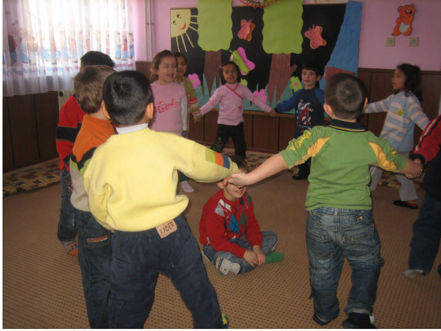
Resim 2.23: Oyun etkinliđi

Oyun etkinliklerinde, çocukların oyundaki etkileşim düzeyine ilişkin gerçeklik düzeyiyle oyun rollerinde ortaya konan hayali düzeyi arasında sıkı bir ilişki bulunmaktadır. Oyun etkinlikleri yoluyla çocuklar karşılıklı olarak etkin ve verimli bir konuşmacı ve dinleyici olma fırsatını bulurlar. Oyun etkinliklerine katılım çocukların sosyal kavrayış yeteneğinin gelişmesi yanında dilde bir uyanıklık da sağlamaktadır. Lieberman oyun ve yaratıcılığın arasındaki ilişkiyi deneysel bir şekilde araştırmıştır. Bunun için çocukları oyunlarında izlemiştir. Çocukların oyundan zevk almalarının ve kendiliğindeliklerinin bireysel farklılıklarını araştırmıştır. Oyundan zevk almayı 5 özellikle açıklamıştır. Bunlar; bedensel, sosyal, zihinsel, farklı oyun gruplarına katılma, şakacı, açık, neşeli. Araştırmada oyundan zevk alan çocukların yaratıcı düşünmeye sahip oldukları, zevk alamayanların da yaratıcı düşünmeye sahip olmadığını göstermek istemiştir. Sonuç olarak oyundan zevk alan çocukların yaratıcılıklarının yüksek olduğu, yaratıcı düşüncenin oyun ortamında daha iyi ortaya çıktığı görülmüştür. Samur ve Davaslıgil, oyun oynayarak büyüyen çocukların oyun oynamamış çocuklara göre sosyal yönden daha aktif, yaratma güçlerinin daha fazla, konuşmalarının daha düzgün, dillerinin daha zengin olduğunu vurgulamışlardır.