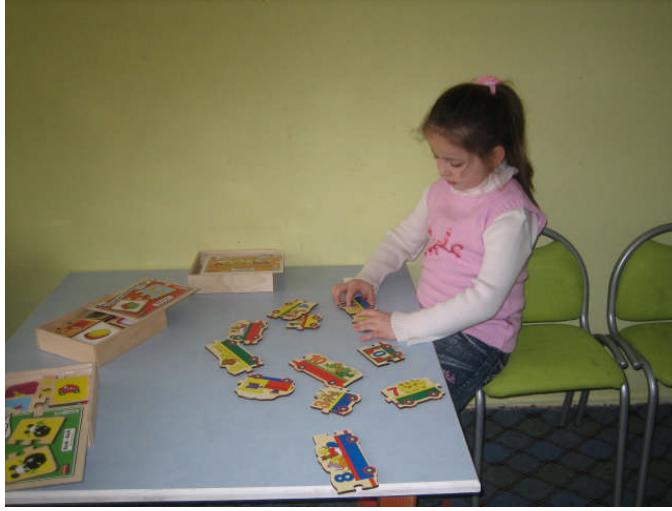
Resim 2.31: Eğitici oyuncaklarla oynama

Çocuğun önemli bir uğraşı olan oyunun gerçekleşmesinde oyuncakların rolü son derece önemlidir. Oyun ve oyuncak birbirinden ayrı düşünülemez. Yetişkin çevresinde olup bitenleri nasıl konuşarak, okuyarak öğreniyorsa çocuk da başlangıçta dış dünyayı oyuncaklarının yardımıyla tanımaya çalışır. Oyuncaklar zekâyı, duyu ve duyguları uyaran, çocuğun hayal gücünü ve yaratıcılığını geliştiren, bedensel, ruhsal ve sosyal gelişimini destekleyen çocukluk döneminin en değerli araç gereçleridir. Oyuncak ve oyun materyalinin tanımını yapmak gerekirse “çocukların oyun oynarken kullandıkları tüm malzemelerdir” şeklinde tanımlamak mümkündür.