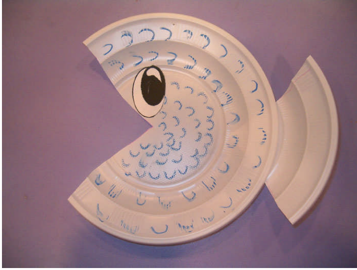
Resim 2.14: Plastik tabaktan balık yapımı

Öğretmen artık materyalleri olduğu gibi kullanmamalı, önceden işleminden geçirerek çocuklar tarafından kullanılabilir hale getirmelidir. Çünkü bu materyaller önceden kullanılmış oldukları için hijyenik olmayabilir. Öğretmenin bu malzemeleri çocukların kullanabilecekleri biçime getirmesi, çocuklarda ilgi ve motivasyonu artırma açısından önemlidir. Artık materyaller çocuklara sunulurken her gün tüm malzemeleri aynı anda ve aynı şekilde koymak yerine, birbiri ile bir arada kullanabilecek materyaller o gün eğitim programındaki amaç ve kazanımlar ile ilişkili olarak ipuçları verecek şekilde önceden biçimlendirilmeli ve bu materyaller özelliklerine göre gruplandırılarak düzenlenmesine dikkat edilmelidir.