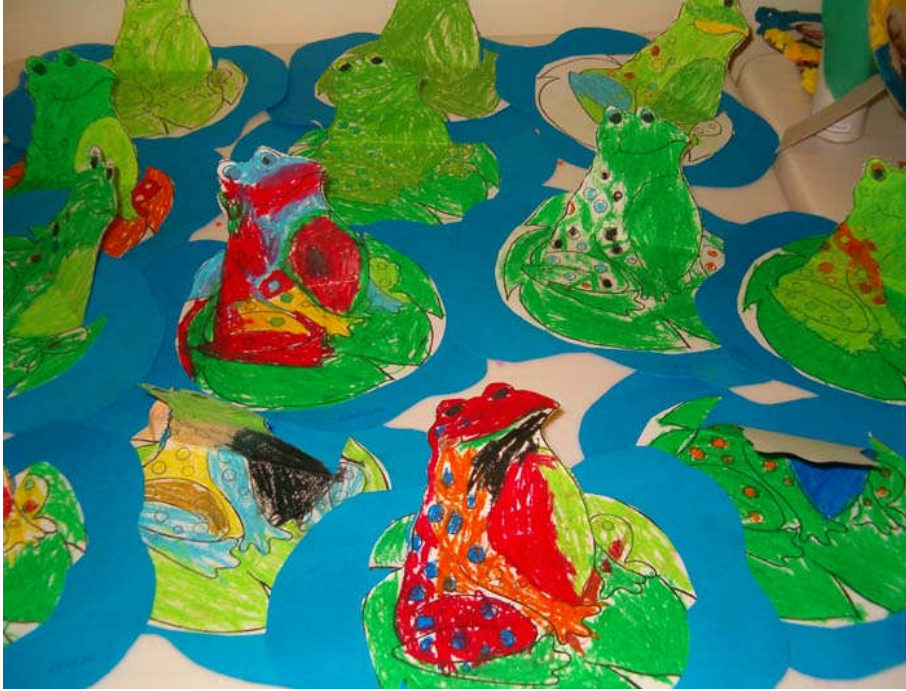
Resim 2.2: Pastel boya çalışması

Boya pigmentlerini yağlı ya da yağsız bir eriyiğin içine katarak elde edilen, yağlı ve kuru olmak üzere iki türü olan, tebeşire benzer boya kalemidir. Yağsız olanlar yağlı olanlara oranla daha pahalı olup daha çok profesyonel kullanıma yöneliktir. Çocukların kullanması için yağlı olan tercih edilmelidir. Okul öncesinden başlayarak kolayca kavranabilirliği ve canlı renkleri dolayısıyla çocukların zevk alarak kullandıkları bir malzemedir. Pastel boyalar piyasada değişik markalarda, çeşitli renk skalalarında ve çeşitli fiyatlarla hazır olarak bulunur. Hangi marka seçilirse seçilsin zehirli madde içermeyenler tercih edilmelidir. Çünkü boyalar görüntü itibariyle küçük çocuklara oldukça iştah kabartıcı görünebilir.