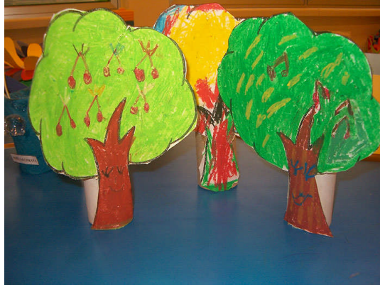
Resim 1.5: Artık malzemeleri kullanarak pastel boya çalışması

Okul öncesi yaş grubunda olan çocukların tercihi daha çok pastel boyadan yanadır. Bu boyalar kalın gövdeli oluşlarından dolayı henüz küçük kas gelişimini tamamlamamış okul öncesi çocukları için uygundur. Özellikle yağlı pastel boyaların daha canlı renkler vermesi ve kâğıt üzerinde rahat kayması kullanım kolaylığı sağlar. Değişik kullanımlarda farklı sonuçlar elde edilir. Pastel boya, kalem gibi kullanıldığında renkler daha net çıkar ve farklı kalınlıkta çizgiler oluşturulabilir.