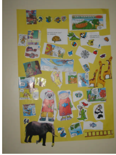
Resim 1.3: Fon kâğıdı üzerine proje çalışması

Dokulu yüzeyleri de çeşitlendirebiliriz. Öncelikle, yalnızca gözlerimizle hissettiğimiz (görsel doku) dokulu yüzeyler çalışmalarımızın zemini olabilir. Desenli bir duvar kâğıdı ya da kap kâğıtları, gazete, dergi gibi basılı kâğıtlar, önceden üzerine resim yapılmış kâğıtlar olabilir. Çocukların gelişim durumlarına göre, hazır görsel dokulu zeminler kullanabileceğimiz gibi, çalışmamızın ön aşaması olarak zemini de çocukların kendileri, kolaj yöntemiyle hazırlayabilirler. Örneğin, büyük boy renkli fon kartonu ya da kraft kâğıdı üzerine yer yer gazete kâğıdı yapıştırarak farklı görsel dokuların olduğu ortak bir çalışma zemini oluşturulabilir.