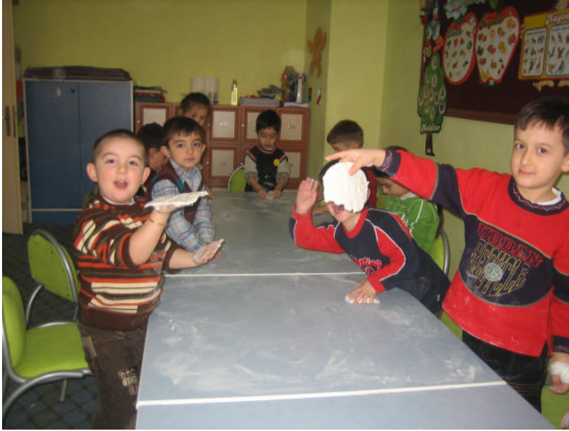
Resim 2.5: Kâğıt hamuruyla oynama

Sanat etkinlikleri sırasında tuz seramiği, kil, plastirin, kâğıt hamuru, talaş hamuru ve mum gibi yoğurma maddeleri çocukların gelişim özelliklerine uygun şekil verme veya çalışmalarını süslemek amacıyla kullanabilecekleri artık materyallerle birlikte kullanılabilir. Öğretmenin yoğurma maddelerinin yanında vereceği artık materyallerin çeşitliliği çalışmaya ilgiyi artırmada etkili rol oynamaktadır. Çocukların bu çalışmalara ilgisini artırmak ve yaratıcılıklarını geliştirmek için yoğurma maddeleriyle birlikte küçük yuvarlak sopalar, pasta ve kurabiye kalıpları, kuru yemiş kabukları, düğmeler, boncuklar, küçük mukavva ve plastik kurular, renklendirilmiş makarnalar, şişe kapakları, ağaç kabukları, kozalaklar gibi artık materyallerden yararlanılabilir. Öğretmen artık materyallerin hepsine aynı gün yer vermek zorunda değildir.