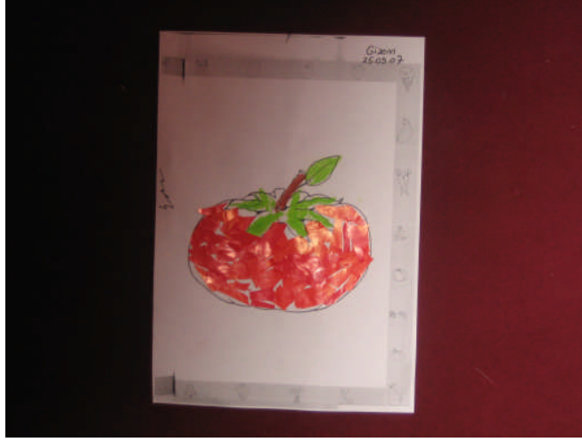
Resim 2.9: Yırtma yapıştırmadan domates yapımı

Kâğıdı istenilen şekle göre bir ucundan tutup makas kullanmadan elle parçalamaktır. Çocuklar gazete kâğıdı ya da dergi sayfalarına istedikleri resmi çizerler, sonra çizdikleri bu resmi kesmezler, yırtarak çıkarırlar.