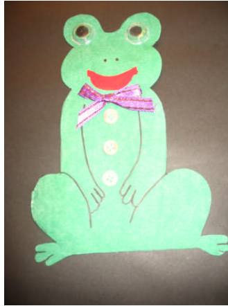
Resim 2.10: Kesme tekniğinden kurbağa yapımı

Kâğıt işlerinde en çok uygulanan bir tekniktir. Bir kâğıda çizilen herhangi bir şekil makas kullanılarak kesip çıkarılır. Kesme işlerinin en basiti bir kâğıdı ikiye katlayıp değişik biçimde ufak delikler yapmak için kat yerinden kesmektir. Kâğıt sonra bir daha katlanıp aynı işlem tekrarlanır. Bu dörtlü katlamanın sonunda güzel desenler elde edilir.