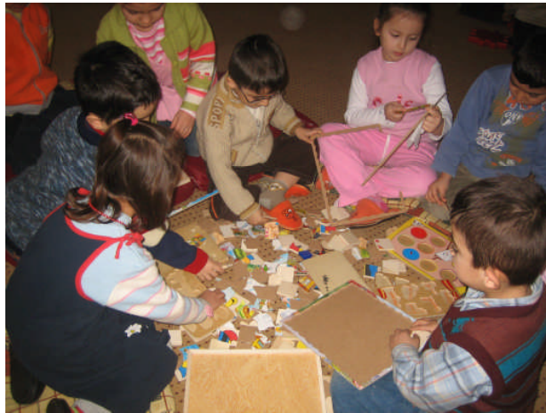
Resim 2.32: Eğitici oyuncaklarla oynama

Eğitici oyuncaklar yaşlara göre farklı özellikler göstermektedir. Örneğin bebeklikten üç yaşına kadar olan dönemde görme, işitme ve dokunma duyu uyarıcıları, oyun battaniyeleri, beşik korumaları vb. gibi oyuncaklar hazırlanabilir. Daha büyük çocuklar için ise tek başına ya da grupla oynayabilecekleri tombalar, dominolar, eşleştirme kartları, yapbozlar vb. gibi parça-bütün oyuncakları hazırlanması mümkün olacaktır.