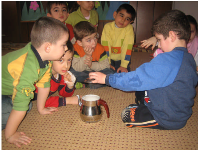
Resim 2.26: Yağmur nasıl yağar deneyi