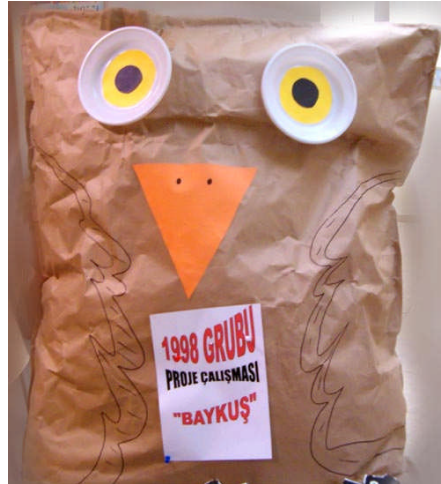
Resim 1.6: Artık malzemelerden baykuş yapımı

Artık materyallerin okul öncesi çocuğunun sanat eğitiminde çok önemli bir yeri vardır. Çocuklar elleriyle tutabildikleri, kavrayabildikleri nesnelere daha kolay iletişime girerler. Onları birbirleriyle eşleştirir, yan yana, üst üste koyar, birbirlerine ya da başka bir düzleme yapıştırırlar. Bunlar yabancı olmadıkları, tanıdıkları malzemelerdir. Her artık materyali işlevinden farklı bir şeye dönüştürmek, onlar için hem zevkli bir etkinlik hem de bilişsel gelişim sürecine bir katkı demektir. Yalnız bunları yaparken işin estetik boyutu gözden kaçırılmamalı, ellerine geçen her malzemeyi, aynı etkinlikte yığma biçiminde kullanılmamalıdır. Neyi ne ile yan yana getireceğini, hangi başka malzeme ya da boyayı kullanacağını kendisinin seçmesini -düşünme ve karar verme gibi sorumlulukları olduğunu bildirerek etkinlik yaptırılmalıdır. Böylece çocuklar hoşlanacakları bir süreç yaşarlarken, kendi kendilerine düşünüp seçmeyi ve karar vermeyi başarmanın hazzını da tadacaklardır.