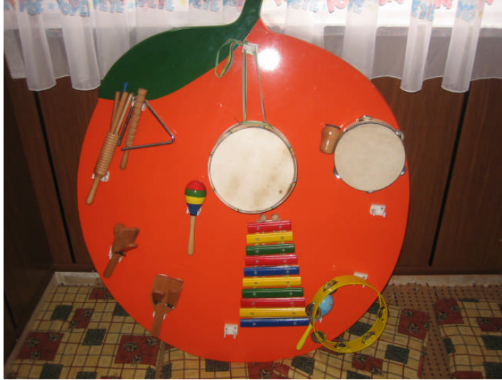
Resim 2.20: Müzik aletleri

Müzik etkinlikleri, günlük eğitim programında bulunan tüm etkinliklerin içerisinde kullanılabilen bir etkinliktir. Yer, zaman ve duruma göre doğru müziği bulabilmek, insanın müzik kültürüyle yakından ilgilidir. Bu kültürün temelleri ise okul öncesi dönemde atılır. Çocuklar küçük yaşlardan itibaren iyi müzikle beslenirlerse büyüyünce müzik sanatçısı olmasalar bile iyi müziği seçen, seven ve ondan yararlanmasını bilen yetişkinler olacaklardır.