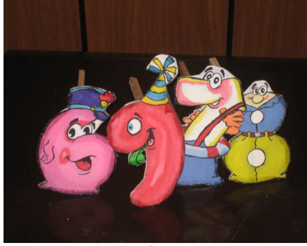
Resim 2.17: Çomak kuklalar