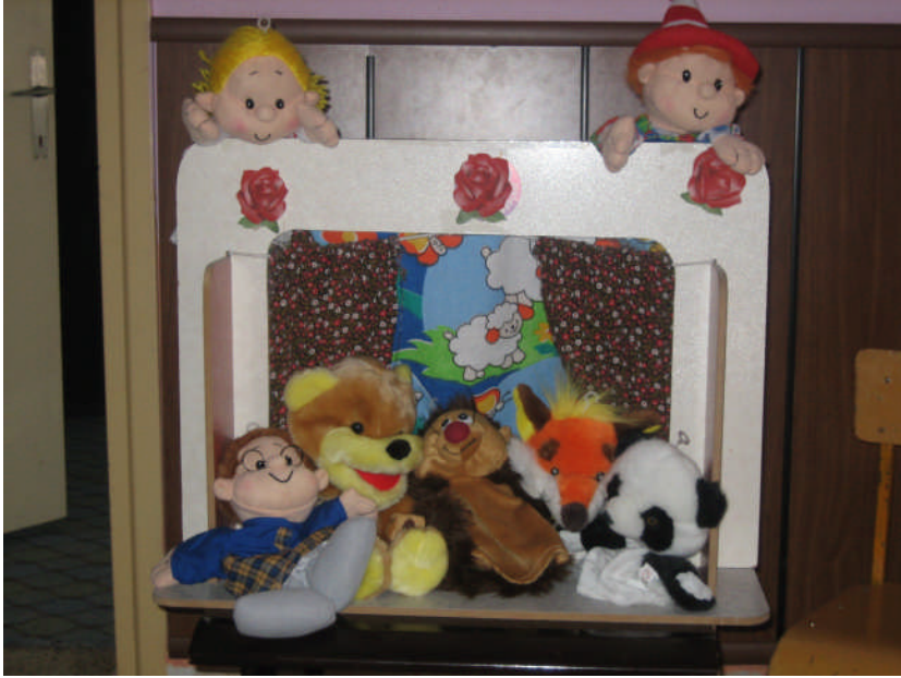
Resim 2.16: Kukla sahnesi ve kuklalar

Türkçe dil etkinlikleri okul öncesi eğitim programlarında çocukların tüm gelişimleri açısından çok önemli bir yeri olan ve her gün tekrar edilen, öğretmen rehberliğinde yapılan grup etkinliklerinden biridir. Okul öncesi kurumlarında uygulanan Türkçe dil etkinlikleri çocukların dil gelişimlerini sağlamak, bu yolla kendilerini ifade etmelerine imkân tanımak ve çevre ile etkileşimlerini kolaylaştırır. Aynı zamanda bu çalışmalar çocukların yeni kelimeler öğrenmesine, düzgün konuşmasına ve kendilerini sözle ifade etmesine yardım eder. Onlara kitap sevgisi aşılar. Ayrıca çocukların sosyal ve duygusal gelişimine yardım eder. Türkçe dil etkinlikleri, hikâye öncesi etkinlikler, hikâye ve hikâye sonrası etkinlikler olmak üzere üç grupta yapılmaktadır.