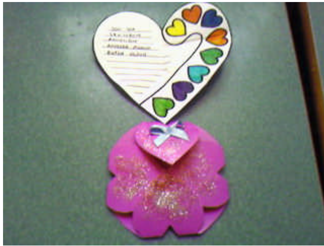
Resim 2.8: Kâğıt katlamadan tebrik kartı

Kâğıtlarla birçok tekniğin kullanılabilceęi çalışmalar yapılabilir. Kâğıt katlama (origami), yırtma, buruşturma, bükme ve kesme teknikleri kullanılarak şapkalar, kuklalar, maske, insan, hayvan ve nesne figürleri, süs eşyaları, özel günler için süsler, hediyeler, tebrik kartları, dramatizasyon çalışmaları için kostümler hazırlanabilir.