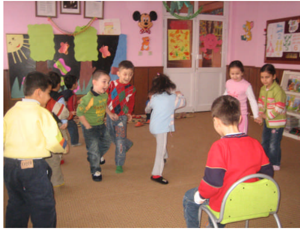
Resim 2.25: Kurt baba oyunu

Oyun, çocuk için sadece eğitsel yönden değil onun ruh sağlığı açısından da büyük önem taşımakta ve duygusal ilişkilerin başlatılması için en iyi ortamlar hazırlamaktadır. Çocuk oyun sırasında son derece bağımsız kendi başına buyruk, kendi dünyasında özgür hareket ederek duygusal rahatlama elde eder.