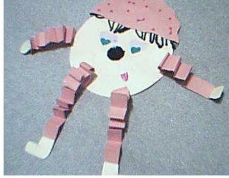
Resim 2.6: Kâğıt çalışması

oynamaktan hoşlanırlar. Çeşitli boy, renk ve cinsteki kâğıtlar bu çalışma için kullanılabilir. Elişi kâğıdı, teksir kâğıdı, kalın paket kâğıtları, grapon, karton, renkli fon kartonları, eski gazete ve dergi sayfaları, tuvalet kâğıdı, kese kâğıtları, takvim ve afiş kâğıtlarının renkli yüzeyleri ve resim kâğıtları kullanılabilir.