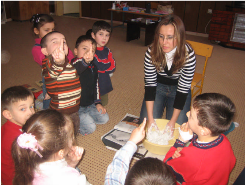
Resim 2.4: Kâğıt hamuru yapımı

Eğitmciler tarafından planlanan bazı etkinlikler için kullanılan malzemeler, örneğin boyama sayfaları, konuşan veya kurtmalı oyuncaklar vb. çocuklara sadece tek bir doğru yol olduğunu ve ancak bu yolu izlerse sonuca ulaşabileceğini vurgulayan, yaratıcılığa hiçbir katkısı olmayan malzemelerdir. Oysaki oyun hamuru, tuz seramiği, plastirin vb. yapılandırılmış malzemeler orijinal düşünmeyi, yaratıcılığı ve deneyim kazanmayı sağlayan ve çocukları bu yönlerde cesaretlendiren sanat malzemeleridir. Ayrıca etkin öğrenme için de çok değerli sayılırlar. Yoğurma maddeleri olarak kil, çamur, oyun hamuru, kâğıt hamuru, seramik hamuru, talaş hamuru sayılabilir.