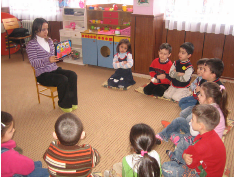
Resim 2.18: Hikâye kartı ile hikâye anlatma