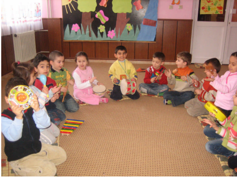
Resim 2.22: Müzik aletleri ile şarkı söyleme

Müzik köşesinde müzik araçları çocukların görebileceği ve ulaşabileceği bir yerde, onlara düzgün bir şekilde sunulabilmesi ve muhafaza edilebilmesi için raflı dolaplarda olmalıdır. Müzik köşesinde televizyon, teyp, CD çalar gibi elektronik araçlar, çelik üçgen, davul, tef, çingirak, ziller, çanlar, darbukalar, tahta kaşıklar gibi çalgılar ve tartım araçları bulunmalıdır. Müzik köşesindeki araçların çocuklara yetecek sayıda olması gerekir. Müzik aletlerinin nasıl ve ne zaman kullanılacağı, nelere dikkat edileceği konusunda çocuklar uyarılmalıdır. Çünkü diğer köşelerdeki etkinlikleri sestən olumsuz yönde etkilenebilir.