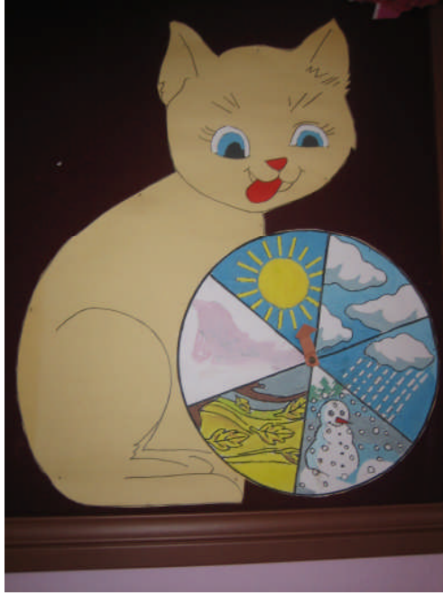
Resim 2.29: Mevsim şeridi