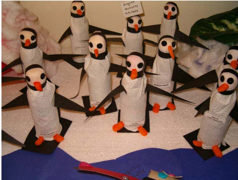
Resim 2.15: Havlu kâğıttan penguen yapımı

Öğretmen artık materyalleri olduğu gibi kullanmamalı, önceden işleminden geçirerek çocuklar tarafından kullanılabilir hale getirmelidir. Çünkü bu materyaller önceden kullanılmış oldukları için hijyenik olmayabilir. Öğretmenin bu malzemeleri çocukların kullanabilecekleri biçime getirmesi, çocuklarda ilgi ve motivasyonu artırma açısından önemlidir. Artık materyaller çocuklara sunulurken her gün tüm malzemeleri aynı anda ve aynı şekilde koymak yerine, birbiri ile bir arada kullanabilecek materyaller o gün eğitim programındaki amaç ve kazanımlar ile ilişkili olarak ipuçları verecek şekilde önceden biçimlendirilmeli ve bu materyaller özelliklerine göre gruplandırılarak düzenlenmesine dikkat edilmelidir.