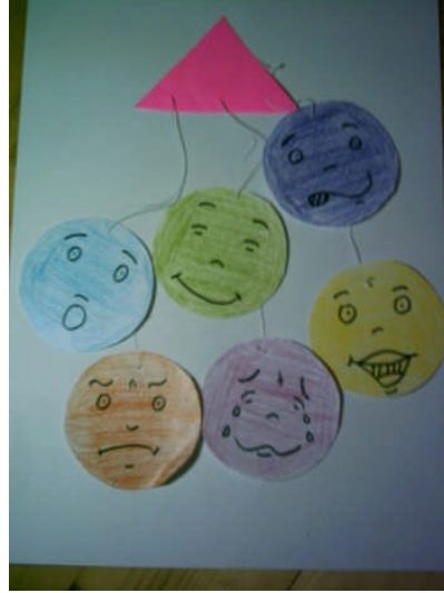
Resim 2.3: Kuru boyalardan ifade yapımı