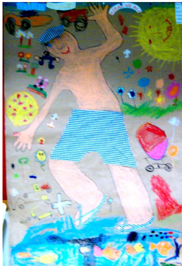
Resim1. 2: Kraft kâğıdıyla proje çalışması

Beyaz resim kâğıdının yanı sıra renkli fon kartonları, rulo kraft kâğıtları, naylon poşetler, köpük (strafor) panolar, kumaş, cam, metal yüzeyler, düz taşlar, şişe, kavanoz ve çeşitli büyüklüklerde karton kutular gibi üç boyutlu yüzeylerle duvar ve doku yüzeyler kullanılabilir.