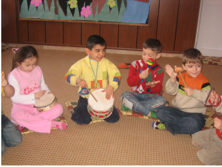
Resim 2.21: Mzik etkinlięi

duygusunun, mzik beęenisinin ve Őarkı szleri yoluyla kavram geliŐimi ve ocukların iyi alışkanlıklar kazanması aısından nemlidir. ocuklara gven ve baŐarı duygusu kazandırır. ocuk duygusal ynden rahatlar; gvensizlik, ekingenlik, saldırganlık, korku gibi olumsuz duygu ve davranıŐlar mzięin etkisiyle olumlu duygu ve davranıŐlara dnŐebilir. Grup iinde Őarkı sylerken veya mzik eŐlięinde hareket ederken arkadaşlarıyla uyum iinde olmayı ğrenirler. ocukların sesini kulaęını ve zevkini geliŐtirir.