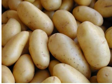
Resim 50: Dolmalık seçilmiş patates

Eşit ve orta büyüklükteki patatesler düzgünce soyulduktan sonra ortadan ikiye kesilir. (Daha küçük boyda patatesler tepelerinden düzgün bir şekilde ortalama 4-5 cm çapında kesilerek de dolma için bütün olarak hazırlanabilir).İçleri oyularak limonla ovulur. İstenilen dolma içi doldurularak kullanılır.