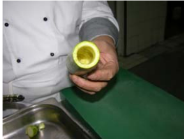
Resim 32: İçi alınmış kabak