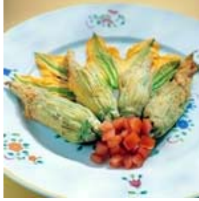
Resim 3.8 :Etli kabak çiçeği dolması