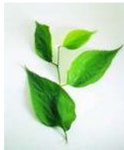
Resim 7:Ayva yaprağı