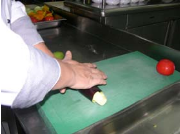
Resim 18 :Kabuğun avuç arasında yumuşatılması