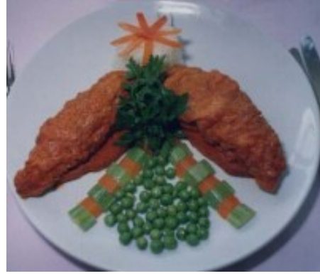
Resim 5.6:Sebzeli piliç sarma