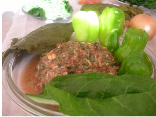
Resim 3.1:Etli dolma-sarma gereçleri