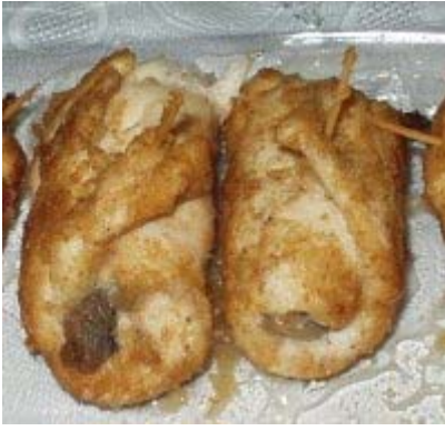
Resim 5.5:Piliç sarma