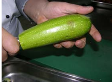
Resim 29: Bıçakla kabuğa yakın kısımlarının kesilmesi