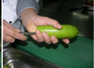
Resim 27:Bıçakla kabağa yakın kısmından içeri girilmesi