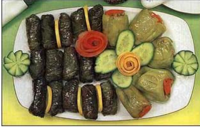
Resim 2.3: Servise hazırlanmış zeytinyađlı dolma ve sarma