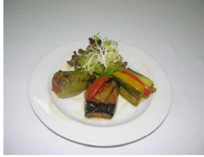
Resim 3.10 :Servise hazırlanmış nohutlu dolma

Aşağıda çeşitli yörelere özgü dolma ve sarma çeşitlerinden örnekler yöreleriyle birlikte verilmiştir: