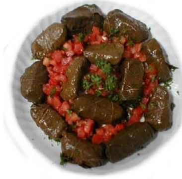
Resim3.2:Etlı yaprak sarması

Not: İstenirse terbiye kullanılmayabilir.