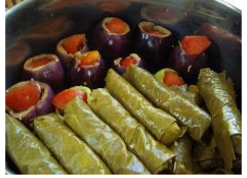
Resim 52 :Zeytinyağı patlıcan dolması ve asma yaprağı sarması