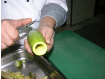
Resim 34: Kabuğun düzeltilmesi