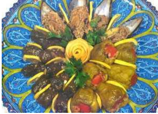
Resim 2.8:Zeytinyağlı kiraz yaprağı-biber-midyedolması