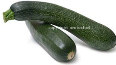
Resim 24 :Yeşil (kara) kabak