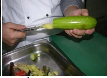
Resim 30: İçin, bıçakla çıkarılması