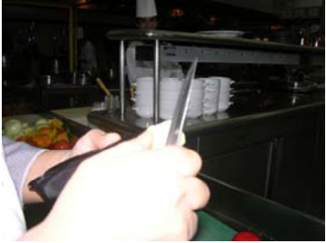
Resim 15 :Kenarının soyulması