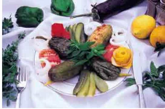
Resim3.9:Firikli acur dolması