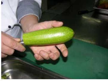
Resim 28: Bıçakla kabuğa yakın kısımlarının kesilmesi