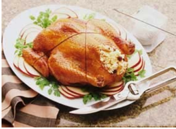
Resim 5.2: Servise hazırlanmış tavuk dolma