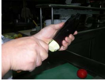
Resim 16 :Soyulan kısımdan bıçakla içeri girilmesi