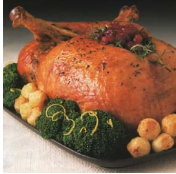
Resim 5.1:Garnitürlerle servise hazırlanmış hindi dolması

Kümes hayvanları terimi geniş kapsamlı bir kavram olup çeşitli hayvanları kapsamına alır. Örneğin; tavuk, hindi, ördek, kaz gibi kümes hayvanlarının hepsi menülerde ana yemek olarak kullanılırlar. Hindi genelde yılbaşı için yetiştirilir. En çok kullanılan şekli, fırında hindi dolmasıdır. Ayrıca tavuk dolma ve sarma çeşitleri de Türk mutfağıının özel çeşitleri arasında yer alır. Türk mutfağıında kümes hayvanlarının içi genellikle kemiklerinden ayrılmadan doldurulur. Batı ülkelerinin mutfaklarında ise kümes hayvanları ve av kuşları kemikleri çıkarıldıktan sonra doldurulur. Tavukların vb. nin derilerini ve etlerini fazla zedelemeyen çıkarmak zaman isteyen bir iş olmasına rağmen elde edilecek sonuç yemeğın görünüşünü ve lezzetini olumlu olarak etkiler.