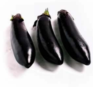
Resim 8: Patlıcan