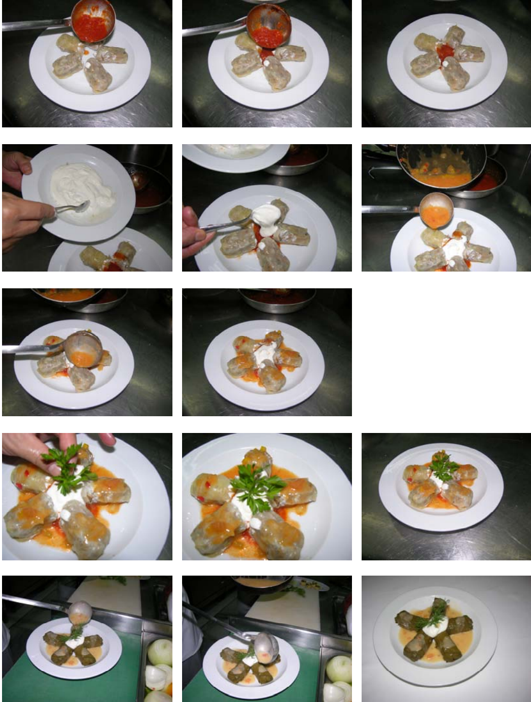
Resim 3.5 : Sarmaların sarımsaklı yoğurt, sos ve maydanozla servise hazırlanması