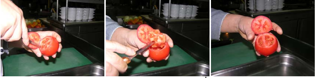
Resim46 :Domatesin içinin çıkartılması