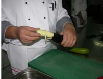
Resim 19 :İçinin çıkartılması