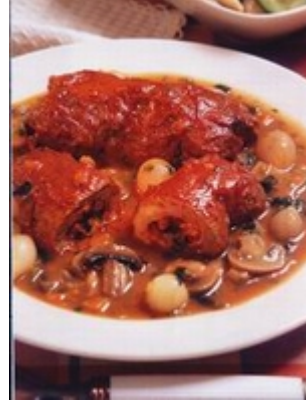
Resim 4.4: Mantarlı biftek sarma