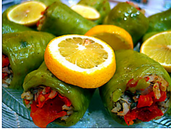
Resim 2.1: Zeytinyağlı biber dolması