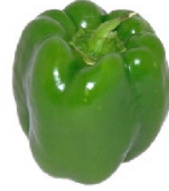
Resim 37 :Yeşil kare kısa dolmalık biber