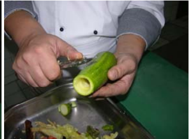
Resim 33: Kabuğun düzeltilmesi