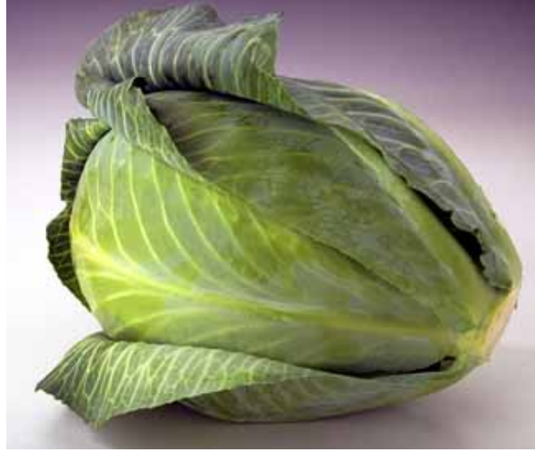
Resim 2: Lahana

Not: Taze ve salamura yaprağın haşlanmasıyla ilgili bazı farklı uygulamalarda vardır. Örneğin, haşlama suyuna limon suyu ilave edilerek de haşlanmaktadır.