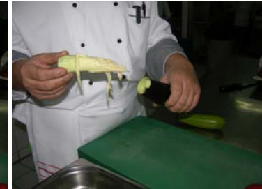
Resim 20 :İçinin çıkartılması