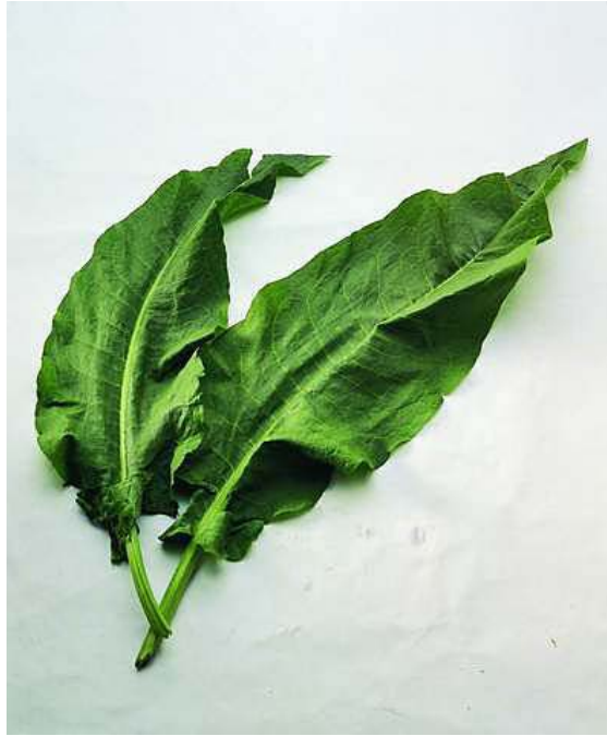
Resim3 :Efelek yaprağı