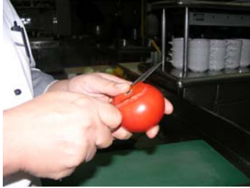
Resim43:Domatesin kapak kısmının bıçakla kesilmesi