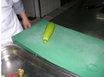
Resim 25:Kabağın seçimi