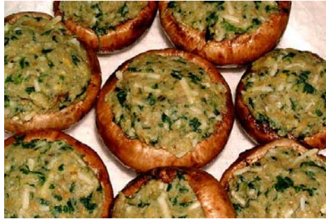
Resim 51: Mantar dolması