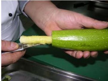
Resim 31: İçin, bıçakla çıkarılması