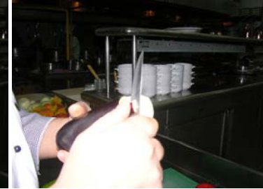
Resim 14 :Kenarının soyulması