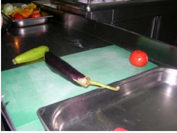
Resim 9 :Patlıcan seçimi