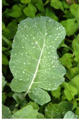
Resim 5 : Karalahana yaprağı