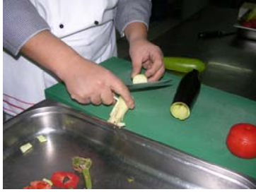
Resim 21 :Çıkartılan içten kapak içten yapılan kesimi