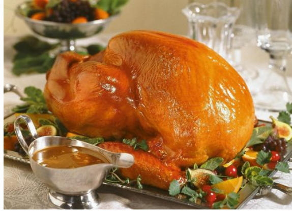
Resim 5.4:Süslenerek sosuyla birlikte servise alınmış hindi dolması

Arzuya göre, iç pilavın suyunu ilave etmeden önce, 250 g kestane şekeri ya da haşlanarak iç kabuğu soyulmuş kestane ile pişirilir.