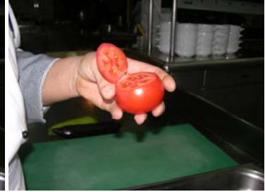
Resim45 :Domatesin kapak kısmının bıçakla kesilmesi