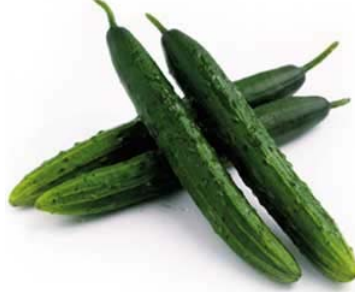
Resim 40 :Salatalık