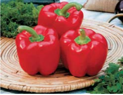
Resim 36: Kırmızı kare-kısa dolmalık biber