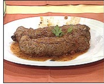
Resim 4.3:Pastırmalı biftek