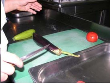
Resim 10 : Bıçak seçimi