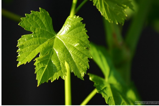
Resim1: Asma yaprağı