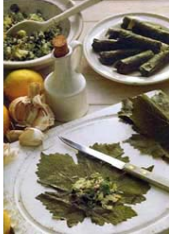
Resim 3.3 :Yaprağa iç koyulması

Etlı dolma ve sarma yapımında kullanılacak sebzelerin ve yaprakların hazırlanmasıyla ilgili bilgiler 1.ve 2.Öğrenim Faaliyetinde verilmiştir.