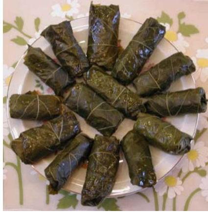
Resim3.4: Etlı yaprak sarması