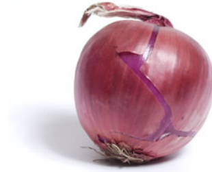
Resim53 :Dolmalık kırmızı kuru soğan