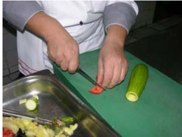
Resim 35: Domatesten kapak yapılması