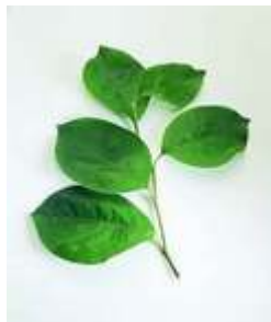
Resim 6:Dut yaprağı

Sarması yapılan diğer yaprak çeşitleri şunlardır: