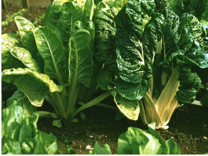
Resim 4 :Pazı yaprakları