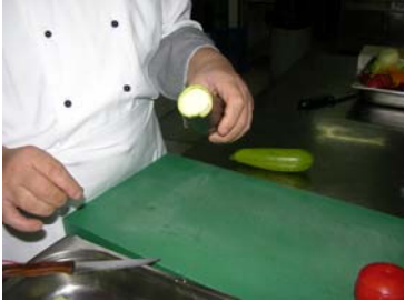
Resim 12 :Sapının alınması