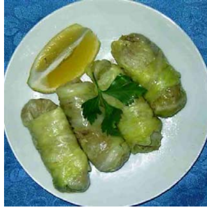
Resim 3.11:Ekşili lahana sarması

Aşağıda çeşitli yörelere özgü dolma ve sarma çeşitlerinden örnekler yöreleriyle birlikte verilmiştir: