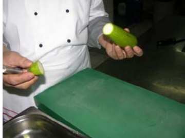
Resim 26: Kabak sapının kesilmesi