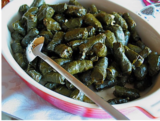
Resim 3.12:Kara lahana sarması