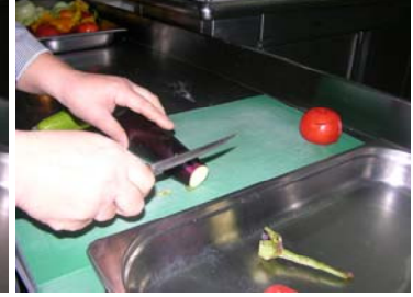
Resim 11 :Bıçağın kullanım şekli