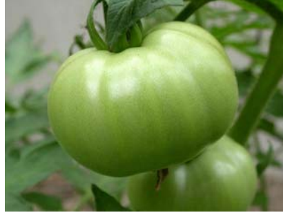
Resim 42 :Yeşil (ham) yıldız domates

Domatesleri satın alırken sert, parlak, kırışksız ve çatlaksız ve tercihen tek renkli olanlarını almak gerekir. Dolma yapımında kullanılacak domatesler orta boylarda seçilmelidir. Ayrıca Türk mutfağında ham olan yeşil domatesler de dolma yapımında kullanılırlar.