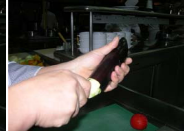
Resim 17 :Soyulan kısımdan bıçakla içeri girilmesi