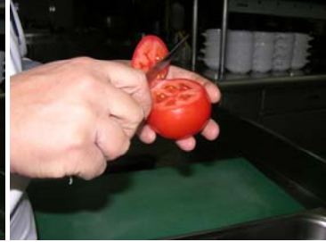
Resim44:Domatesin kapak kısmının bıçakla kesilmesi