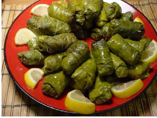
Resim 2.7: Yalancı sarma