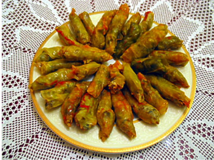
Resim 2.5:Zeytinyağlı bulgurlu lahana sarması