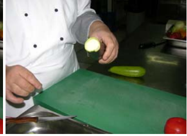
Resim 23 :Çıkartılan kapağın yerleştirilmesi