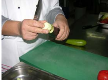
Resim 22 :Çıkartılan içten yapılan kapak