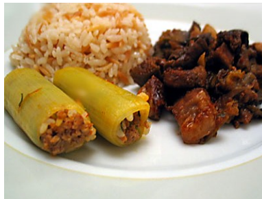
Resim 3.7:Etlı pırasa dolması