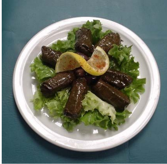
Resim 2.2: Zeytinyağlı asma yaprağı sarması