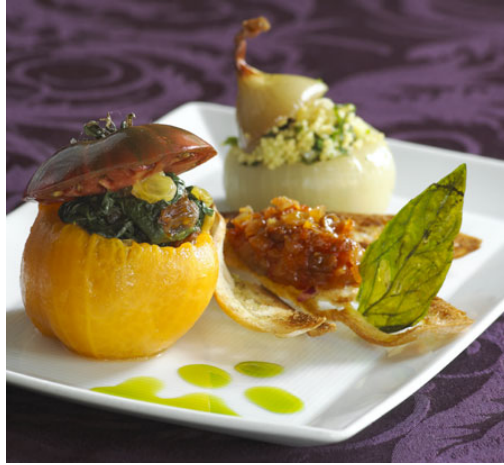
Resim 48 :Soğan dolması

Dolması yapılan diğer sebze çeşitleri ve hazırlıkları da şu şekildedir: