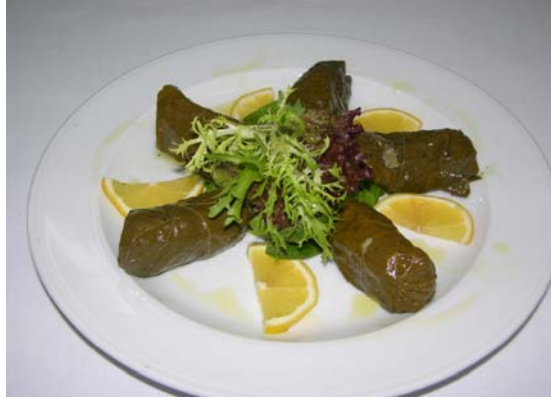
Resim 2.4:Yalancı sarma