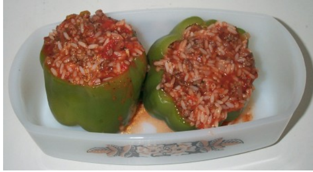
Resim 3.6 :Etlı iç doldurulmuş dolma biber