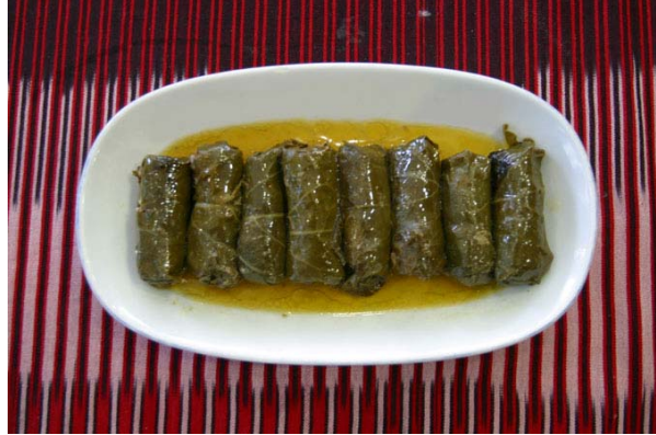
Resim 2.6: Asma yaprağında lor dolması

(Genellikle pazıya sarılarak yapılan bir iç çeşididir. Aşağıda verilen ölçüler ½ kg sarma yaprağı için kullanılacak miktardır)