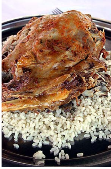
Resim 4.1:Kaburga dolması