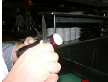
Resim 13 :Kenarının soyulması