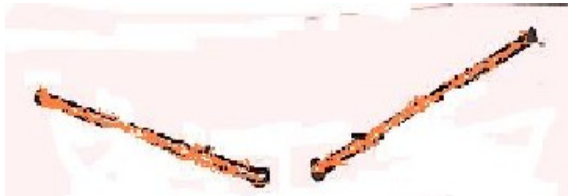
Şekil 5: Ritm sopaları

Gerekli Araç-Gereç: 30cmuzunluğunda yuvarlak sopalar,zımpara kâğıdı,küçük çanlar,guaj veya yağlı boya.