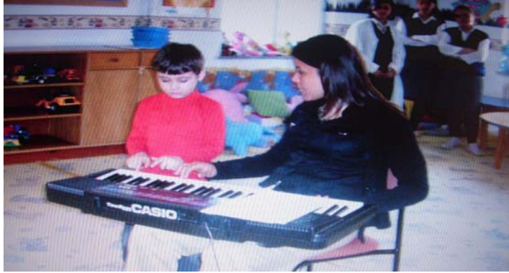
Resim 7:Müzik Etkinlikleri