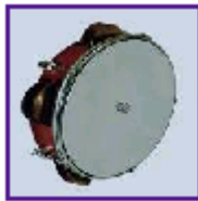
Resim 5:Tef (Sert, Sergül)

Müzik etkinliklerinde ritm çalışmalarında ve şarkı söyleme çalışmalarında en çok kullanılan ritm araçlarından biridir. Bu araç, yapımı çok kolay olduğu için öğretmen tarafından hatta öğrencilerle birlikte yapılabilir.