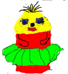
Şekil 1: İçi doldurulup, ağzı kapatılan şişe. Şekil 2: Marakasın, süslenmiş, hali