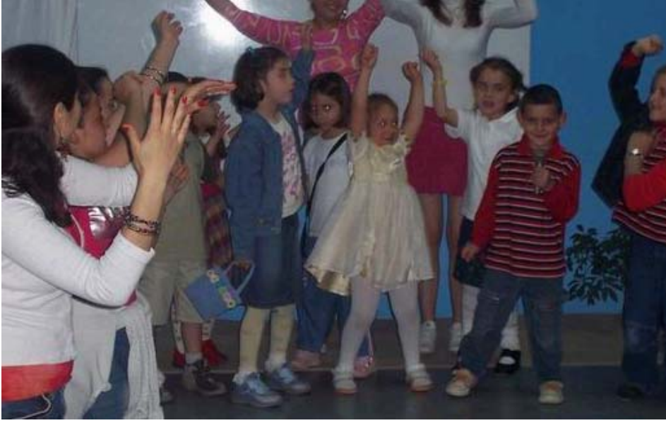
Resim 3: Müzik saatinde yaratıcı dans çalışması

Çocuklar hoplayıp, zıplayıp, yuvarlanıp duygularını hareketlerle ifade ederken, enerjinin dışı vurularak kullanımı da gerilimin azalmasına, rahatlamalarına katkı sağlar. Çocukta yaratıcılığın gelişimine katkıda bulunan bu çalışmalar, duygu ve düşüncelerini hareketlerle ifade etme becerisinin gelişmesine de yardımcı olur. Toplu olarak yapılan bir çalışma olduğu için sosyal gelişimine de katkıda bulunur. Yapılan hareketler vücut koordinasyonunu eşgüdüm), denge, esneklik gerektirdiği için psikomotor gelişime de katkıda bulunur.