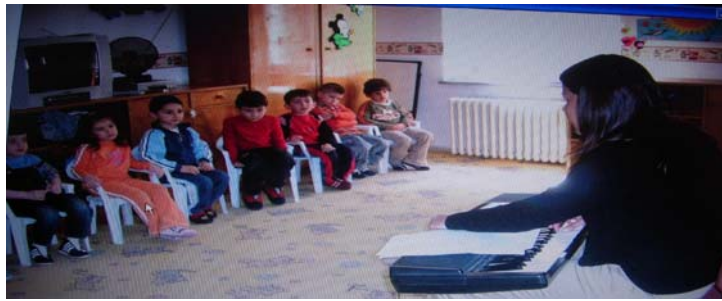
Resim 2: Ses dinleme çalışmaları

Bir başka ses dinleme çalışması da seslerin geldiği yönün tahmin edilmesi çalışmasıdır. Sesin arkadan mı, önden mi, sağdan mı, soldan mı geldiğini tahmin ederler. Sesin şiddetini yani alçak mı yüksek mi olduğunu kavrama çalışmaları da ses dinleme çalışmalarındandır.