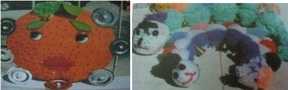
Resim 6:Artık materyaller kullanılarak yapılan zil örnekleri(Sert,Sergül)