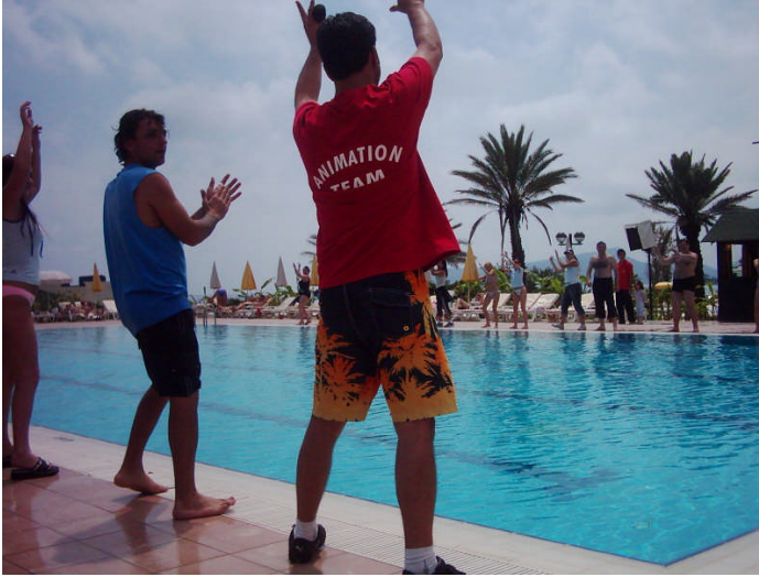
Resim 1 : Havuz Başı Aktiviteleri

Gün içinde havuz başında veya havuz içinde yapılan her türlü aktivite için kullanılan bir alandır. Su topu yarışmaları, su balesi, su jimnastiği çalışmaları, stretching (sabah sporu), su basketbolu vb. bir çok aktivite için havuz çalışma alanı olarak kullanılır.