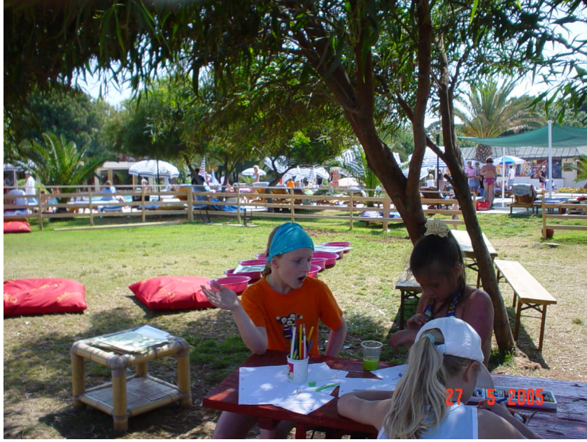
Resim 11 : Çocuk Kulübü Aktivite Alanlarından Bir Örnek