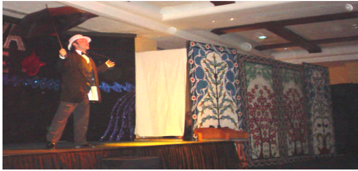
Resim 15: Dans Gösterisinden Bir Sahne

Ayrıca bazı aktiviteler, yapıldığında katılımcılarda belirgin sağlık problemlerinin ortaya çıkmasına neden oluyorsa, bu konuda da konuklar önceden uyarılmalıdır. Örneğin, bir kalp ya da tansiyon gibi sağlık problemleri olan katılımcılar için riskli olabilecek aktivite, spor, yarışma ya da oyunlarla ilgili olarak konuklar mutlaka bilgilendirilmeli ve bu konukların bu aktivitelere katılmamaları belirtilmelidir.