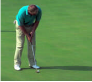
Resim 8: Golf

Golf gibi atıcılık ve binicilik de özel alanlar gerektirdiği için, tesisin yeterli ve uygun arazi ihtiyacı ortaya çıkar.