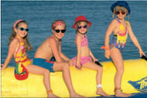
Resim 3 : Plaj Aktivitesi (Banana)Resim 4 :

Eğlence hizmetleri alanında en çok kullanılan çalışma alanlarından biridir. Uygulanacak aktivite çeşitliliği, tesisin sahip olduğu sahil bandının genişliğine ve yapısına bağlıdır. Artık klasikleşmiş 'Beach Volley (plaj voleybolu)'in yanı sıra; sörf, jet ski, banana vb. gibi aktiviteler de uygulanmaktadır.