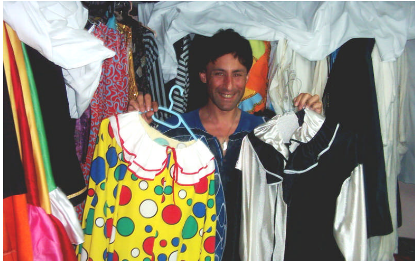
Resim 10 : Sahne Arkası

Tüm kostümler ve aksesuarlar gösteri boyunca kullanılmak üzere sahne arkasında bulundurulur, sahne akışı da yine sahne arkasında kuliste gerçekleştirilir. Bu nedenle, sahne ve sahne arkası olarak nitelendirilen çalışma alanları; rahat bir iş akışına imkan verecek şekilde oluşturulmalıdır.