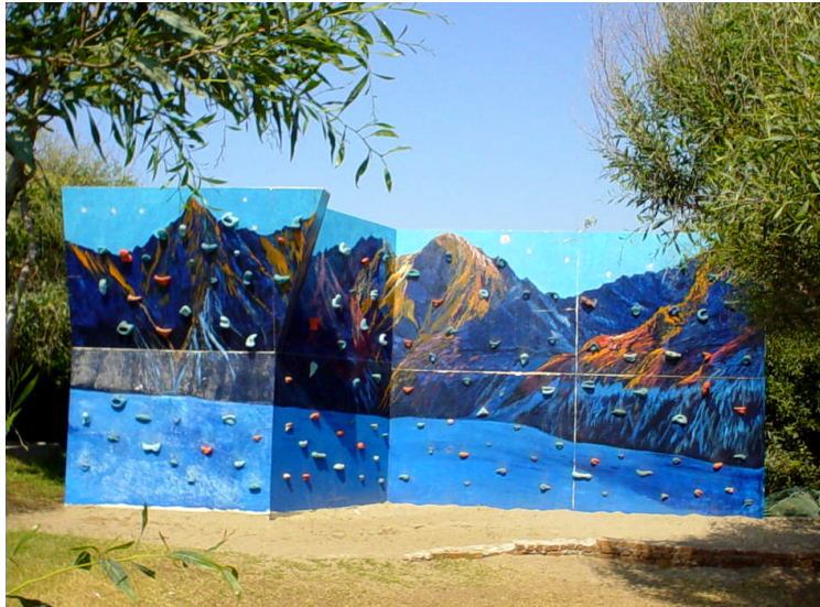
Resim 7: Tırmanma Duvarı

Bu tür hobby alanları tesisin sahip olduğu arazinin büyüklüğüne bağlı olarak tek bir alanda toplanabileceği gibi tesisin farklı alanlarına da dağıtılabilir.