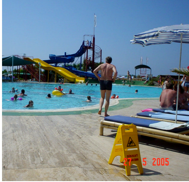
Resim 14: Kaygan Zemin Güvenlik Uyarısı

Ayrıca bazı aktiviteler, yapıldığında katılımcılarda belirgin sağlık problemlerinin ortaya çıkmasına neden oluyorsa, bu konuda da konuklar önceden uyarılmalıdır. Örneğin, bir kalp ya da tansiyon gibi sağlık problemleri olan katılımcılar için riskli olabilecek aktivite, spor, yarışma ya da oyunlarla ilgili olarak konuklar mutlaka bilgilendirilmeli ve bu konukların bu aktivitelere katılmamaları belirtilmelidir.