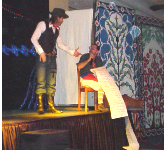
Resim 16: Animasyon gösterisinden bir sahne (Kovboy)

Kaza ve yaralanma gibi riskler sadece katılımcılar ya da konuklar için değil, aynı zamanda animatörler için de bu tip risklerle her an karşılaşılabilir. Örneğin; bir dans gösterisi sırasında kaygan bir zeminde dansçının ayağının kayması, çeşitli yaralanma ya da kırıklara neden olabilir. Böyle bir durum; hem konukların ve gösterinin olumsuz etkilenmesine, hem de aynı gösterinin belki de dansçı iyileşene kadar gerçekleştirilememesine neden olur. Her ikisinin sonucunda da ortaya konuk memnuniyetsizliği ve iş kaybı çıkar. Buna engel olmak için çalışma alanının sürekli kontrol edilmesi, gerektiğinde risk olabilecek durumların gösteri ya da aktivite sırasında bile ortadan kaldırılması gerekecektir.