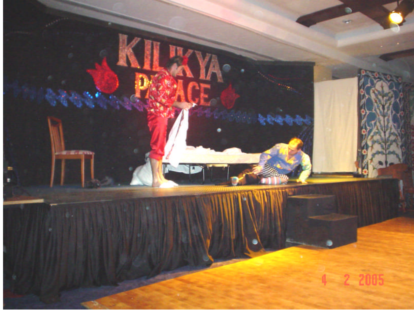
Resim 13:Show Sırasında Animatörler

değiştirilmesi vb. farklı tedbirlerin alınması ile mümkün olduğunca risk unsuru oluşturmayacak şekilde düzenlemelerin yapılması mümkündür.