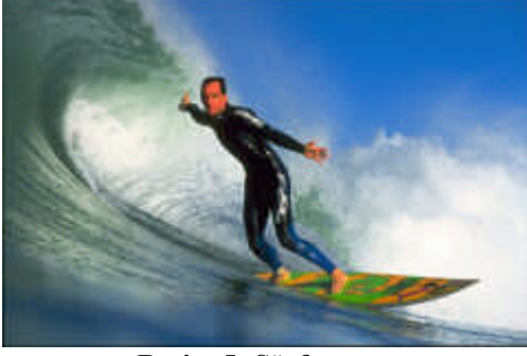
Resim 5: Sörf