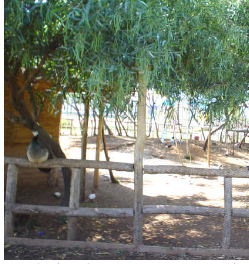
Resim 9 : Minyatür Hayvanat Bahçesi