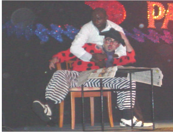
Resim 17: Animasyon gösterisinden bir sahne(Magic Doctor-Sihirli doktor)

Kaza ve yaralanma gibi riskler sadece katılımcılar ya da konuklar için değil, aynı zamanda animatörler için de bu tip risklerle her an karşılaşılabilir. Örneğin; bir dans gösterisi sırasında kaygan bir zeminde dansçının ayağının kayması, çeşitli yaralanma ya da kırıklara neden olabilir. Böyle bir durum; hem konukların ve gösterinin olumsuz etkilenmesine, hem de aynı gösterinin belki de dansçı iyileşene kadar gerçekleştirilememesine neden olur. Her ikisinin sonucunda da ortaya konuk memnuniyetsizliği ve iş kaybı çıkar. Buna engel olmak için çalışma alanının sürekli kontrol edilmesi, gerektiğinde risk olabilecek durumların gösteri ya da aktivite sırasında bile ortadan kaldırılması gerekecektir.