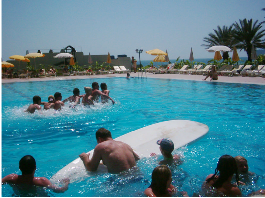
Resim 2 : Havuz Yarışmalarından Bir Örnek