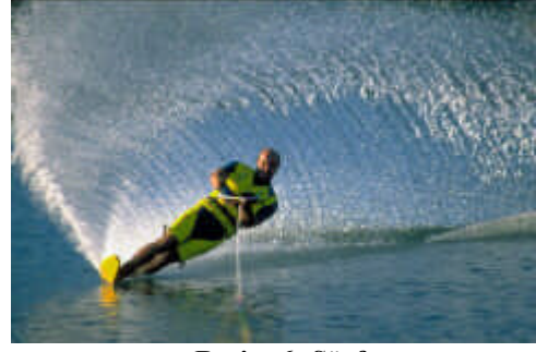
Resim 6: Sörf