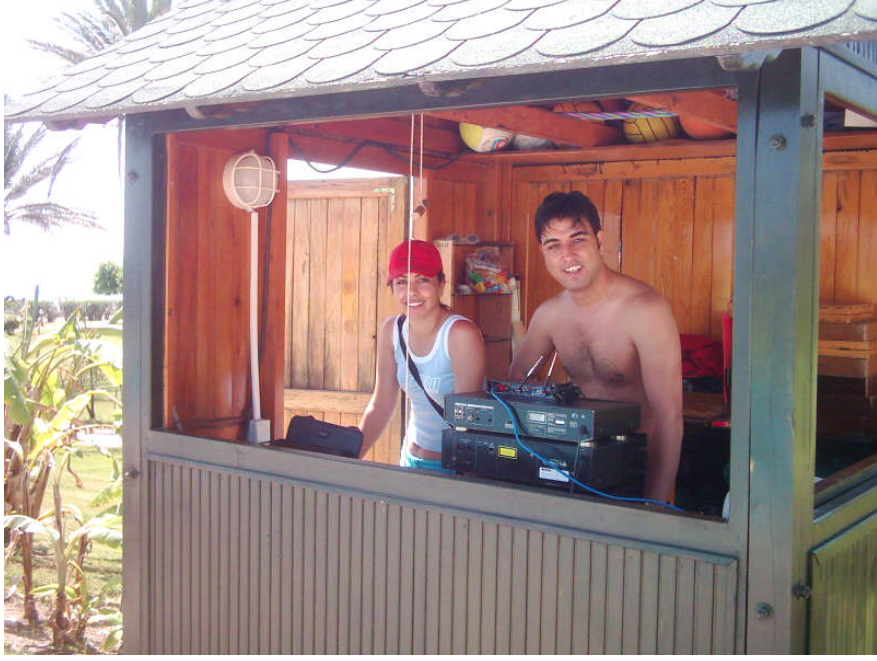
Resim 12: Havuz ve havuz başı aktivitelerinde kullanılmak üzere hazırlanmış ses kabini