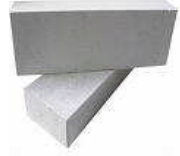
Resim 2.5: Ytong blokları

Ytong: Hafifliği ile yapıların deprem emniyetini artıran, tek katmanlı ve ekonomik duvar çözümü sağlayan bir malzemedir. Bloklar halinde satılır ve işlenebilme özelliğine sahip bir malzeme oluşu ile dekor ve aksesuar uygulamalarında da kolaylıkla kullanıma izin verir.