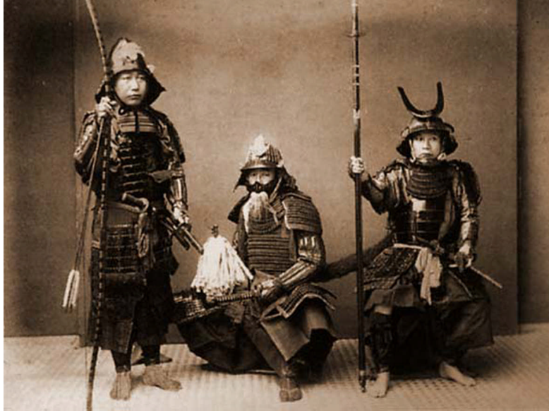
Resim 1.3: Japon tarihini yansıtan aksesuar ve kostümler