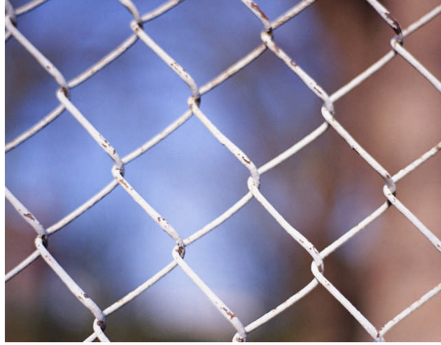
Resim 2.3: Tel ham maddesi kullanılmış bir tel örgü uygulaması