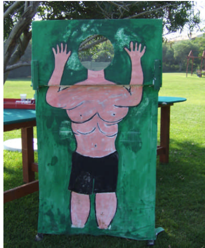
Resim 1.7: Panayır organizasyonunda yüze pasta atma oyunu için hazırlanmış dekor

Diğerleri olarak adlandırılan dekor çeşitleri yukarıda yer alan dekor çeşitlerinin dışında kalan ve tesis içerisinde, anfi tiyatro sahnesinin dışında da planlanan gösteriler, sunumlar ya da organizasyonlar için kullanılan materyallerdir. Tesis içerisinde farklı alanlarda düzenlenebilen prezantasyon şovları, temalı gün dekorları, özel kutlama dekorları, tesise gelen konukların karşılama ve uğurlanmaları esnasında kullanılan dekor ve aksesuarlar bu alanda yer alır.