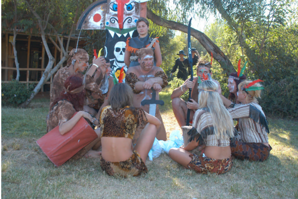
Resim 1.2: Kızılderililer üzerine kurgulanmış bir gösteri provasından görüntü