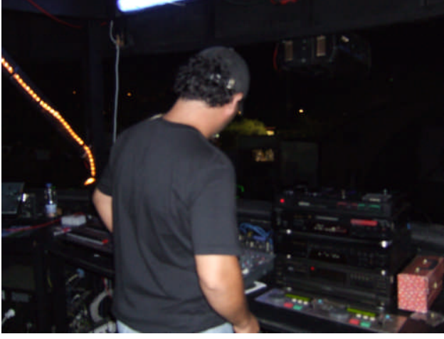
Resim 2.9: Ses ve ışık kontrol odası