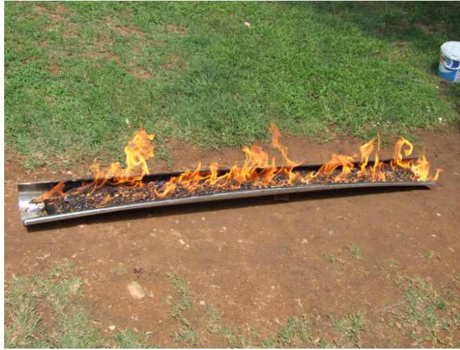
Resim 2.2: Alimünyum malzemenin yer meşalesi için şekillendirilmiş görüntüsü