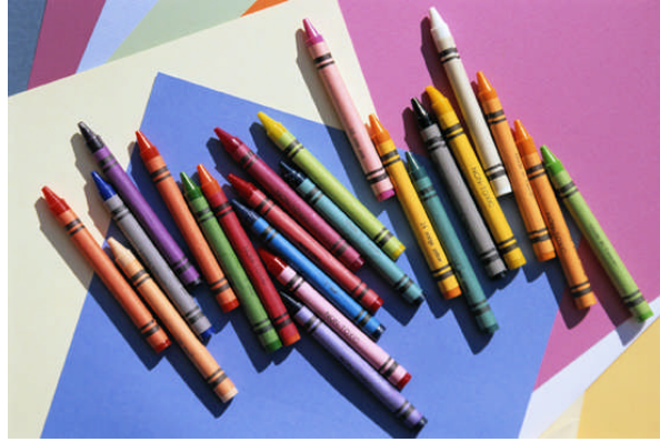
Resim 2.6: Farklı boya çeşitleri