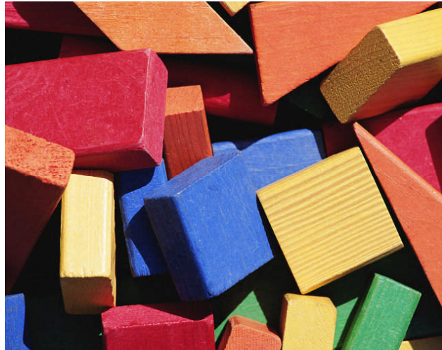
Resim 2.4: Ahşap malzemenin farklı şekillerde işlenmesi