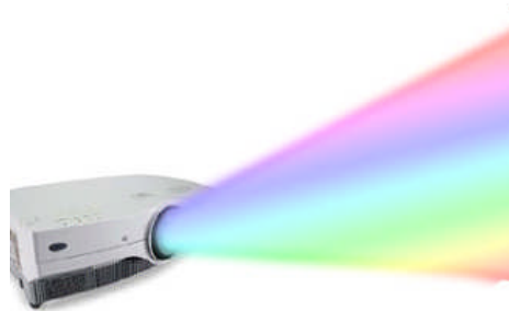
Resim 2.8: Barkovizyon

Görsel sunumlar; dekor ve aksesuarların yanı sıra, konuya uygunluk gösteren önemli parçaları oluşturur. Gösterinin teması uygun olarak tercih edilebilen görsel sunumlar farklı teknikler kullanılarak uygulanır. Şov esnasında sahne arkasında yapılan video-CD gösterileri, barkovizyon sunumları, ışık sistemleri ile sağlanan efektler, ses efektleri görsel sunumlara örnek olarak verilebilir. Genellikle temayı, verilmek istenilen duyguyu kuvvetlendirmek ve güçlü yaşatmak amaçlı kullanılır. Destekleyici unsurdur ve konuklar üzerinde istenilen etkiyi yaratır. Ancak gerek hazırlama aşamasında gerekse sunum aşamasında profesyonel kişilerce çalışılmalıdır.