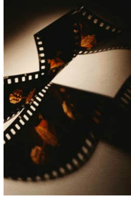
Resim 2.10: Film ve video sunumları