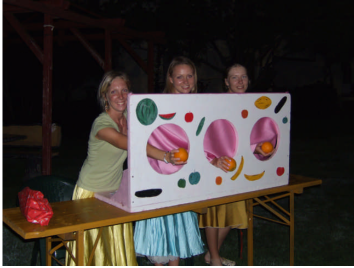
Resim 1.6: Bir panayır organizasyonunda çocuklar için hazırlanmış bir oyun dekoru