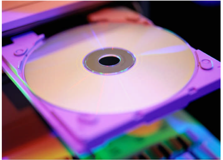
Resim 2.11: CD sunumları