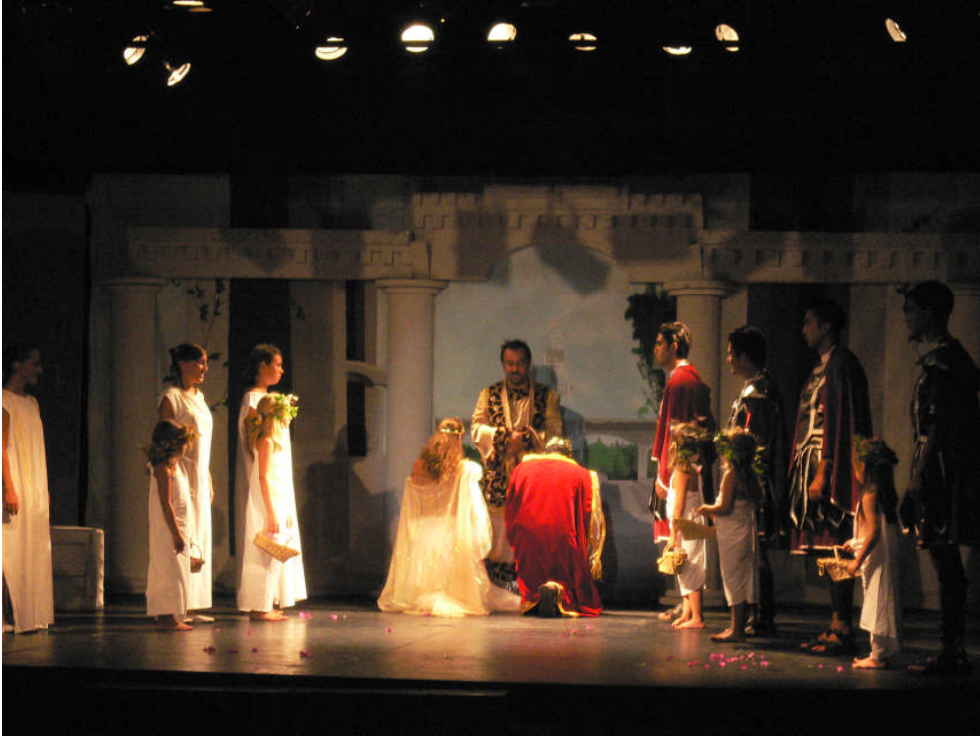
Resim 1.1: Bizans döneminde geçen bir gösterinin dekor ve aksesuarları