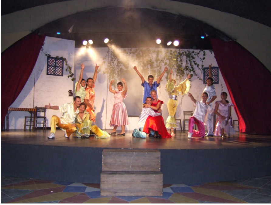
Resim 1.5: Müzikal dekorlara bir örnek “Mamma Mia” şovundan bir sahne