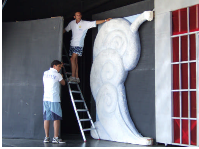
Resim 2.1 Strafor malzeme kullanılarak yapılmış bir dekor montajı