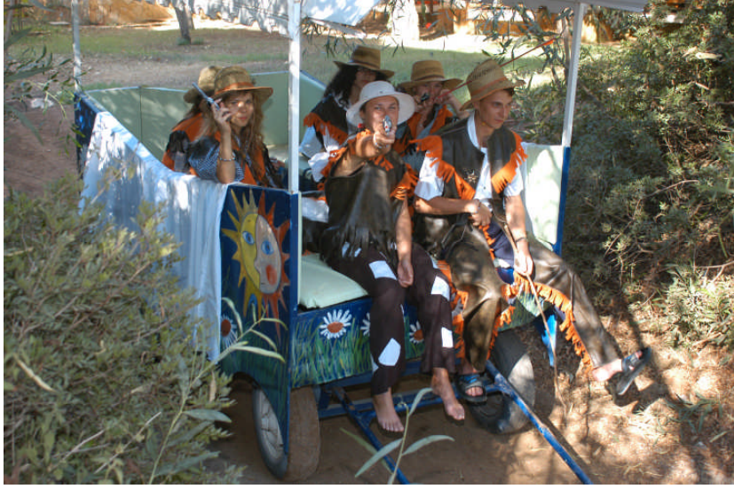
Resim 1.8: Tesisin bahçesinde yapılan bir gösteride kullanılan dekor ve aksesuarları