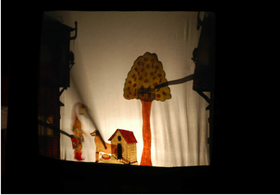
Resim 1.4: Türk kültürünü yansıtan bir Hacivat-Karagöz gösterisinden bir görüntü