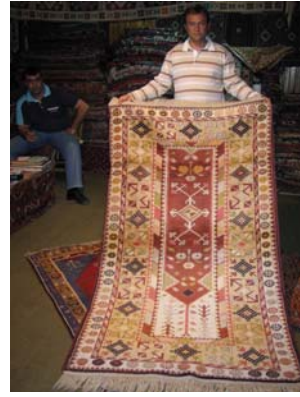
Resim1 : Arzu Taşkıran Sağıroğlu “Anadolu’da Kilim”

Kısaca, kültür, toplumun yüzlerce, binlerce yıldan beri oluşturduğu ortak amaçların, beklentilerin, değerlerin, inançların, duygu ve düşüncelerin, özetle ortak davranış kalıplarının depolandığı, saklandığı toplumsal bir bellek diyebiliriz.