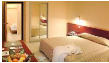
Resim 1.3: Connecting room

c) Connecting Room (Birbirine içten geçiş kapısı bulunan yan yana oda ): Genellikle çocuklu ailelerin tercih ettiği birbirlerine bağlantısı bulunan oda tipidir. .(Resim 1.3)