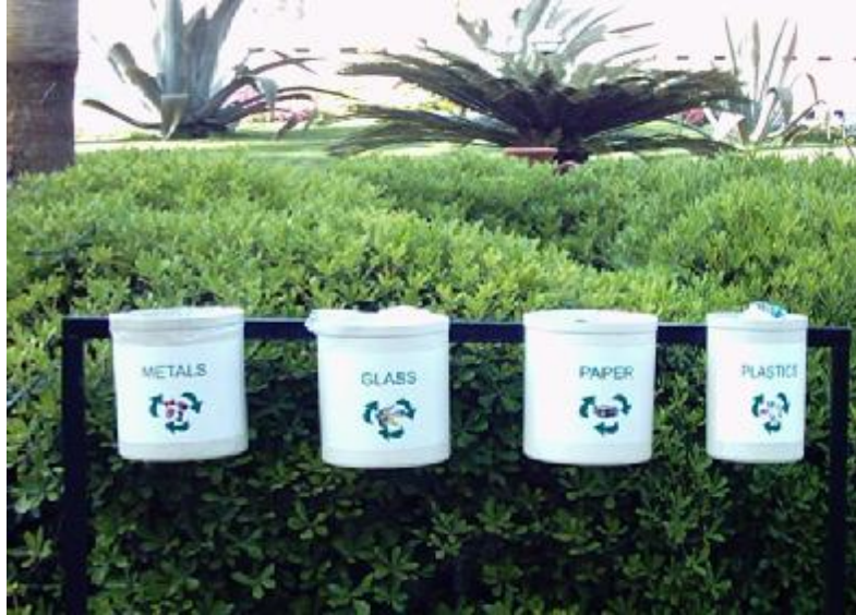
Resim 3. 3: Atık çeşidine göre çöp kutuları

Kullanıldıktan sonra standartlara uygun olarak toplanan, sanayide işlenerek tekrar kullanıma sunulan, kullanılabilir (kağıt, çam eşya, plastik eşyalar vb.) madde haline getirilebilen atıklara dönüşümlü çöp diyoruz. (Resim 3. 3)