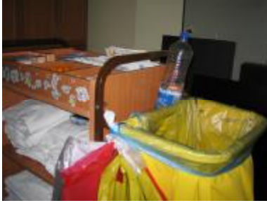
Resim 3.4: Kat arabasındaki çöp tobası

Çöpler toplanırken hepsi aynı yere konulmamalı, çeşitlerine göre sınıflandırılarak ayrı yerlerde toplanmalıdır. (Resim 3. 4)