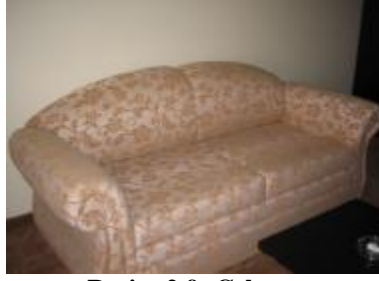
Resim 2.9: Çek-yat