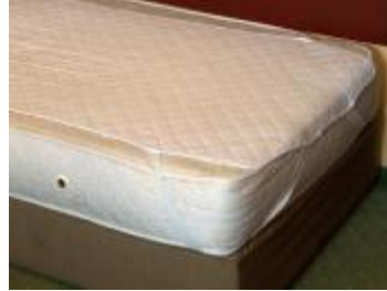
Resim 2.2: Yatak koruyucunun geçirilmesi

Kirli yatak takımları toplanırken yatak takımları içerisinde konuğa ait herhangi bir şey kalıp kalmadığı kontrol edilmelidir. Ayrıca, lekeli yatak takımları diğerlerinden ayrılmalı, işaretlenmeli (köşesine bir düğüm atılarak işaretlenebilir veya bir poşete konular üzerine oda numarası yazılır) çamaşırhaneye ayrı olarak gönderilmelidir. Yastık kılıfı dikkatlice çıkarılmalıdır. Bunun için yastık kılıfının kapak kısmı açılmalı ve yastık köşelerinden tutularak kılıf üzerinden sıyrılmalıdır. Dikkatsizce yapılacak bir işlem yastık kılıfının yırtılmasına neden olacaktır. Köşelerdeki battaniye ve çarşaf, çekiştirmeden dikkatlice çıkarılmalıdır. Önce battaniye temiz bir yere (sandalye, koltuk vb.) bırakılmalı, daha sonra çarşaf bohça şeklinde toplanmalıdır. (Resim 2. 1)