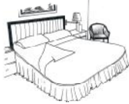
Resim 2.10: Yataklar açma

Odada kalan konukun özel isteği üzerine yapılan bir hizmettir.