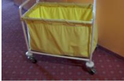
Resim 2.1: Kirli arabası