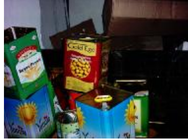
Resim 3.5: Metal atık deposu