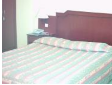
Resim 1.6: Yapılmış yatak