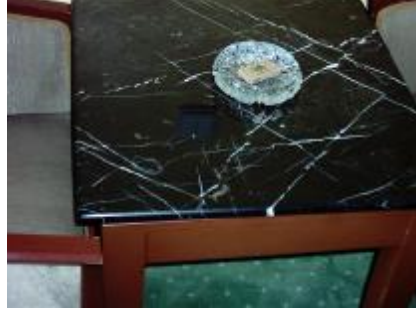
Resim 3. 8: Küllük tablası

Oda temizliđine bařlarken ilk yapılacak iř küllük tablasının temizlenmesidir. Küllük tablası temizlenmeden pencere açılacak olursa, küllük tablalarında uçuşacak küllük odaya yayılır.