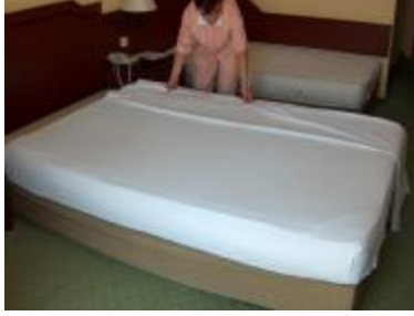
Resim2.5 Alt çarşaf açma 3