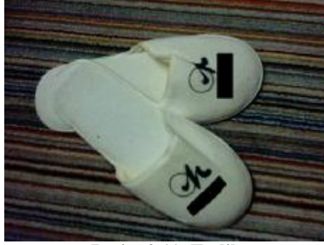
Resim 2.11: Terlik