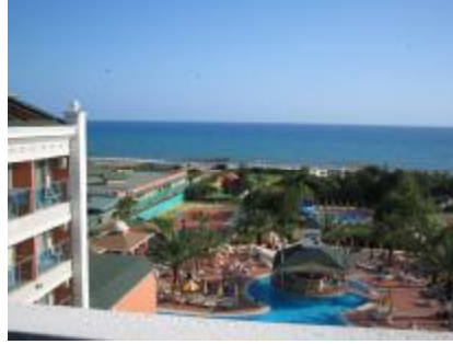
Resim 1.4: Corner room

f) Corner Room (köşe oda): Otellerdeki köşe odalarıdır. Bu odalar manzara olarak tercih edilir.(Resim 1.4)