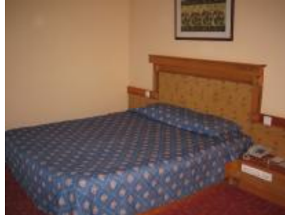
Resim 1.1: Çift kişilik yatak

c) İki kişilik oda (twin bed): Konuğun gereksinimini karşılayacak, donanımlarla düzenlenmiş, hacim olarak daha büyük içerisinde iki tane tek kişilik yatağın bulunduğu oda tipidir.