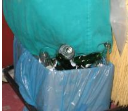
Resim 3. 9: Kat arabasında cam atıklar

Banyo çöp sepetleri plastik veya metal malzemedendir yapılır, kapaklı ve plastik çöp pořeti kullanılabilir olmalıdır. (Resim 3. 9)