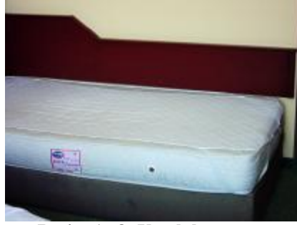
Resim 1 . 8: Yatak koruyucu

Yatak yıkanabilen bir malzeme değildir. Yatağın kirlenmemesi için, pamuklu dokumadan yapılmış yatak koruyucu alt çarşaftan önce yatağa serilir. Böylece herhangi bir leke ya da ıslaklık yatağa geçmeden yatak koruyucuda kalır. Yatak koruyucu sadece yatağı korumakla kalmaz, teri de emer. Bu nedenle sağlık açısından son derece önemlidir. Ayrıca, leke tutmayan malzemelerden yapıldığı ve kolay yıkana bildiği için de kullanışlıdır. Yatak koruyucu yatağın üst yüzünü kaplamalı, yataktan büyük veya küçük olmamalıdır. (Resim 1. 8)