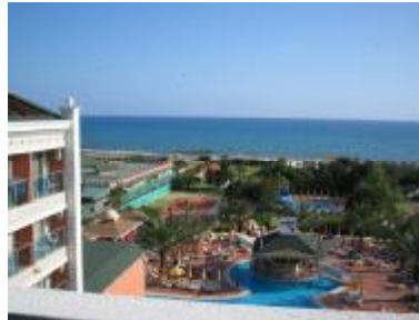
Resim 3. 7 :Otelin çevresi

Otel işletmelerinin kurulduđu yer ve faaliyet gösterdiđi bölgedir. Konukların işletmemizde kaldıđı sürece çevrede oluřan kötü görüntü ve kokulardan rahatsız olmaması için otel işletmecileri gereken tüm tedbirleri alırlar.