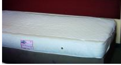
Resim 1.7: Yaylı yatak

b) Yaylı Yataklar ve Özellikleri: Oteller için en uygun ve kullanışlı olanı, yaylı yataklar; yayların üstü ve altı, pamuk ve yün ile kapitone edilmiş 'ikiz yatak' denilen yatak türüdür. Mevsime göre yün ya da pamuk tarafı çevrilerek kullanılır.