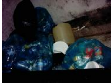
Resim3. 6: Plastik atık deposu

İnsan sađlıđını tehdit etmeyecek, dıřarıya karřı Resim1 Ihijyen řartlarının sađlandıđı ve çöplerin kolay nakil edilebileceđi ortamlarda depolanmalıdır.