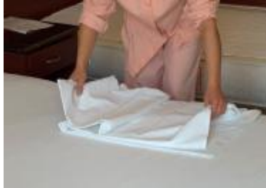
Resim2.3: Alt çarşaf açma 1

Alt çarşaf yatak koruyucunun üzerine serilir. Çarşaf yatağın iki tarafından eşit olarak sarkmalıdır.