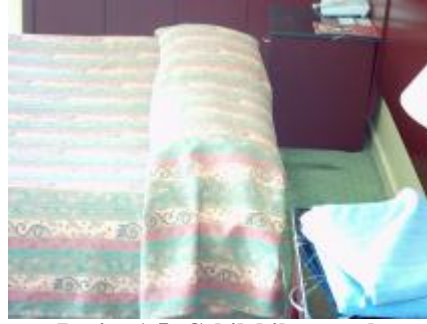
Resim 1.5: Çekilebilen yatak