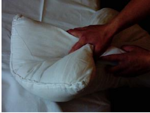
Resim2.7: Yastık kılıfı takma