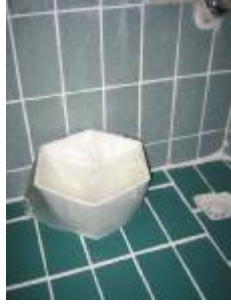
Resim 3.1: Çöp poşeti