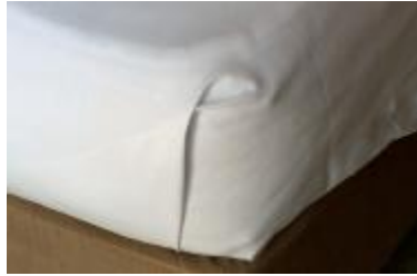
Resim 2.6: Köşe yapımı

Üst çarşaf, kenarlardaki dikiş yerleri üste gelecek şekilde yerleştirilir. Üst çarşafın yatak başından 10 cm. sarkacak şekilde yerleştirilmesine dikkat edilmelidir. Bu kısım daha sonra battaniyenin üstüne katlanacaktır. (Res 2.6)