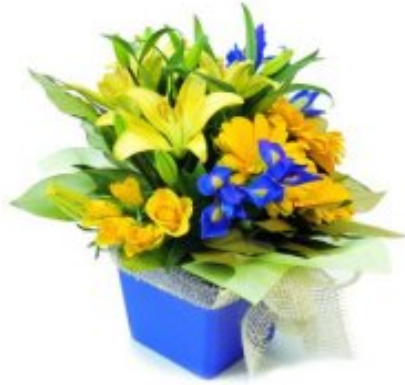
Resim 24: Renk uyumu