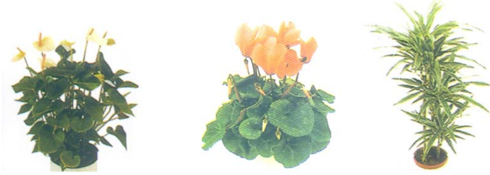
Resim 16: Çeşitli saksı bitkileri

Otelin iç mekânlarında kullanılan yapay çiçekler, doğal çiçeklere göre daha uzun ömürlü ve bakımı kolaydır. Yapay çiçekler, daha uzun ömürlü ve bakımı kolay olsa da canlı olan saksı bitkilerinin yerini tutmaz. Saksı bitkilerinin kendine has doğal bir kokusunun ve renginin olduğu unutulmamalıdır (Resim 16).