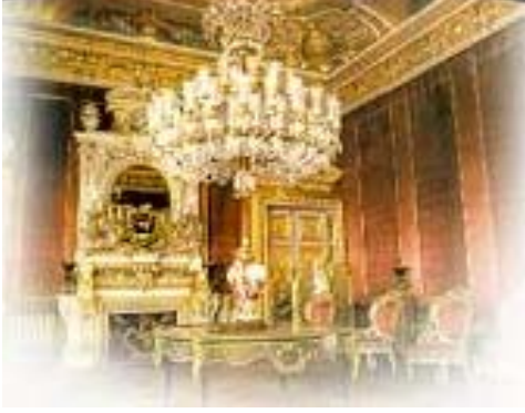
Resim 1: Osmanlı dönemi saray dekorasyonu