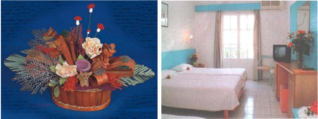
Resim 18: Vazo ve sepetlere çiçek düzenleme

Çiçek yerleştirmek için kullanılan kaplar düz renkte olmalı, fazla dikkat çekmemelidir. Çiçeğin rengi, yerleştirileceği yerin döşeme ve fon rengine uygun olmalıdır. İlk bakışta kap değil çiçek görülmelidir (Resim 18).