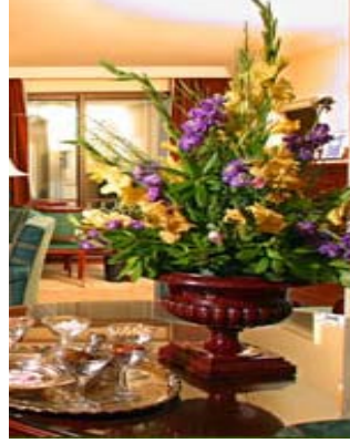
Resim 25: Zıt renkler.