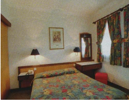
Resim 10: Dar ve geniş odada mobilya düzenlemesi örnekleri

Oda eğer dar ve küçükse buna uygun ebatlarda mobilyalar seçilmelidir (Resim 10). Seçilen bu mobilyalar duvarlara yakın konulmalıdır. Böylece oda geniş görünecektir ve kullanılacak alan daralmayacaktır. Odaya konulacak mobilyalar odanın büyüklüğü ile doğru orantılı olmalıdır.