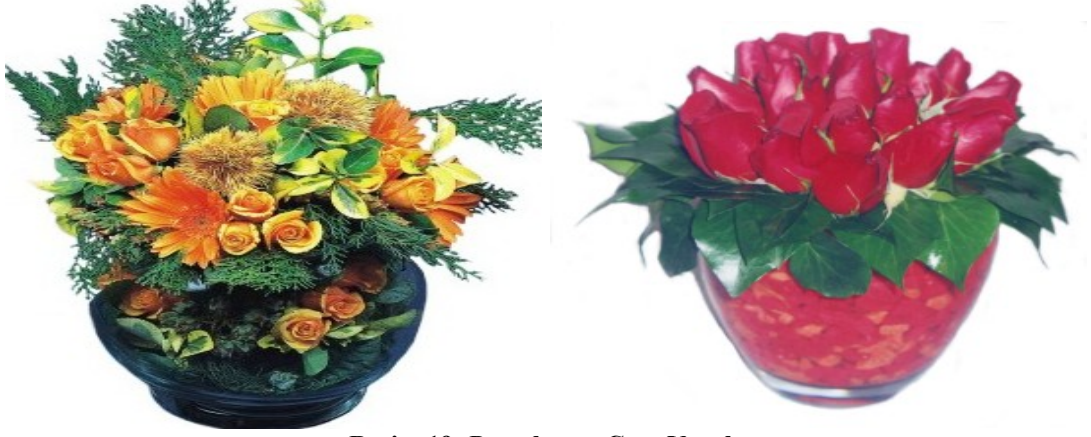
Resim 19: Porselen ve Cam Vazolar

Canlı veya cansız çiçekleri bir araya koymak için kullanılan farklı farklı büyüklükte, renkte, ölçüde, şekilde, desende olan cam, porselen, metal, toprak, pirinç gibi malzemelerden yapılan kaplardır (Resim 19).