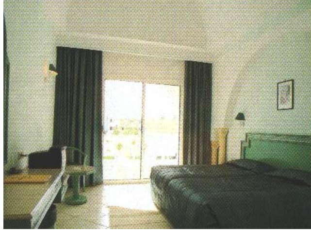
Resim 12: Kalın perdelerin yatak odasında kullanımı

Oturma odası, otel misafirlerinin oturup sohbet ettikleri, müzik dinledikleri yerlerdir. Bu nedenle bu tür mekânların rahat ve iç açıcı olması gerekir. Odaya konulan mobilya, renk ve şekilleriyle perdeler daima uyumlu olmalıdır. Eğer fazla güneş almıyorsa hem tül hem de perde görevini birlikte yapan; desenli desensiz kumaş türlerinden seçilebilir(Resim 13).