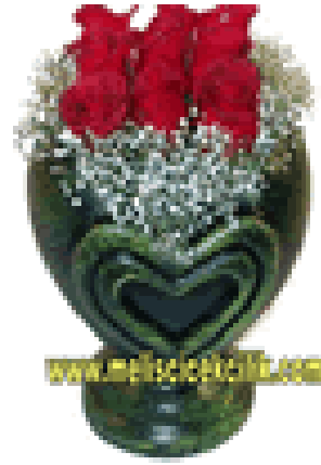
Şekil 22: Çiçeklerde denge düzenlemesi