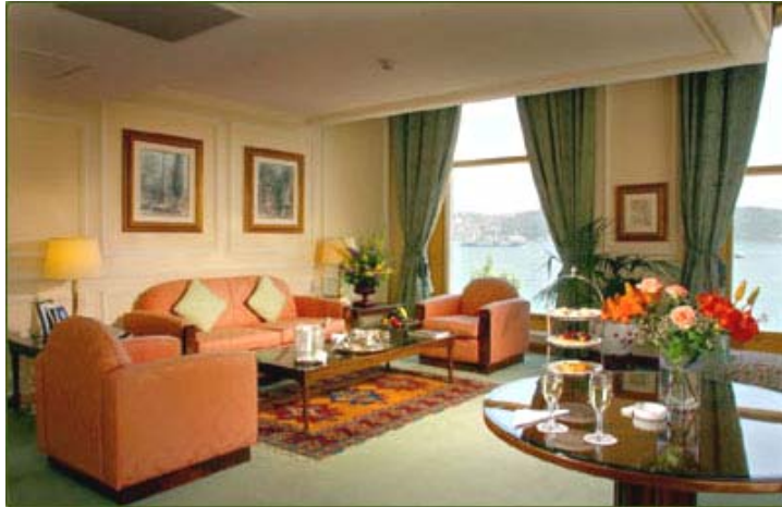
Resim 13: Oturma odasında perdelerin kullanımı.

Oturma odası, otel misafirlerinin oturup sohbet ettikleri, müzik dinledikleri yerlerdir. Bu nedenle bu tür mekânların rahat ve iç açıcı olması gerekir. Odaya konulan mobilya, renk ve şekilleriyle perdeler daima uyumlu olmalıdır. Eğer fazla güneş almıyorsa hem tül hem de perde görevini birlikte yapan; desenli desensiz kumaş türlerinden seçilebilir(Resim 13).