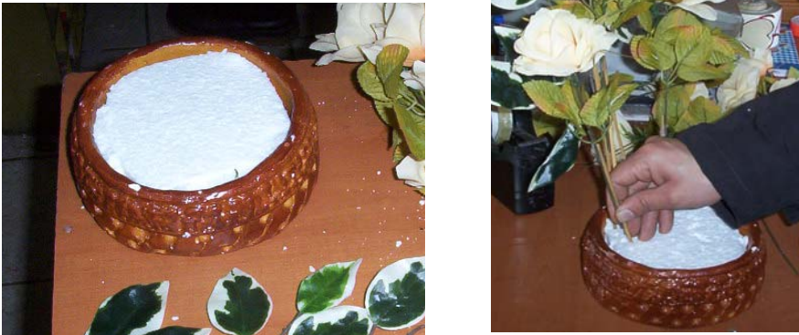
Resim 20: Strafor köpük

Strafor Köpük: Çiçek kaplarının içine konulan yapay çiçekleri ve yapraklarını sabit olarak tutan bir malzemedir (Resim 20).