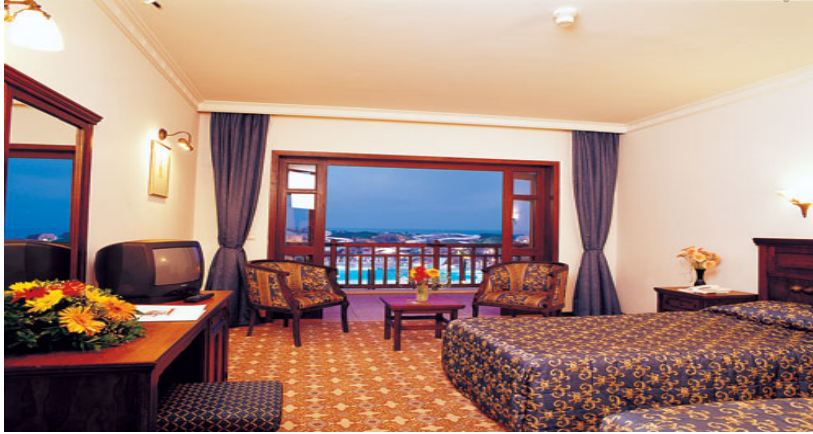
Resim 15: Halıların alandaki eşyalara göre kullanımı.

Desenli halılar genelde sabit değildir. Desensiz düz halılar ise daha çok duvardan duvara olan halılardır. Bu durum her zaman geçerli değildir. Tercihe bağlıdır (Resim 15).