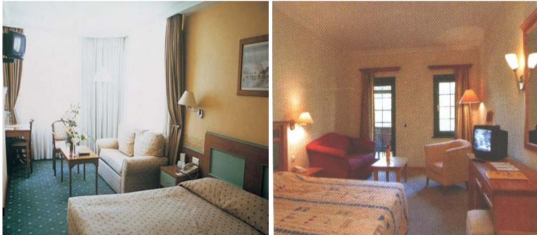
Resim 7: Güneş gören ve görmeyen odalarda renk seçim örnekleri