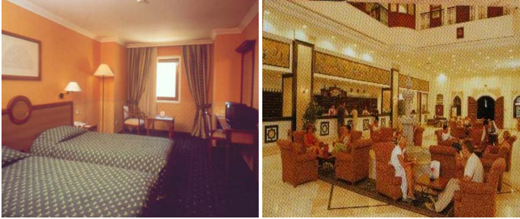
Resim 6: Alanların kullanım özelliğine göre renk düzenleme örnekleri