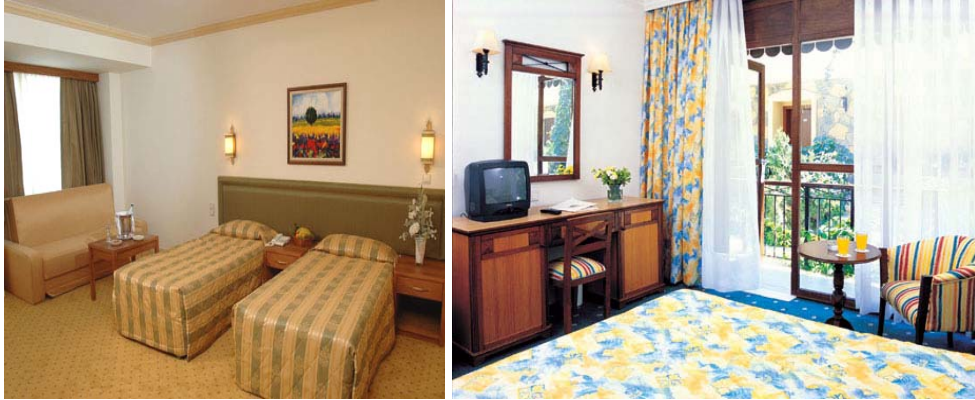
Resim 8: Büyük ve küçük odaların renklerle düzenlenmesi

Odaların tavan yükseklikleri de unutulmamalıdır. Tavanlar genellikle duvardan üç ton daha açık boyanmış olarak gözümüze çarpar. Bu genelde çok uygulanır. Tavan, duvarlarla aynı renkte boyanabileceği gibi zıt bir renkle de boyanabilir. Örneğin; yeşil veya soluk yeşil, bej ve kahverengi gibi doğa renkleri arasında düzenlenen bir odada açık mavi bir tavan insanlara gök hissini verecektir.