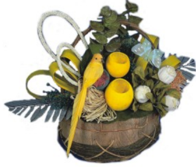
Resim 21: Değişik fon malzemelerinin kullanılışı