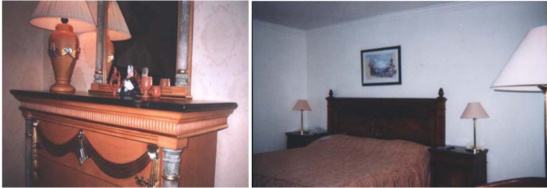
Resim 11: Alandaki eşyaların birbirini tamamlamasına örnekler

Bazen var olan temel eşyalar kullanılarak, yeni bir düzenleme yapılması gerekebilir. Bu durumda alınacak yeni materyaller diğerleri ile renk, ölçü ve stil bakımından uyum içerisinde olmalıdır.