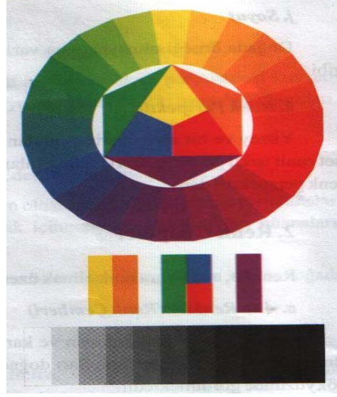
Resim 4: Renk Cetveli (Çemberi)