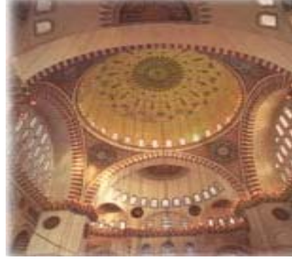
Resim 2: Osmanlı dönemi cami süslemesi