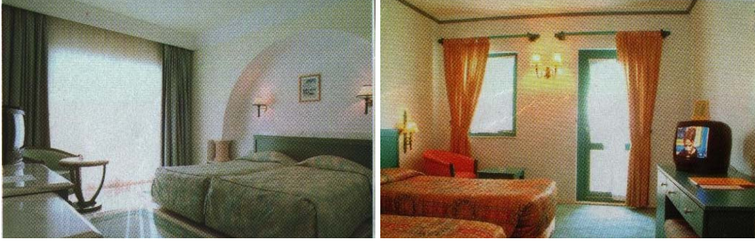
Resim 5: Yeşil ve turuncu renklerle döşenmiş odalar

Kırmızı, sarı, turuncu olan sıcak renkler kullanıldığı alanı, büyük ve yakın gösterir. Mavi, yeşil, mor olan soğuk renkler buldukları alanı ve cisimleri daha küçük ve daha uzak bir etki bırakır (Resim 5).