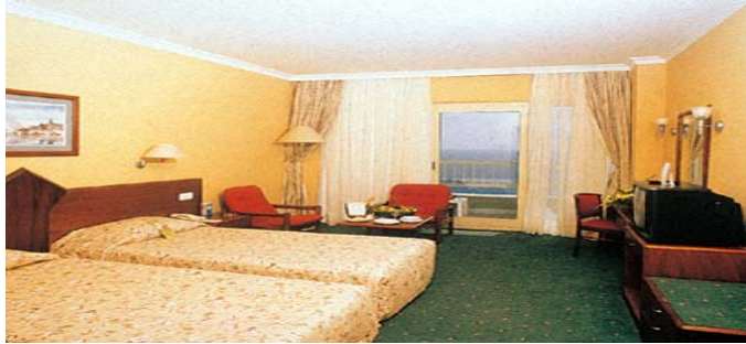
Resim 9: Zıt renklerin kullanımı

Zıt renkli eşyalar, odanın içine dikkatle dağıtılmalıdır. Bütün zıt renkli eşyaların bir tarafa yerleştirilmesi durumunda, odanın bir tarafı ağır çekiliyormuş gibi görünüm kazanmasına neden olur. Zıt renkler, odaya ahenkli şekilde dağıtılsa, gözün birinden diğerine geçişte takılmalar önlenir. Hiçbir zaman zıt renkler aşırı şekilde kullanılmamalıdır. Çok güzel olan bir şeyin bile fazlası insanı yorar. Bazı renkler fazla çekici olabilir. Bu da renge hassas olan insanları asabileştirir. Bazı kimselerin nasıl kapalı yerde durma fobisi varsa, bazılarının da renk kompleksi vardır. Renklerin insan psikolojisi üzerinde olumlu ve olumsuz etkileri olacağından dolayı aşırılıktan daima kaçınılmalıdır (Resim 9).