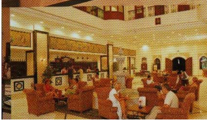
Resim 14: Perdelerin lobi ve salonlarda kullanımı.

Halılar, otelin en değerli ve pahalı eşyalarından biridir. Rengi ve kalitesi iyi seçilmiş halılarla döşenmiş alanlar göz alıcı, ilgi çekici hale geldiği gibi insanlara rahatlık ve ferahlık da verir. Otellerde halılar, gürültüyü önlemek ve süslemek amacıyla kullanılır. Yatak odalarında sıcak renklerdeki desenli ve desensiz yumuşak halılar; yemek odası, oturma odası ve bunun gibi salonlarda temizlik ve ferahlık hissi veren halılar; lobilerde, koridorlarda, merdivenlerde ve bunun gibi yerlerde gürültüyü azaltmak için kırmızı, turuncu gibi canlılık hissi veren sıcak renkteki halılar, kullanılabilir.