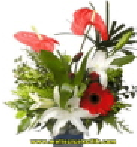
Şekil 23: Asimetrik ve simetrik çiçek düzenlemesi