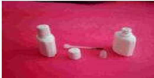
Resim 1.2: Nerden aldığınıza dikkat edin

İşlenmemiş tarım ürünleri ve av hayvanları açıkça ürün tanımının dışında bırakılmıştır. İşlenmemiş tarım ürünleri ifadesiyle, ilk elden özel bir işleme tabi tutulmuş ürünlerin dışında kalan toprak, çiftlik, ya da balıkçılık ürünleri anlatılmaktadır. Bununla beraber üye devletlerin bu iç hukuklarında bir sorumluluk getirmesi, o devletlerin kendi takdirlerine bırakılmıştır.