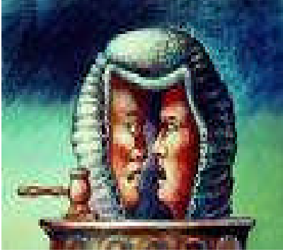
Resim 2.3: Sorumluluk sigortası üretici tüketicisi anlaşmazlığını ortadan kaldırır

Ürün sorumluluğu sigortası, zarar (tazminat)-meblağ (tutar) sigortaları ayrımında ilk grup içinde yer alır. Bir zarar sigortasıdır. Çünkü bu tür sigortada, sigortacı, sigorta ettirenin (üreticinin) üçüncü bir şahsa verdiği zarar için, zarar gören şahsın tazminat talebine karşı sigorta himayesi sağlamakta; yani sözü geçen tazminat talebi sonucu olarak sigorta ettirenin mal varlığında ortaya çıkabilecek borçları sigortacı üzerine almaktadır. İşte, bir kimsenin tamamen iradesi dışında malvarlığında meydana gelen eksilme bir zarar teşkil ettiğinden ve sigortacı da bu zararı karşılayacağından, ürün sorumluluğu sigortası bir zarar sigortasıdır.