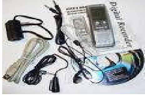
Resim 1.6: Teknoloji sorunları ortaya çıkarır

Bilim ve tekniğin en son gereklerine ve durumuna göre geliştirilmiş, denenmiş ve böylece üretilmiş bir ürünün piyasaya sürüldüğü anda kimse tarafından bilinmeyen bazı tehlikeler ve zararlı sonuçlar doğurduğu, sonradan bilim ve tekniğin gelişimi sonucu ortaya çıkabilir. Örneğin, usulüne uygun biçimde test ve denemeleri yapılan ve piyasaya sürüldüğü sırada tıp ve farmakoloji bilimlerinin verilerine göre zararlı etkileri olmadığı anlaşılan bir ilacın, bilimin gelişmesi sonucunda, bazı sağlığa zararlı etkilerinin saptanması gibi. Bu görünümün tipik örnekleri olarak, sigaranın kansere neden olduğunun anlaşılması, sakarinin (suni tatlandırıcı) sağlığa zararlı etkilerine ilişkin tartışmalar ve aynı şekilde penisilin'in yan etkilerinin saptanmasını gösterebiliriz.