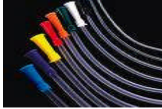
Resim 2.5: Tercihinizi doğru yapın

Sorumluluk sigortalarında rizikodan bahsedebilmek için her şeyden önce sigorta ettirenin malvarlığında bir kötüleşmenin meydana gelmesi veya en azından böyle bir kötüleşme olasılığının ortaya çıkmış bulunması zorunludur. Zarar sigortası niteliğinde oldukları için sorumluluk sigortalarında da sigortacı ancak sigorta ettirenin malvarlığı bir kötüleşmeye (veya kötüleşme tehdidine) maruz kaldığı takdirde koruma edimini (dinamik olarak) yerine getirecektir