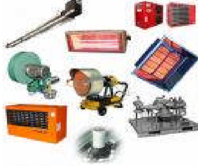
Resim 1.1: Kullandığımız ürünler güvenlimi

Bununla beraber, günümüzde üreticinin sorumluluğu bakımından ürün kavramının giderek genişletilmesi yönünde bir eğilim hakimdir. Örneğin, çeşitli yabancı hukuklarda taşınır ürünler bakımından endüstri ürünleri ile doğal ürünler arasındaki ayrım giderek ortadan kalkmaktadır. Kural olarak maddesel varlığı bulunan her taşınır (yiyecek maddeleri, ilaçlar, kozmetikler, vb.) ürün sayılmaktadır. Hatta Amerika'daki uygulamalarda ürün kavramı taşınmazları ve hizmetleri de içerecek biçimde geniş bir yoruma tabi tutulmaktadır.