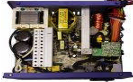
Resim 1. 4: Hatalı üretime dikkat

Seri üretimde belirli bir seri içinden tek bir ürünün, üretim sürecine katılan bir işçinin kusuru ya da bir makine arızası gibi sebepler yüzünden kusurlu (bozuk) olarak üretilmesi sonucunda meydana gelir. Buna göre bir fabrikasyon bozukluğu ürünün fikir olarak geliştirilmesi aşamasında değil, sadece üretim faaliyeti sırasında oluşabilir. Eğer ürün mevcut plan ve projelere uygun ve doğru teknikler kullanılarak üretilmiş ise bu tür bir üretim bozukluğu söz konusu olmaz. Fabrikasyon bozukluğuna örnek olarak, belirli bir otomobil serisi içinden sadece birinin direksiyon sisteminin arızalı olmasını gösterebiliriz.