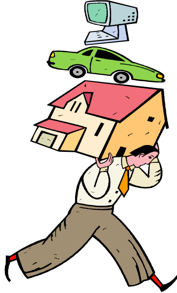
Resim 2.6: Yükünüzü biraz hafifletmeye karar verdik

Sigortalı, çoğu zaman, her türlü rizikoları için en uygun ve bütün dünyayı kapsayacak bir teminat istemektedir. Diğer yandan ise, tarafların arzularına ve sigortalının spekülasyon düşüncelerine bağlı olmayan rizikolar için teminat verilebilir. Nitekim rizikoların sigortalanabilir ve sigortalanamaz kısımlarının ilk dea bu prensiple ayrımı yapılmıştır.