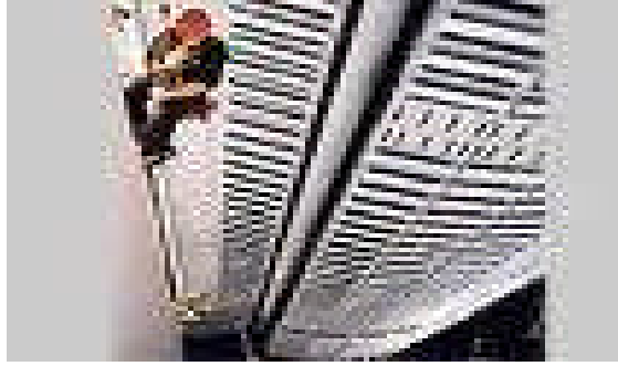
Resim 2.1: Sorumluluğunuz artıyor paylaşmaya ne dersiniz?

Nitekim sorumluluk sigortaları hakkındaki bu olumlu gelişmenin üreticinin sorumluluğuna yansımaları pek uzun sürmemiş ve çok geçmeden üreticinin sorumluluğunun sigortalanması düşüncesi, sorumluluğun niteliğinin giderek değişmesi karşısında bir fikir olmaktan çıkmıştır. Gerçekten de, tehlike sorumluluğunun kabul edilmesinin ardından, imalatçının, ürünün ayıplı olmasının beraberinde getireceği zararları tek başına karşılayabilmesi çoğu kez mümkün değildir. Öyleyse, bu durumda sigorta müessesesinden yararlanmak bir ihtiyaç haline almıştır. İşte, bu ihtiyacı karşılamak üzere ürün sorumluluğu sigortası (Product Liability Insurance) olarak adlandırılan bir sigorta türü geliştirilmiş ve uygulamaya konulmuş bulunmaktadır.