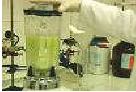
Resim 1.7: Sorumluluğunuzu paylaşıyoruz

Modern endüstri koşullarında üretici sıfatının belirli bir kişi veya teşebbüs üzerinde bırakılması bir hayli güçlük arz etmekte ve tüketiciler açısından sorumlu kişinin belirlenmesini zorlaştırmaktadır. Ancak üreticinin sorumluluğu bakımından kusursuz sorumluluk prensibinin kabul edilmesiyle birlikte son yıllarda üretici kavramının giderek genişletilmesi yönündeki eğilim karşısında, doktrinde artık, bozuk ürünlerin sebep olduğu zararları tazmin ile yükümlü kişi veya teşebbüslerin, ürünle herhangi bir şekilde temas haline gelenler olduğu görüşü ileri sürülmektedir. Bu görüş doğrultusunda imalat alanında sorumlu tutulabilecek kişiler grubuna ürünü imal eden kişi veya teşebbüslerin yanında, tamamlayıcı parça yapımcıları ve diğer bazı kişi veya teşebbüsler de girer.