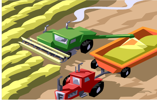
Resim 2.4: Sigorta yaptırmayı unutmayın

Ürün sorumluluğu sigortası ülkemizde yeni yeni uygulanmaya ve yaygınlaşmaya başlayan bir sigorta türüdür. Nitekim bu konuya mevzuatımızda yer verilmediği gibi henüz genel şartlar da çıkarılmamıştır. Bununla beraber uygulamada, sigorta şirketlerinin bir çoğu üçüncü şahıslara karşı mali sorumluluk sigortası poliçelerine ek olarak bu teminatı vermektedirler. Kanuni bir zorunluluk olmadığından, genel bir sorumluluk sigortası yaptırmak isteyen üretici, ayrıca bu teminatı alıp almamakta serbesttir. Dolayısıyla, sigortacılık uygulamamız açısından ÜSS İsteğe bağlı (ihtiyari) bir sorumluluk sigortası türüdür.