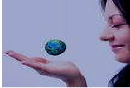
Resim 1.3: Sorumluluk Sigortası ile dünyayı rahat kullanın

Bir ürünün sırf tehlikeli olması onun kusurlu sayılması için yeterli değildir. Hukuken önem arz eden tehlike, bir malın ticari görüşlere göre kendisinde bulunması gerekli vasıflara hiç sahip olmaması veya sonradan bu vasıfları kaybetmesidir. O halde bir ürün ancak ticari muamelelerdeki hakim görüşe göre istenilen şekilde imal edilmemiş ise ve bu nedenle; istenilen şekilde imal edilen benzer ürünlere kıyasla daha tehlikeli ise, o üründe bir bozukluk (kusur) söz konusudur.