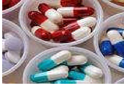
Resim 1.5: Reçeteyi okudunuzmu

Bazı durumlarda ürünün fabrikasyon ve yapım safhalarında herhangi bir bozukluk söz konusu olmadığı ve modern teknolojiye uygun olarak üretildiđi halde, ürünün kullanımı hususunda tüketicilere yeterince bilgi verilmemiş olması onları çeşitli tehlikelerle karşı karşıya bırakabilmektedir. Özellikle ilaç ve makine sanayinde meydana gelen hasarların bir çođu bu sebebe dayanmaktadır.