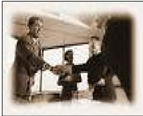
Resim 2.4: Güvende olduğunuzu hissedin.