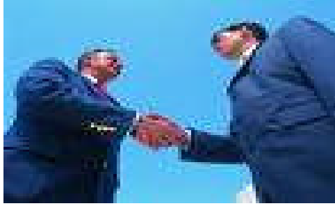
Resim 1.5: Sorumluluk karşılıklı güvenle başlar.

Primin taksitle ödenmesi kararlaştırıldığı takdirde, taksitlerin kesin ödeme zamanı, miktarı ve vadesinde ödenmemesinin sonuçları poliçe üzerine yazılır veya poliçe ile birlikte yazılı olarak sigorta ettirene bildirilir.