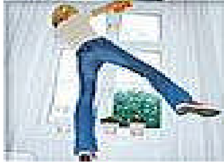
Resim 1.3: Kaza sizin içinde, başkası içinde geliyorum demez