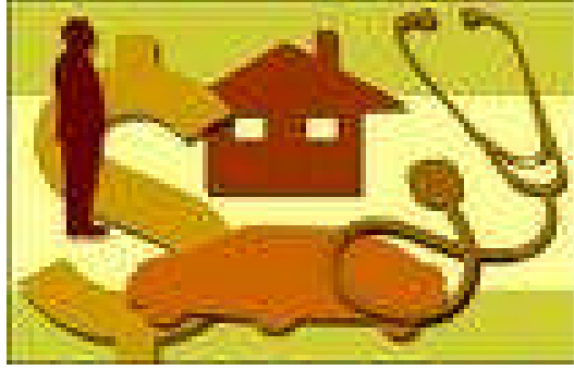
Resim 1.2:Kendinizi başkasının yerine koyun.

İşbu poliçe, sigortalıyı haklı taleplere karşı olduğu gibi yersiz ve aşırı taleplere karşı da korur.