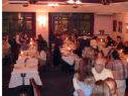
Resim 9: Bu ortamda bulunduğunuz sürece güvendesiniz.

Lokanta sorumluluk sigortası yaptıran bir lokantada, yangın, duman, infilak nedeniyle lokantada bulunan müşterilerin maruz kalabilecekleri bedeni zararlar, imalatı lokantada yapılan yiyecekler ve içecekler nedeniyle meydana gelebilecek gıda zehirlenmesinden (Alkol zehirlenmeleri hariç) kaynaklanacak bedeni zararlar ve işletme faaliyetlerinden dolayı lokanta sahibi ve/veya işleticisine üçüncü kişiler tarafından yöneltilebilecek yasal sorumluluklar poliçede yazılı teminat limitlerine kadar karşılanır.