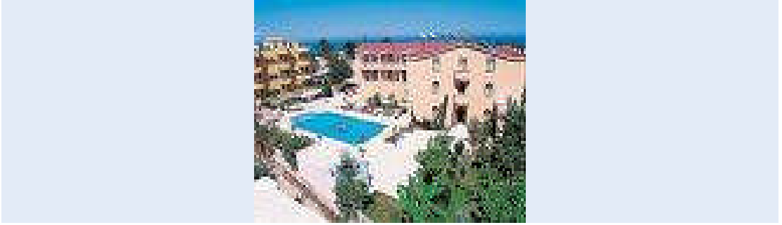
Resim 2.5: Güvenli tatil yapmaya ne dersiniz?

Aşağıda otel, motel, pansiyon sorumluluk sigortalarına ilişkin örnek bir tarife hazırlanmıştır.