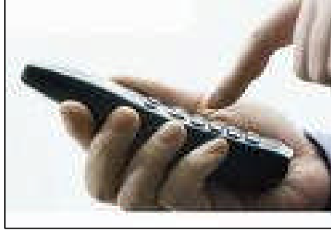
Resim 1.4: Değişiklikleri zamanında bildirin.

Değişiklikler rizikoyu ağırlaştırıcı mahiyette ise, sigortacı dilerse: