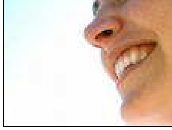
Resim 1.6: Bırakın sorumluluklarınızı üstlenelim.

Sigortacı, zarar ve ziyan talebinde bulunan üçüncü şahısla doğrudan doğruya temasa geçerek anlaşma hakkını sahiptir.