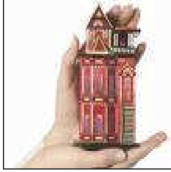
Resim 2.1: Sorumluluklarımızı devredin.