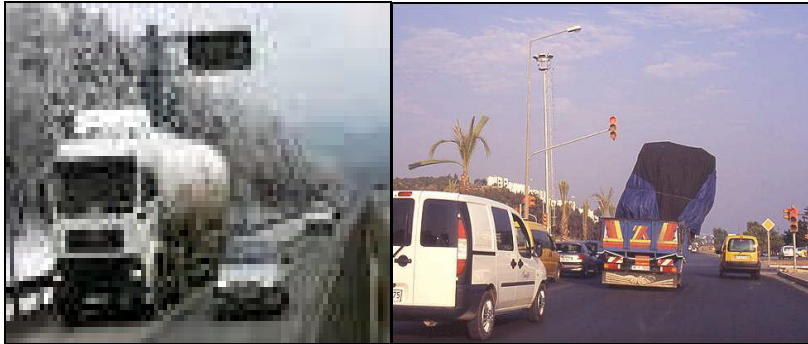
Resim 2.2: Tehlikeli olduğunuzu unutmayın.