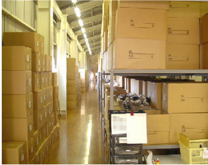
Şekil 4.3: Ürünlerin depolanması

Mağaza içinde en değerli yer ön kısımdır. Arka taraflara doğru gidildikçe yerin sergileme değeride azalır. Çok katlı mağazalarda ise üst katların değeri alt katlara göre daha azdır. Çok kullanılan ürünler daha fazla satın alınacağı için müşterinin kolaylıkla ulaşabileceği alanlarda yerleştirilir. Birbirleriyle ilgili ürünlerin yan yana reyonlara yerleştirilmesi de satışların artmasında etkili olacaktır.