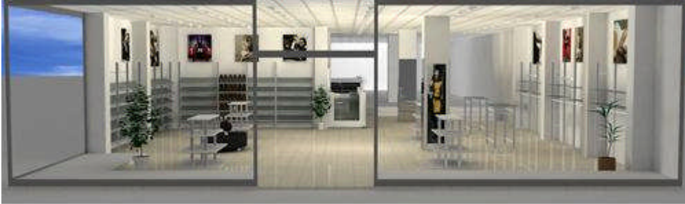
Şekil 4.1Mağaza içi düzenleme çalışması

İyi planlanmış bir mağaza ürün ve müşteri akışına hız kazandırır. Bu hareketlilik satıcı açısından avantajlıdır. Mağaza içi düzenleme yapılırken ürünle müşterinin mağaza içinde en kolay ve çabuk şekilde karşılaşması ve ürünün müşteri akışına göre yerleştirilmesi esas alınır.