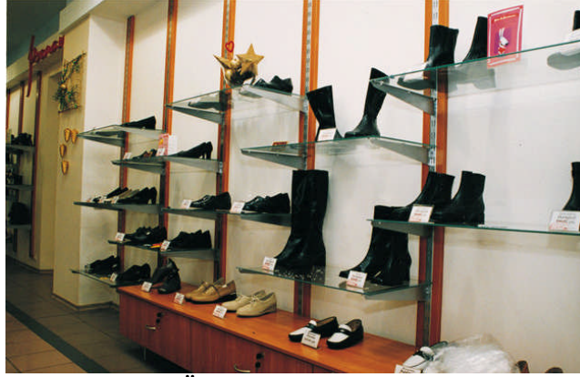
Şekil 4.2: Ürünlerin reyonaya yerleştirilmesi

Reyon içi yerleştirme, ürünleri reyonaya dizmedir. Ürünler reyonaya yerleştirilirken çeşitli etkenler (ürünün büyüklüğü, şekli, fiyatı, rengi gibi ) göz önüne alınır. Perakendeci mağazaların serileme alanlarının fiyatları ile bu alanlarda sergilenen ürünlerin sağlayacağı kâr oranı birbiriyle ilişkilidir. Çünkü;