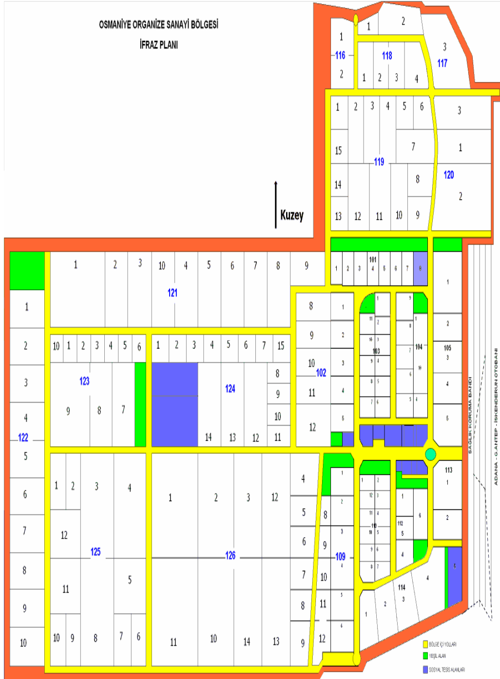
Şekil 3.2: İfraz planı örneği