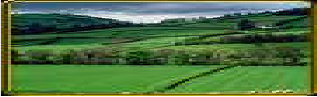
Resim:1.6.Tarım arazileri tarım amaçlıdır.

Tarım arazileri cinslerine göre dört bölümde incelenir.