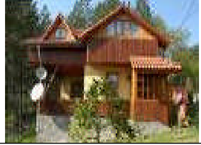
Resim1.3.Ahşap yapılar estetikdir.