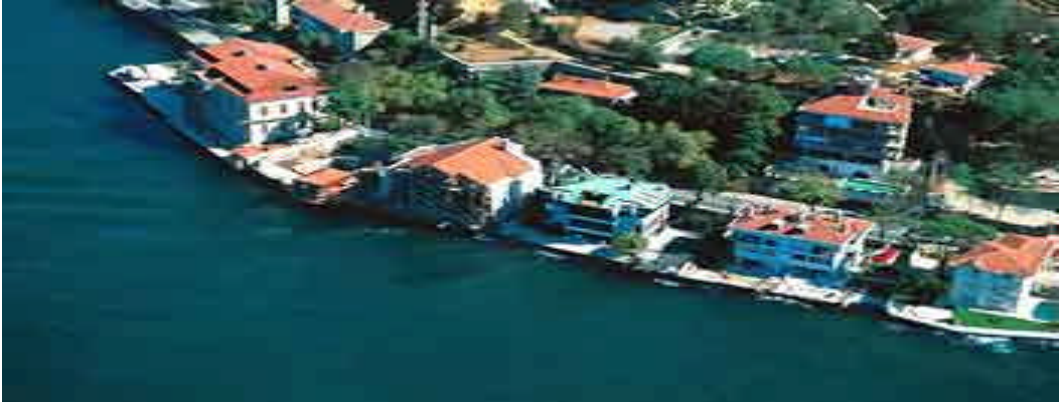
Resim:2.5.Boğaziçi'nde yapılaşma imar iznine bağlıdır.

Boğaziçi Kanununun İlgili maddesine göre kurulan organların görevine son verilmiştir. Bu kuruluşların görev ve sorumlulukları aşağıda belirtilen çerçevede dahilinde İstanbul Büyük Şehir ve ilgili İlçe Belediye Başkanlıklarınca yürütülmesi kararı verilmiştir.