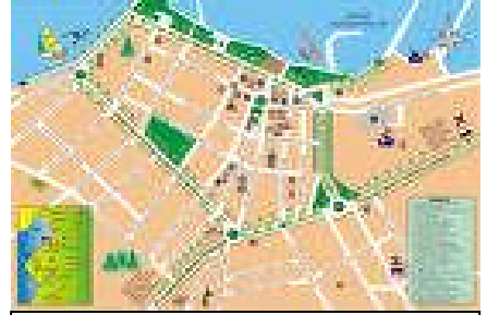
Resim:2.2.Şehir Yerleşim Haritası

Kanunu ve Büyük Şehir Belediyelerinin Yönetimi Hakkında Kanun ile diğer özel kanunlar ile belirlenen veya belirlenecek olan yerlerde, İmar Kanunun özel kanunlara aykırı olmayan hükümleri uygulanacağı hüküm altına alınmıştır.