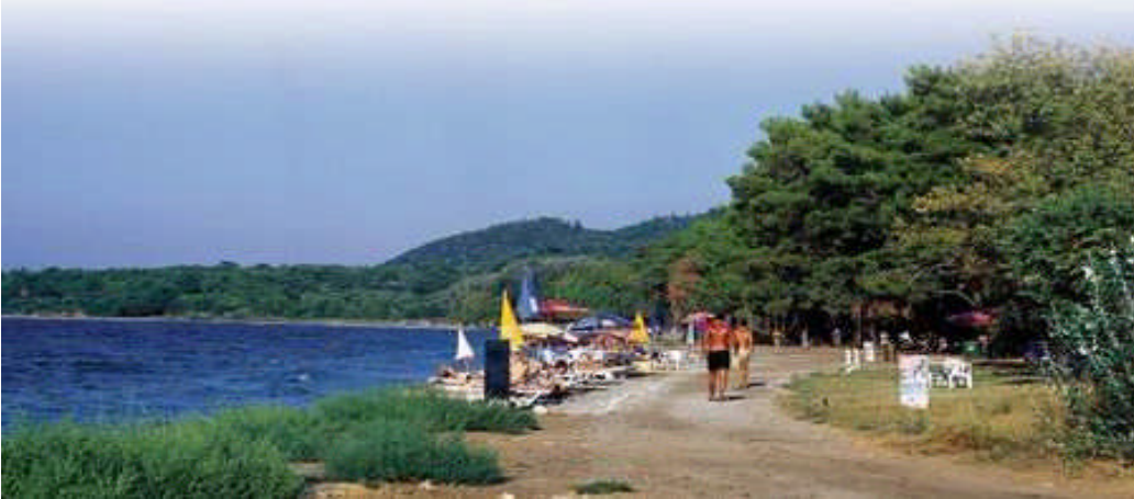
Resim:2.12.Plajlar günübirlik alanlardır.

Konaklama Tesisleri: Bu alanlar otel, motel, apart otel (bir turizm tesisine bağımlı olmak koşuluyla), tatil köyü, kamping gibi yataklı tesisler ile bunların lokanta, kafeterya, bar, diskotek gibi yan birimlerinin yer aldığı alanlardır.