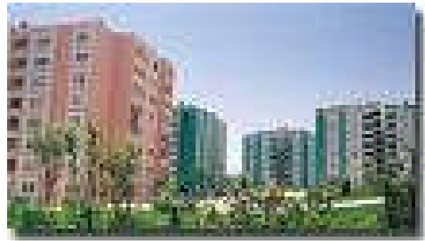
Resim 3.1.: Binalar vergiye tabidir

Ülke sınırları içinde yer alan bina, arazi ve arsaları vergilendirmektedir. Emlak vergisi, genellikle yerel yönetim kuruluşları tarafından tarh ve tahsil edilir. Ülkemizde 1972 yılına kadar İl Özel İdareleri, 1972–1986 yılları arasında merkezi yönetim tarafından tahsil edilen emlak vergisi, 1986 yılından beri belediyelerce tahsil edilmektedir. Bu açıklamaya göre, Emlak Vergisinin, yerel yönetim kuruluşlarının finansal ihtiyacını karşılamak üzere uygulandığını söylemek yanlış değildir. Kişilerin bina ve arazileri nedeniyle, kamu hizmetlerinden gördükleri faydalar karşılığında emlak vergisini ödemeleri, haklı bir gerekçeyle dayanmaktadır.