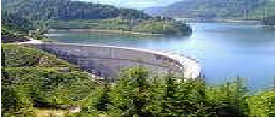
Resim:2.6. Baraj havzası koruma altındadır.