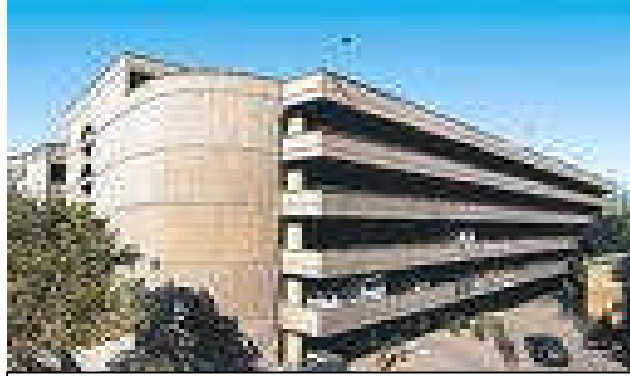
Resim:2.4.Otoparklar Yol işgalini önler.

Bekçi, bahçıvan, kaloriferçi gibi müstahdemin ikametini yer ayrılması halinde bu yerlerde de aynı şartlar aranır. İmar kanunundaki hükümler bu maddede sözü geçen daireler hakkında da uygulanır. Nerelerde ve hangi binalarda kapıcı dairesi ve sığınak ayrılması gerektiği imar yönetmeliklerinde gösterilir. İmar planlarının tanziminde planlanan beldenin ve bölgenin şartları ile gelecekteki ihtiyaçlar göz önünde tutularak lüzumlu gerekli otopark yerleri ayrılır.