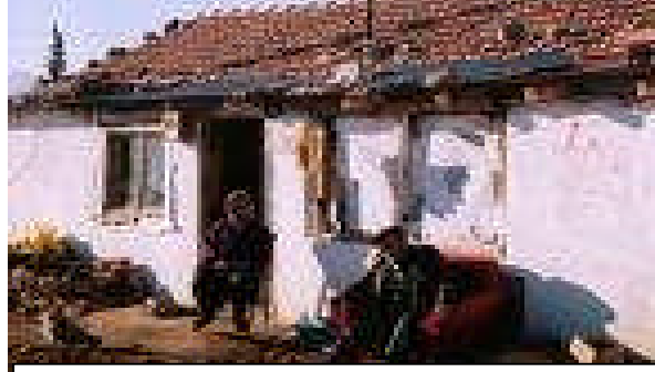
Resim:2.10.Gecekondular imara aykırıdır

İmar planlarında konut yapımı için ayrılan meskun konut alanları ve kentin gelişmesi için ayrılan gelişme konut alanlarıyla, gecekondü önleme bölgeleri, toplu konut alanları gibi konut alanlarından oluşan iskan alanlarıdır. Bunlar da ;