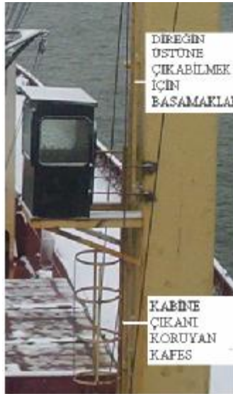
Resim 5: Direk çıkış basamakları

Gemilerde direklere, kreynlere ve kasaralara 37 yükseğe çıkabilmek için vardevela ve basamaklar konur. (Resim-5) Bu vardevela ve basamaklara tutunarak ve basarak yükseğe tırmanılır. Ancak bunların bakımı zor ve ince olduklarından kolayca yıpranıp kırılabilirler. Üstelik boya nedeni ile gözükmediklerinden tehlike yaratırlar. Bu neden ile vardevelalar zaman zaman kontrol edilmelidir.