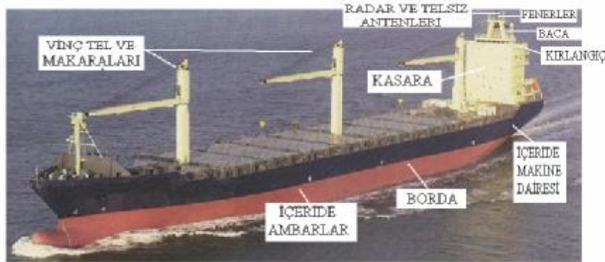
Resim 3:-Yüksekte çalışma yapılan yerler

Yüksekte çalışma; düşme halinde bir yaralanma, sakatlanma veya ölüme sebep olabilecek derecede güverteden yüksek yerlerdeki çalışmalardır. Gemilerin dış tarafında yani bir düşme halinde denize veya bağlanılan yerlere düşülebilecek yerlerdeki çalışmalarda yüksekte çalışma olarak değerlendirilir.