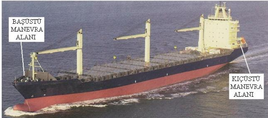
Resim 1:-Başüstü ve kıçüstü manevra yerleri

Geminin bağlanması; bir geminin bekleme veya bir işlem için rıhtım, iskele, platform veya güvenli bir başka yere halatlar yardımı ile bağlanmasıdır. Bu bağlanma, bordadan veya kıçtan kara şeklinde olabilir.