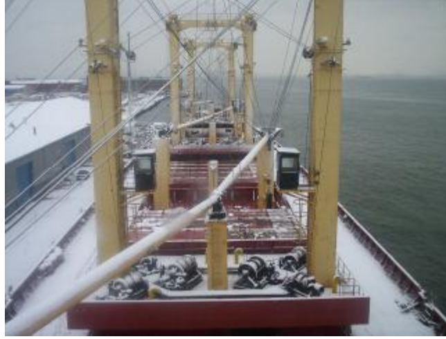
Resim 2- Kar ile kayganlaşmış güverte

Ve tüm bunlar güverteyi kayganlaştırıp üzerinde dolaşan insanların düşmesine, yaralanmasına, sakatlanmasına ve hatta ölmesine sebep olabilir. Hele gemi sacdan 33 yapılmışsa ki bugün gemilerin hemen hemen tamamına yakını sacdan yapılmıştır, bunlarda düşülecek sac zemin riski daha da yükseltmektedir.