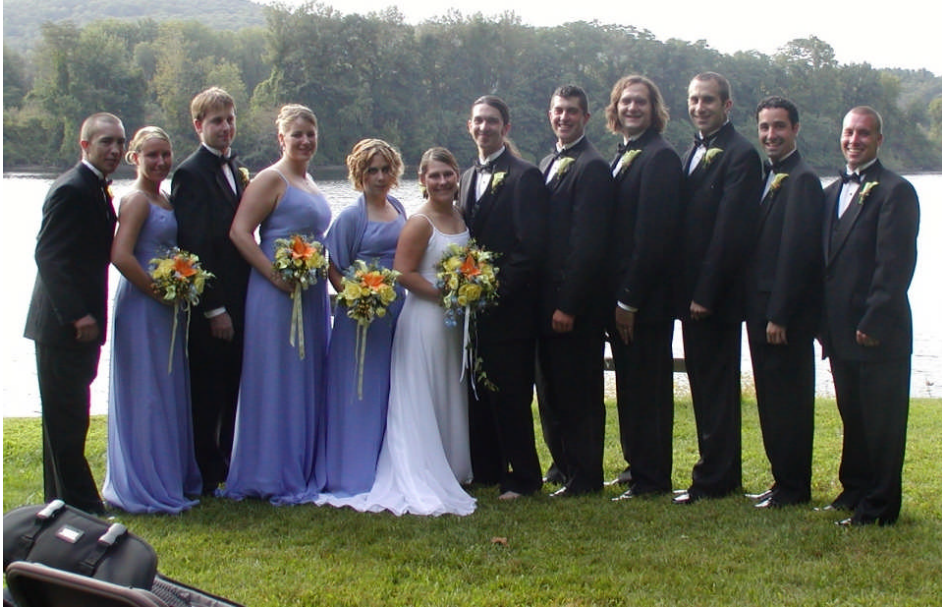
Resim 1: Evlenme merasimi, evlenecek kişilerin resmî memur ve şahitler önünde evlenme iradelerini açıklamalarıdır