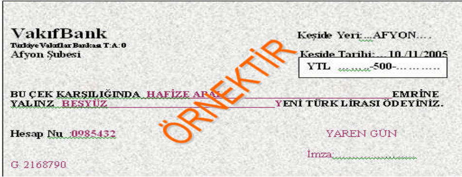
Şekil 1: Bono örneği

Ticari hayatta en çok kullanılan senet türü bonodur. Ülkemizde genellikle, kırtasiyelerde satılan basılmış boş senet kâğıdındaki boşluklar doldurulup imzalanarak bono düzenlenir.