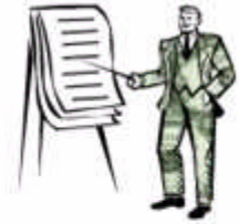
Resim1.3: Yazı levhası örnekleri