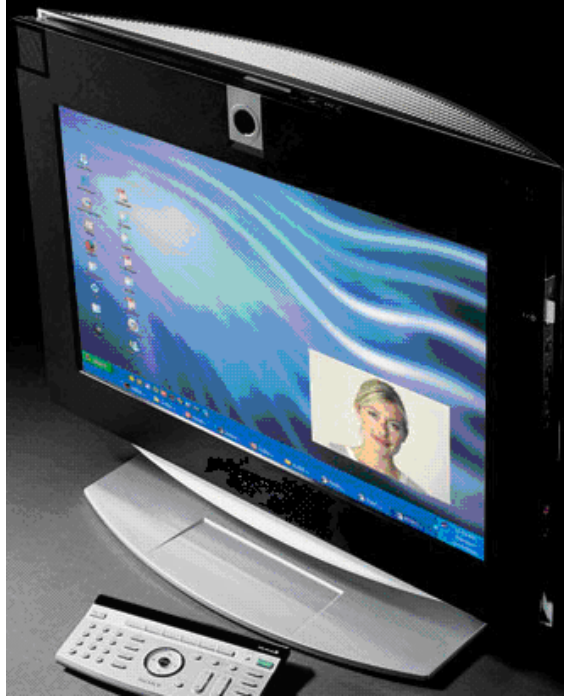
Resim 15: Videokonferans

Telekonferans, farklı yerlerdeki bireylerin, karşılıklı etkileşim amacıyla telekominükasyon sistemlerinden yararlanmasıdır. Bir telekonferansın düzenlenmesi, toplantı masasının ortasındaki bir telefona bir mikrofon bağlamak kadar basittir. Bu tip sunuşlar üretkenliğe zarar vermez, çünkü katılanlar sunuş biter bitmez işlerine dönebilir, zamanlarını ve parayı seyahat için harcamazlar.