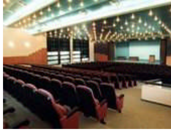
Resim 1.6 : Bir konferans salonu görünümü

Küçük ve orta büyüklükteki mekanlarda dikkat edilmesi gereken ayrıntılara ek olarak büyük mekanlarda da şunları gözden geçirmek gerekir;