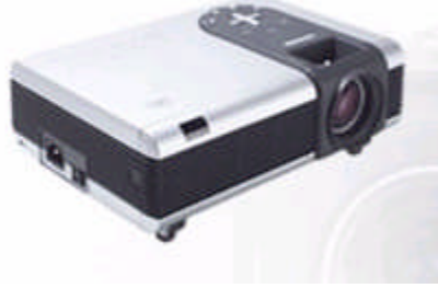
Resim 1. 1: Projeksiyon makinesi

Projeksiyonlar ya da saydam gstericiler ucuz, kullanımı kolay, gvenilir ve zel uygulamalara ve kořullara uyumlu olduklarından dolayı sıka kullanılır. Bunlar hem kk, hem de orta byklkteki dinleyici grupları iin elveriřlidir. zel bir aydınlatmaya gerek yoktur.