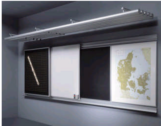
Resim 1.2: Yazı tahtası örneği