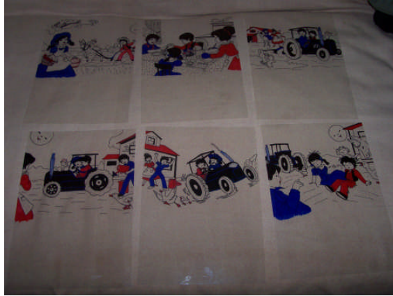
Resim 2.2: Tepegöz kartları

Slâyt kartı hazırlamada olduğu gibi bu teknikte de resimler büyütülerek ekrana yansıtıldığından resimleri çalışırken temiz ve özenle çalışmak gerekir. Slayt tekniğinde olduğu gibi tepegözde de resimleri izleyebilmek için düz beyaz duvara ya da geniş beyaz perdeye ihtiyaç vardır. Loş ortam yeterlidir. Karanlık ortamdaki çocuklar korkabilir. Tepegöz ve kullanılan araçlar teknolojik olduğu kadar da pahalıdır.