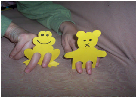
Resim 2.2: İki parmaklı kuklalar

İki parmaklı kukla: İki parmak takılarak kullanılan kukla yapmak için, karakter belirlendikten sonra kartona çizilir ve karton kesilir. Karton renkli boya kalemleri ile boyanır. Artık materyallerle ve renkli kâğıtlarla süslemeler yapılır. Kuklanın vücudunun alt kısımlarına iki parmak girecek şekilde yuvarlak delikler açılır. Yapılan kuklayı oynatmak için işaret ve orta parmaklar yuvarlak deliklerden geçirilir. Kukla dik durur ve oynatılacak konuma gelmiş olur.