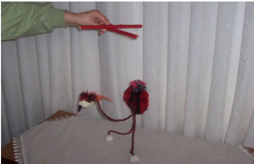
Resim 2.2: Kontrol çubuklu ipli kukla

Hazırlanan ipler, çapraz (X) veya artı (+) şeklinde kuklanın başından 30 cm yükseklikten tahtadan çakılan kontrol çubuğuna bağlanır. İpleri kontrol çubuğuna bağlarken en merkeze (kontrol çubuğunun ortasına) kuklanın başından gelen misina, kontrol çubuğunun ön tarafına ayak ve bacaklardan gelen misinalar, kontrol çubuğunun sağ ve soluna kollardan gelen misinalar, kontrol çubuğunun arkasına ise kuklanın sırtından gelen misina bağlanır. Misinalar bağlanırken birbirine karıştırılmamalıdır. Bütün misinalar bağlandıktan sonra kontrol çubuğu tutulur. Kuklanın hiç hareket ettirilmeden ayakta rahatça durup durmadığına bakılır. İpli kukla oynatılırken bir elle kontrol çubuğu tutulur. Diğer elle hareketi sağlamak için misinalar sırasıyla ya da ikili olarak çekilir. İpli kukla oynatmak deneyim gerektirir. Hikâyeyi başka bir kişi anlatabilir. Teypten hikâyeye de dinletilebilir. Deneyim arttıkça hem kukla oynatılır hem de hikâyeye anlatılabilir.