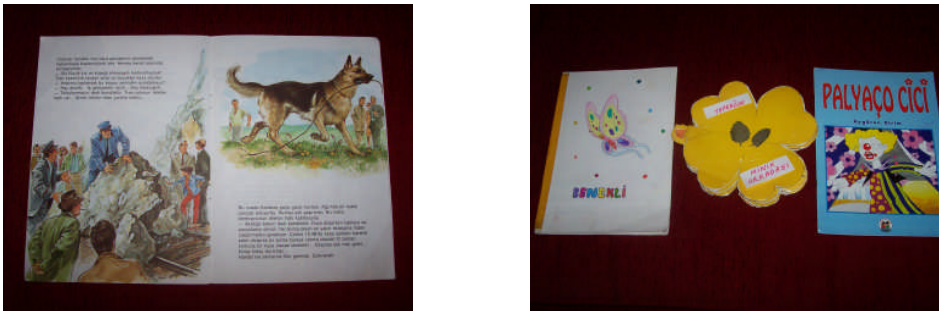
Resim 2.2 : Hikâye kitaplarının fiziki özellikleri

Kütüphanede sırt yazısına göre kitap seçilir. Çocuk kitapları kütüphaneye ön kapak görülecek şekilde yerleştirilir, nedeni ise resimlerin ilgi çekmesi ve çocukların okuma-yazmayı bilmemeleridir. Kapakta ayrıca kitabın adı, yayın evinin adı var ise amblemi, seri ise seri numarası yer alır. İç sayfa özelliğinde ise ciltli kitaplarda ilk sayfa boştur. Buna iç kapak denir. Burada kitabın adı, resim, yazarın adı, resimleyen, yayınevinin adı, adresi yer alır. Sonra diğer sayfalar gelir.