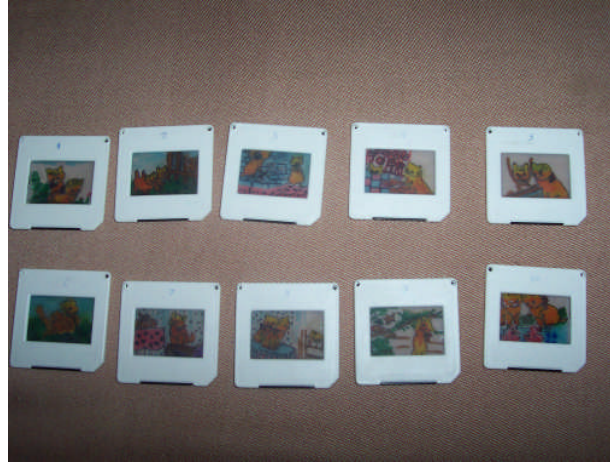
Resim 2.2: Slayt kartları