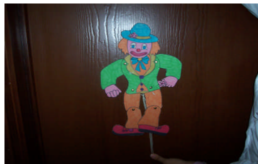
Resim 2.2: İpli kukla