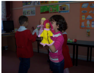
Resim 1.1: Türkçe dil etkinlikleri

Özel eğitimde, çocuğun dikkatinin gelişmesinde Türkçe dil etkinliklerinin önemi büyüktür. Dikkatin belli bir nesneye, davranışa ve etkinliğe yoğunlaştırılması ile öğrenme arasında yakın bir ilişki vardır. Çocuk bu etkinliklerde aktif olarak dinleme – katılma becerisi geliştirir. Bu durum dikkat süresinin gelişimi için oldukça önemlidir. Çocuğun dikkat süresi yaşla birlikte gelişim gösterirken Türkçe dil etkinliklerinin de katkısı büyüktür. Özel eğitimde Türkçe dil etkinliklerinin, okuma –yazma öncesi etkinliklerinde de rolü vardır. El –göz koordinasyonu, görsel-işitsel hafızanın gelişmesi, benzerlik ve farklılıkları ayırt edebilmesi, görsel olgunluğun gelişmesi gibi okuma-yazma öncesinde gerekli olan becerilerin gelişmesinde rol oynar. Erken yaşlarda kitapla tanışan çocuklarda kitap sevgisi aşılanır ve gelişir. Özel eğitimde Türkçe dil etkinlikleri, öğretmen rehberliğinde yapılan grup etkinlikleridir. Belirtilen etkinlikler yapılırken her teknik, çocukların gelişim özelliklerini destekleyecek şekilde kullanılmalıdır. Özel eğitimde de Türkçe dil etkinliklerinin çocuğun gelişiminde çok önemli bir yeri olduğu görülmektedir.