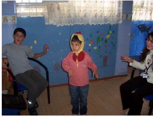
Resim 2.3 : Dramatizasyon

Özürlü bireylerin başkalarına bağımlı yaşamalarını ortadan kaldırmayı ya da en aza indirmeyi sağlayan; kendilerinin bağımsız olarak toplumda ayakta durmalarını öğreten etkinlik olması nedeniyle özür grubunun her alanında rahatlıkla kullanılır. Zihinsel engelli çocuklarda dramatizasyonun adaptasyonu gerekir. Çünkü yapılacak hareketlerin önce öğrenilmesi gerekir (koşma, yuvarlanma tutma, yakalama vb.). Zihinsel engellilerde adaptasyondan sonra dramatizasyon, seviyelerine göre rahatlıkla kullanılabilir.