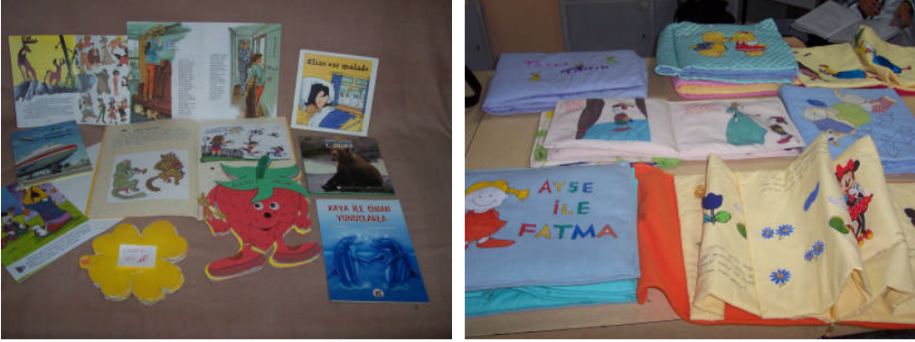
Resim 2 . 2: Değişik tekniklerde hazırlanan hikâye kitapları

Sesli kitaplar için teyp kaset ve CD kullanılır. Hikâye kitabının yanında hikâye metni CD veya kasete kayıt yapılır. Kayıt işlemi özel kayıt odalarında yapılırsa, ses düzeni iyi olur. Kulağı rahatsız etmez.