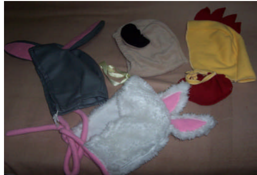
Resim 2.3: Kostüm ve aksesuarlar