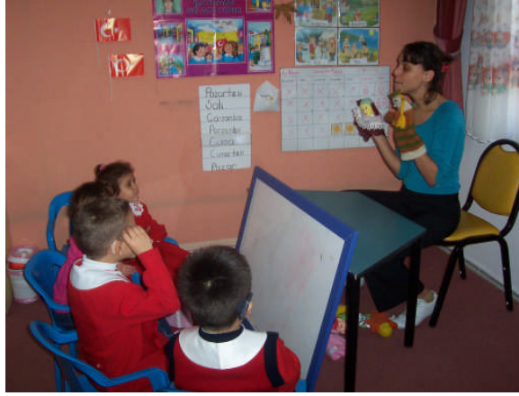
Resim 2.2: Kuklalar ile hikâye anlatma