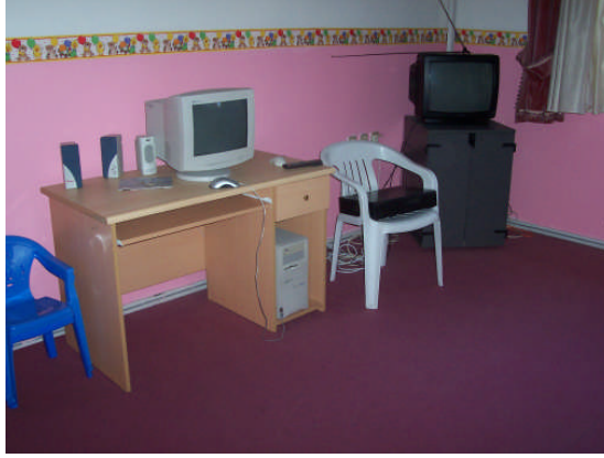
Resim 2.2: Televizyon ve bilgisayar ile hikâye anlatma