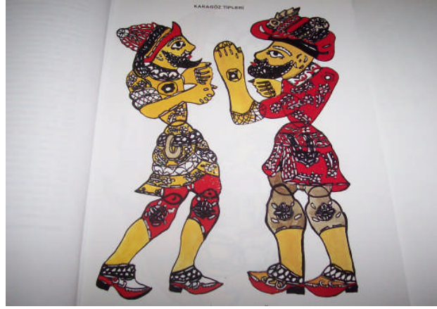
Resim 2.2: Gölge kuklası

Hazırlanan kuklaları oynatmak için ortalama 70 x 100 cm ebadında dikdörtgen çerçeve yapılır. Bu çerçeveye parşömen kâğıdı ya da ince beyaz patiska gerilerek kaplanır. Çerçevenin ayakta durabilmesi için iki ayak yapılır. Perdenin arka tarafı ışıklandırılır. Arkadan ışıklandırma ile kukla karakterlerinin net görülmesi sağlanır. Tiyatro ya da sınıfın loş olması için ışıkları kapatılır. Sahneye gelen ışık, oyuna ilgiyi toplar. Sınıfta sahnenin arkası ışık yerine pencerenin önüne gelecek şekilde yerleştirilerek doğal aydınlatma da sağlanabilir. Bu teknik de ipli kukla gibi oldukça deneyim gerektirir. Ayrıca müzik ya da enstrüman kullanmak için bir kişiye ya da teybe ihtiyaç vardır. Deneyim arttıkça hem hikâye hem de kukla oynatılabilir.