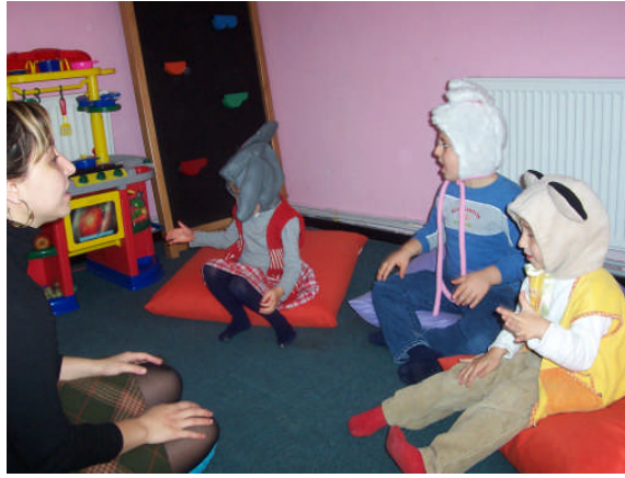
Resim 2.3: Hikâye sonrası etkinlikler

Hikâye sonrası etkinlikler, özür grubuna göre özel eğitimin tüm alanlarında rahatlatıcı ve aktif görev alma içerdiğinden, özür grubunun düzeyine uygun olarak hazırlanıp kullanılabilen, grup eğitiminde çok yararlı olan etkinliklerdir. Özellikle zekâ özürlü çocukların oyunları birçok yönden benzer zekâ yaşındaki daha küçük normal çocukların oyunlarına benzer. Daha yavaş bir gelişim seyri gösterirler. Zekâ özürlü çocukların oyun arkadaşları da kendilerinden yaşça küçüktür. Türkçe dil etkinliklerinin dramatik oyunları olan hikâye sonrası etkinlikler zekâ özürlü çocukların öğrenmelerini kolaylaştırır ve kendilerini ifade etmelerinde normal çocuklardan daha fazla yararlı olur. Dramatik etkinlikler özel eğitimin her alanında mutlaka kullanılması gereken etkinliklerdir. Hikâye sonrası etkinlikler eğitimin yanında aynı zamanda rehabilitasyon çalışmalarıdır.