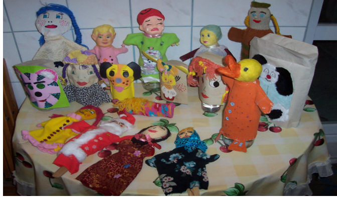
Resim 2.2: Çeşitli el kuklaları