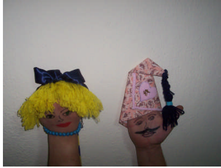
Resim 2.2: Avuç kuklası

İpli kukla (marionette): Oyuncak bebek ya da hayvan karakterlerine ait vücut parçalarının ipler yardımıyla hareketi sağlanır. İpler kontrol çubuğuna bağlanarak kuklalar hareketlendirilir. Hazırlanması düşünülen kukla karakterinin vücut parçaları eklem yerlerinden ayrı ayrı olarak hazırlanır. Eklem yerlerinin hareketini sağlayacak şekilde birbirine birleştirilir. Hareketi sağlamak için ataç raptiyeler ve hareketli zımbalar kullanılır. Boş makaralar, boş kutular, ponponlar, daire şeklinde kesilen kumaş parçaları ya da örgülerden hazırlanan yuvarlakların içlerinden ipler geçirilerek kuklalar yapılır. İnce mukavvadan kukla karakterleri çizilir, boyanır. Hazırlanan bu kukla bedenine uygun giysi giydirilerek de yapılabilir. Bu kuklalar artık materyaller ile süslenir. Hazırlanan kuklanın ayak, kol ve baş kısımlarına ince naylon ip ya da misina ile bağlanır. Misina şeffaf ve sağlam olması nedeni ile daha çok tercih edilir.