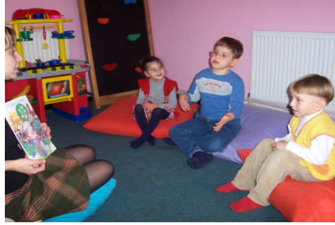
Resim 2.2: Hikâye kitabından anlatma