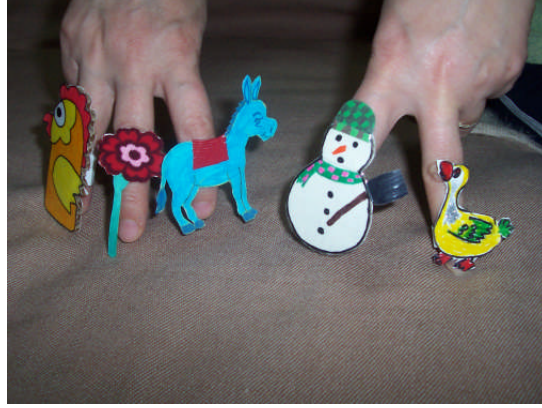
Resim 2.2: Yüzük kuklaları

Yüzük kuklası: Kartondan yüzük yapılır. Parmaklara uygun büyüklükte kukla karakteri çizilir ve boyanır. Kartondan yüzüğe yapıştırılır. Metinlere göre birkaç tane karakter hazırlanabilir. Kâğıt hamurundan da kukla yapılabilir. Yüzük kuklası tekerleme ve şarkı söylerken de kullanılabilir.