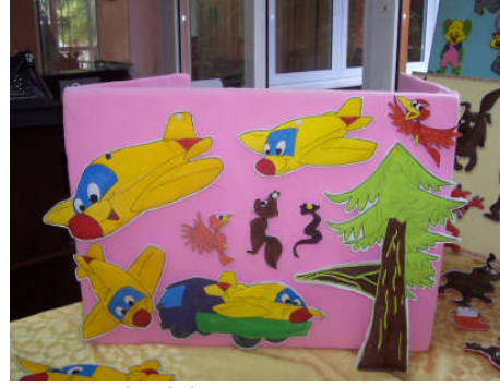
Resim 2.2: Pazen tahta kartları