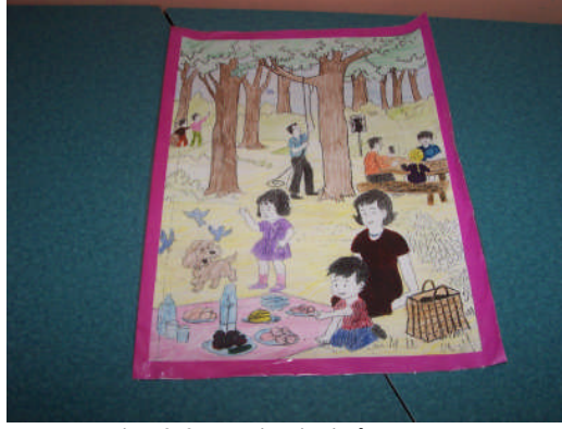
Resim 2.2: Resimli hikâye kartları