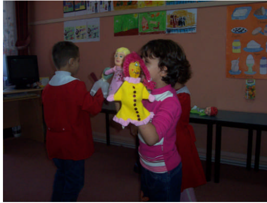
Resim 2.2: Kuklalar ile hikâye anlatma

Kuklalar ile hikâye anlatımında hikâye seçimi önemlidir. Karşılıklı konuşma içeren hikâyeler kullanılır. Burada kuklalar ile hikâye canlandırılır. Karşılıklı konuşma diyalogları içermeyen hikâyeler kukla ile hikâye anlatımında ilgi ve dikkat çekiciliği az olacağından tercih edilmemelidir. Öğretmen güncel konularda ya da çocuklara vermek istediği mesajlarda kukla karakterlerinden rahatlıkla yararlanabilir.