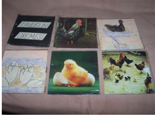
Resim 2.2: Olay sıralama kartları