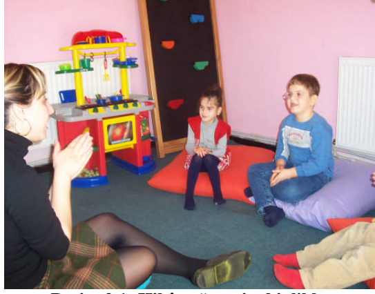
Resim 2.1 :Hikâye öncesi etkinlikler