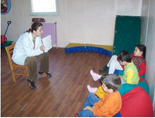
Resim 2.2: Hikâye kartları ile anlatma

Resimli olay sıralama ve hikâye kartlarıyla hikâye anlatımı görme engellilerde kullanılamazken; özel eğitimin özür grubuna göre sınıflandırılan diğer tüm alanlarında seviyelerine göre seçilen hikâyeler ve olaylar kartlarla anlatılır.