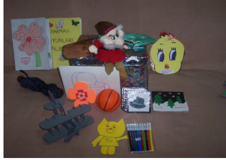
Resim 2.1: Hikâye öncesi etkinlik araçları

Özür grubuna göre tekerlemeler için kullanılacak araçlar konuşma ve zihinsel engelliler dışında diğer özür grupları için hazırlanır. Zihinsel engellilerin düzeylerine göre araç gereç hazırlanır. Konuşma engellilerin hiç konuşamayanların bölümünde tekerlemeler ve araçlarının kullanılmasına karşın konuşma bozukluklarının düzeltilmesinde kısa tekerlemeler ve araçlar kullanılabilir.