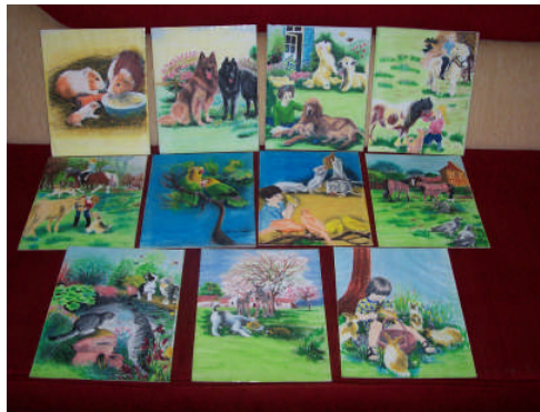
Resim 2.2: Tek resimli olay sıralama kartı

Metin, hikâye özelliklerine uygun olarak yazılır ve bölümlere ayrılır. Olay sıralamada ise resimler bütünlüğü bozmayacak şekilde bölümlere ayrılır ya da tek resim olarak hazırlanır. Hikâye kartlarında ve olay sıralamada resimlerle olay, açık ve anlaşılır şekilde anlatılmalıdır. Resimler ve kartların büyüklükleri ne çok büyük ne de çok küçük olmalıdır. Resimlerin büyüklükleri 25 x 30 cm ya da 30 x 30 cm olabilir. Kartlar kesilir, resimler kopyalanır ve boyanır. Boyandıktan sonra kartlar dik durmaları, sağlam ve dayanıklı olmaları için mukavvaya yapıştırılır. Resimlerde artık materyaller, çeşitli kâğıtlar kullanılabilir. Kartların üzeri şeffaf naylon ya da yapışkan asetat ile kaplanır. Hikâye resimli kartların ön yüzüne yazılmaz. İstenirse arkasına yazılabilir. Resimli kartlar numaralandırılır. Hikâye metni ya da olay sırası beyaz kâğıda yazılır. Metin ve kartlar büyük bir zarfın içinde saklanır.