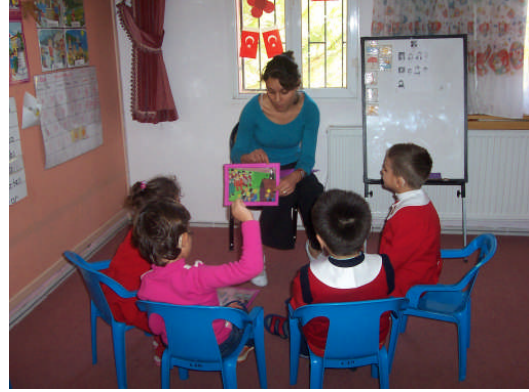
Resim 2.2: Olay sıralamasını anlatma