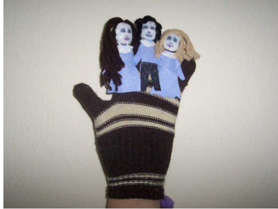
Resim 2.2: Eldiven kuklası

Eldiven kuklası: Bu tip kuklalarda eller ve parmaklar bir bütün olarak kullanılır. Eldiven kuklası yapmak için bir teki kaybolmuş eldivenler kullanılır. Eldivenin parmaklarına ayrı ayrı karakterler yapılır. Karakter özellikleri iplerle işlenir, kumaş ya da boncuk yapıştırılarak süslenir. Aile fertleri, besin grupları, hayvanlar için eldiven kuklası uygun bir çalışmadır. Koyu renkli eldivenlere açık renklerle karakterler çalışmak daha uygun olur.