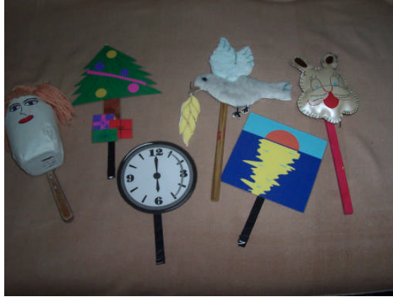
Resim 2.2: Çomak kuklaları