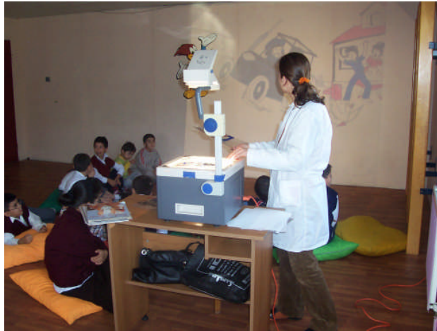
Resim 2.2:Tepegöz ile hikâyeye anlatma

Az gören engellilerde tepegöz ile hikâyeye anlatılabilir. Tepegöz tekniğinde resimlerin büyütülerek gösterilmesi az görenlerin daha iyi görmelerini sağlar. Tepegöz tekniği hiç görmeyenler dışında tüm özür gruplarında seviyelerine göre seçilen hikâyelerin anlatımında kullanılır. İşitme engellilerde slayt tekniğinde olduğu gibi anlatım şekli yapılmalıdır.