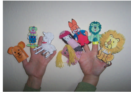
Resim 2.2: Parmak kuklaları