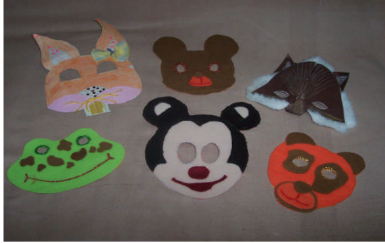
Resim 2.3: Maskeler