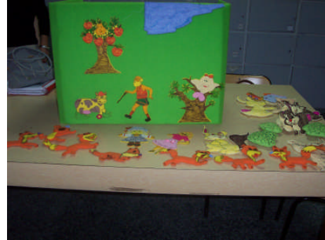
Resim 2.2 :Pazen tahta ile anlatma