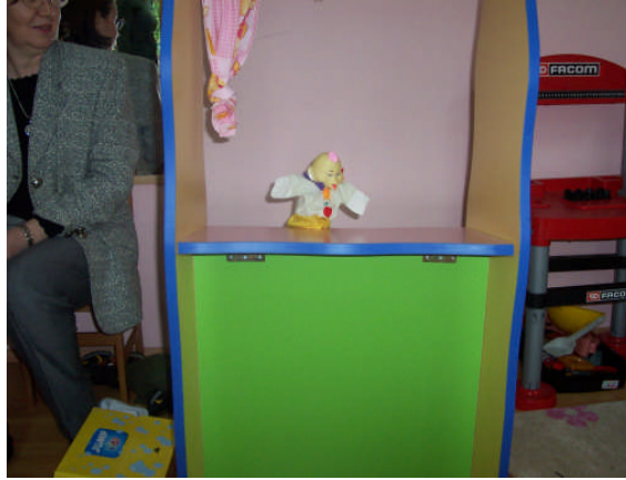
Resim 2.2: Kukla sahnesi

İşitme engellilerde kuklalar ile hikâye anlatımında kukla sahnesi kullanılmaz. İşitme engellilerin eğitiminde konuşmacının mutlaka engelliler tarafından görülmesi gerekir. Öğretmen kukla sahnesi olmadan, kuklalarla hikâyeyi anlatmalıdır. Az görenler için parmak ve yüzük kuklaları küçük olmaları nedeniyle uygulamalarda başarı sağlamayı zorlaştırır. Diğer tüm kuklalar kullanılır. Bunların dışındaki özür gruplarında, kuklalarla hikâye anlatılırken özürlü bireylerin seviyelerine göre hikâyeler seçilirse, anlatımının başarısı artar.