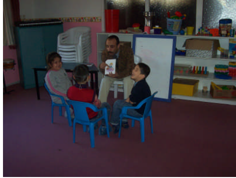
Resim 1.4: Grup etkinlikleri