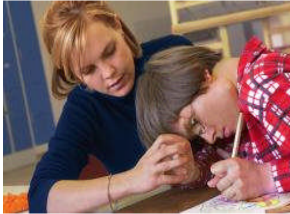
Resim 5: Oyunun değişik beceriler kazanılmasına katkısı vardır.

Çocuklar dile hakim olmaya başladıklarından itibaren dil oyunlarına özel ilgi gösterir. Şiirlerdeki tekrarlar, bilmecelerdeki keşfetme duygusu, anlamını bile bilmedikleri sözcükleri tekrarlama, uydurma gibi etkinlikler onlara dilin etkileşimli bir araç olduğunu kendilerinin de bir şekilde dili denetleyebileceği duygusunu ve farklı ifade biçimlerinin var olduğunu kazandırır. Çocuklar okul öncesi dönemde kendi söylediklerini yazdırıp sonra onların okunmasını isteyebilirler. Bu etkinlik onların sözlü ve yazılı dil arasındaki bağlantıyı kurmaya başlamalarına yardım eder. Çocuğun bilişsel gelişimi bilmece, tekerleme, şiir, hikaye ve parmak oyunları ile desteklenir. Yazıyormuş gibi yaptıkları karalamalar yetişkinleri yazı yazarken görüp yaptıkları taklitlerdir ve bunlar yazı yazmanın temelini oluşturur.