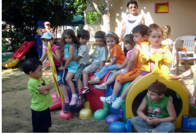
Resim 14:Oyun yerinin önceden belirlenmesi gereklidir.