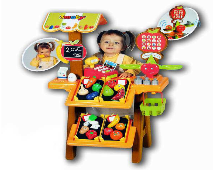
Resim 21: Oyun eğlenceli bir etkinliktir.

Grup halka şeklinde sıralanır. Her çocuğa bir meyve ismi verilir. “Elmalar yer deęiřtirsın.” talimatıyla başlanır, elma ismi verilen çocukların yer deęiřtirmesi beklenir. Oyun “ Armutlar yer deęiřtirsın.,” “Muzlar yer deęiřtirsın.,” “Elmalarla muzlar yer deęiřtirsın.” gibi talimatlarla devam eder. “Meyve sepeti” denildiğinde ise tüm öğrencilerin yer deęiřtirmesi beklenir. Oyun “Yaz meyveleri otursun, muzlar zıplasın, portakallar el sallasın.” gibi yönlendirmelerle çeřitlendirilerek sürdürülür.