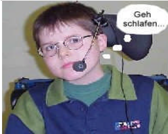
Resim 12:Oyun eğitir