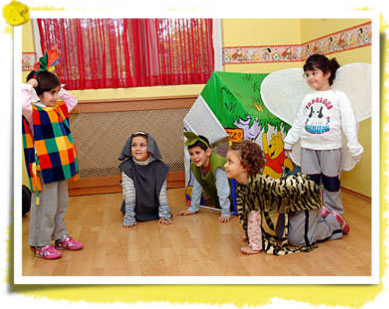
Resim15:Araç gereç oyunu destekler.