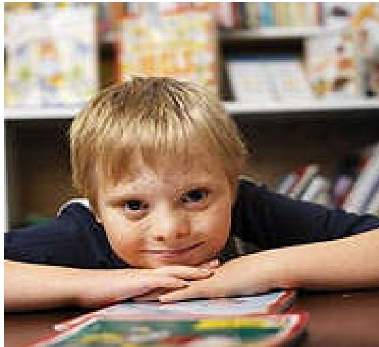
Resim10:Çocuklar oyunla bireycilikten kurtulurlar.

Otistik çocukların oyunlarında şu özellikler görülür. Hayali oyun oynamazlar, temsili becerilerden yoksundurlar, motivasyon yoksunluğu çekerler. Ancak eğitsel müdahaleler sonunda yönergelere yanıt verdikleri görülmektedir. Nesnelere işlevsel olarak kullanmak yerine döndürme hareketi ile yetinirler.