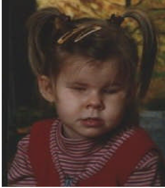
Resim11:Çocuk oyunla kendini güvende hisseder.

Bu çocuklara serbest oyun planlanmalıdır. Öğretmen önceden oyun materyalleri, araç gereçler, etkinlikler ve oyun oynayacağı arkadaşları hakkında çocuğa bilgi vermeli, normal arkadaşlardan birini onun için oyun arkadaşı seçmeli, materyal zenginliğine önem vermelidir.