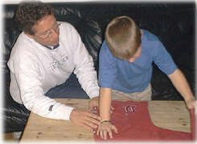
Resim 3:Özel eğitimde oyunun yeri ve önemi büyüktür.

Erken çocukluk döneminde normal çocukların hayatında oyunun çok önemli olduğunu biliyoruz. Özel eğitime ihtiyacı olan çocukların hayatında da oyunun çok büyük önemi var; çünkü engelli çocuklar oyun etkinlikleri ile kavram ve zihinsel gelişimin yanı sıra birçok sosyal beceriyi de kazanabilmektedir. Oyun etkinlikleri ile iletişim kurmayı, etkileşmeyi, arkadaş edinmeyi, beraber çalışmayı ve bireysel olarak güçlü ve zayıf yanları ile birbirlerini tamamlamayı öğrenmektedirler.