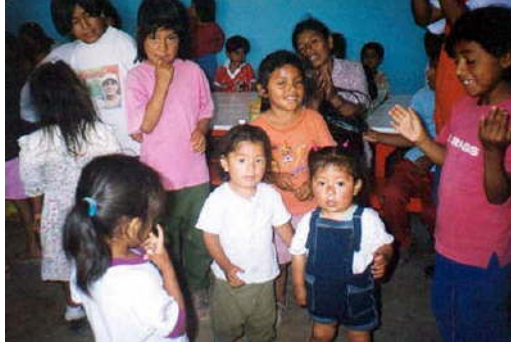
Resim 6:Oyun çocuğun yaratıcı çözümler bulmasına yardımcı olur.

Çocuk, paylaşma kavramını diğer çocukların istek ve arzularını kabullenmeye başladığında anlayacaktır. Bu da benmerkezcilikten uzaklaşınca anlaşılacaktır. Toplumun değerleri arasında olan ait olma kavramını grup içinde yaşayarak öğrenmek mümkündür. Bazı şeylerin kendilerine ait olup bazılarının ise olmadığını sosyal etkileşim ile öğrenir. Çocuğun en sık sosyal etkileşimi evcilik oyunlarında görülür. Duygusal ve sosyal gelişimi açısından çocuk, oyun oynarken düşüncelerini ifade eder, başkalarının düşüncelerini anlamayı, duygularını sözel ifade etmeyi ve saldırganlığı denetim altına almayı öğrenir, genel olarak sosyal iletişimi artar ve uyumlu davranışlar gösterir.