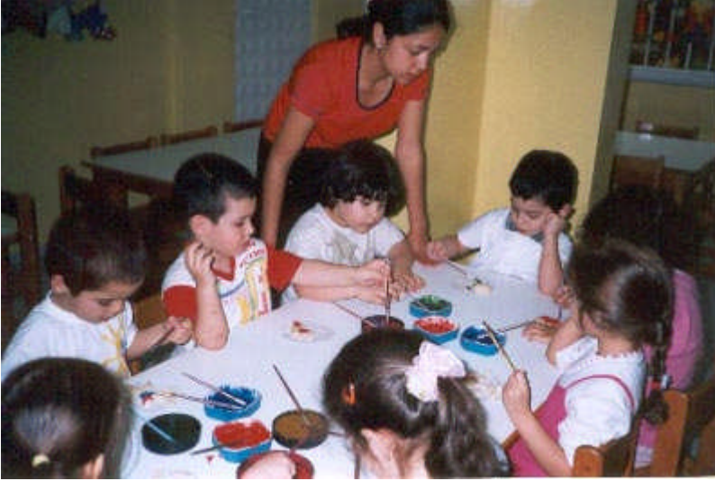
Resim 2 :Oyun çocuğa eğlence ve eğitimi bir arada sunan bir etkinliktir.

Kısacası oyun; sonu düşünülmeyen, gönüllülük esasına dayanan,dışsal baskılar ve zorlamalardan uzak olan bir etkinliktir.