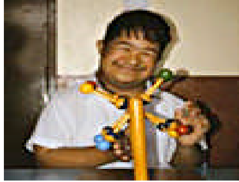
Resim 9:Oyun rahatlatma aracıdır.

• İşitme engelli çocuklar ise, iş birliği, sosyodrama oyunlarına daha az katılırlar. Nesnelere sembolik olarak kullanmada geridirler. Çevresel koşullardan daha fazla etkilendikleri görülmüştür.