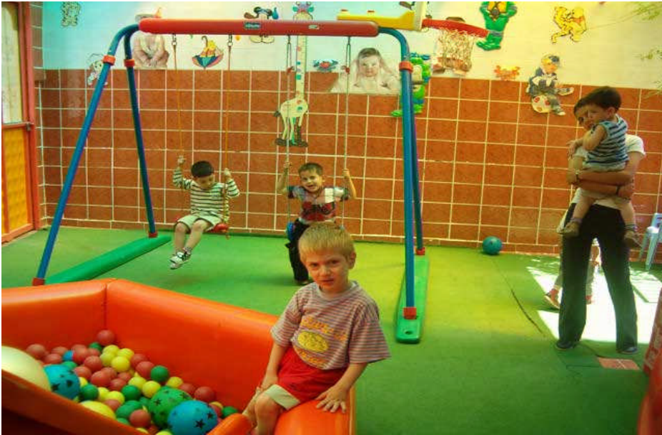
Resim 4: Oyun iletişim kurmayı sağlayan bir araçtır.

Örneğin; çocuk poliscilik oynarken “Polis olsaydım ne yapardım?” düşüncesinden yola çıkarak günlük yaşamdaki deneyimlerini, duyduklarını, hikaye kitaplarından edindiği bilgileri bir araya getirerek polis olmanın özelliklerini, nasıl bir duygu olacağını hayalini kurar ve öyle rol yapar.