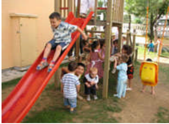
Resim16:Çocuklar açık havada oyun oynamaktan zevk alırlar.

Oyun etkinliklerinin planlaması, özür grubuna ve çocukların yaşına göre yapıldıktan sonra onu destekleyici araç gereç seçimi yapılmalıdır. Bu araçlar; resim koleksiyonları,öyküler, parçalı bilmeceler, renkli kumaşlar ve boyalı kaşıklar, tartım çalgıları, tahtaravalli, kaydırak, uçurtma, bisiklet, tahta at, büyük kutular, mum boyalar, boş kâğıtlar, kuklalar, bloklar, evcilik köşesi malzemeleri, çamur ve parmak boyası, fasulye torbası, sopalara halka geçirme oyunları, kum havuzu, kürek, kazma, kova vb. olabilmektedir.