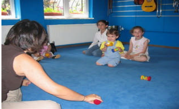
Resim13:Oyunun tedavi edici bir yönü vardır

Her özgür grubunun kendi özelliklerine uygun oyun ortamı oyun, araç gereci ve oyunları vardır. Ancak oyunlar ve oyun araçları zaman zaman benzerlik gösterebilir.. Örneğin ses ve gürültü çıkaran oyun araçları hem işitme engellilerde hem de otistik çocuklarda ilgi çekici olabilir ya da bir oyun çeşidi bütün gruplarda oynatılabilir. Oyunun özel eğitimde iyileştirici ve tedavi edici bir yönünün olduğu da tartışılmaz bir gerçektir.