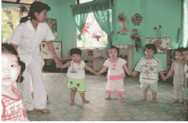
Resim 7:Oyun tüm gelişim alanlarına hizmet eder.

Oyun, her çocuğun sosyal, duygusal, psikomotor, bilişsel, dil ve öz bakım beceri alanlarının gelişiminde etkilidir. Ayrıca özel eğitim gereksinimi olan çocukların bazı gelişim alanlarında daha çok ve farklı etkileri olur.