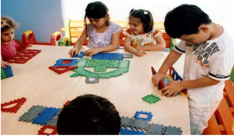
Resim 1:Özel eğitimde oyun, çocuğu hayata hazırlayan bir araçtır.

Oyun konusunda yapılan arařtırmaların giderek artmasına karřın, oyunun tanımlanmasına iliřkin problemler bulunmaktadır.Günümüze dek üzerinde hemfikir olunan tek bir oyun tanımı yapılamamıřtır.Çeřitli tanımlar yapılmakla beraber daha çok oyunun gelişimdeki önemi üzerinde daha çok durulmuřtur.Çocuklar için bir yařama biçimi,yetiřkinler için ise bir eğitim aracı olan oyun, çocuğun yařamında birtakım evrelerden geçerek gelişmektedir.