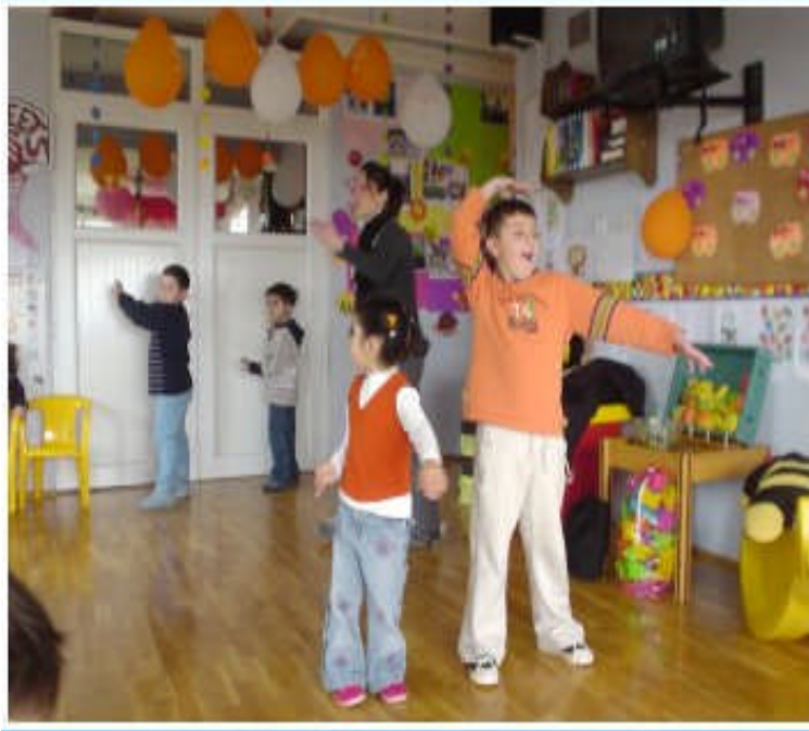
Resim 8: Çocuğun engeline göre oyunun evreleri ve özellikleri değişmektedir.

Bütün çocuklar herhangi bir engeli olsun olmasın oyun oynamaktan büyük haz duyarlar. Bu nedenle farklı gelişen çocuklara da, oyunla eğitim vermek ve gelişim alanlarını desteklemek gerekir. Engelli çocukların gelişiminde oyunun yararlı olabilmesi için öncelikle çevrenin zenginleştirilebilmesi ve çocuğun engeline uygun olarak düzenlenmesi gerekir. Bunun yapılmasındaki amaç ise, farklı gelişen çocukların oyuna başlayabilmesini, oyunu sürdürebilmesini ve tekrar oynama isteği duymasını sağlayacak bir ortam hazırlayabilmektir.