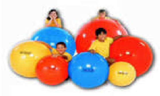
Resim 18:Renkli balonlar

Öğretmen çocuklara müzik eşliğinde dans edebilecekleri bir ortam sunar, müzik durduğunda birbirine en yakın iki çocuğun adlarını söylemeleri beklenir.Çalışma “adı ve doğduğu kent”, “adı ve en sevdiği yemek”, “adı ve en sevdiği hayvan” gibi konularda çeşitlendirilerek sürdürülür. Sonra sıra ile her bir çocuk ortaya gelir.Diğer çocuklar onunla ilgili bilgileri hatırlayıp söylemeye çalışırlar.