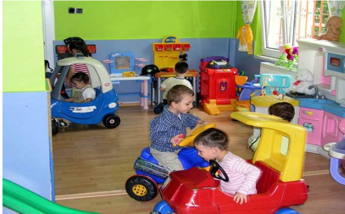
Resim 17: Çocukların başarılı olduklarını hissettirmek önemlidir.

Oyun etkinlikleri planlanıp oyunların özelliklerine uygun araç gereçler hazırlandıktan sonra çocukların gelişim düzeyleri, özür grupları, kavramları destekleyici eğitimlerine katkısı olacak oyunları hazırlanmalıdır.