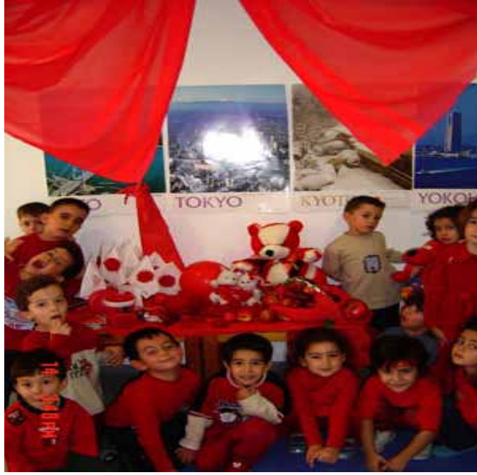
Resim 22:Çocuk oyun yolu ile iç dünyasını ifade eder.