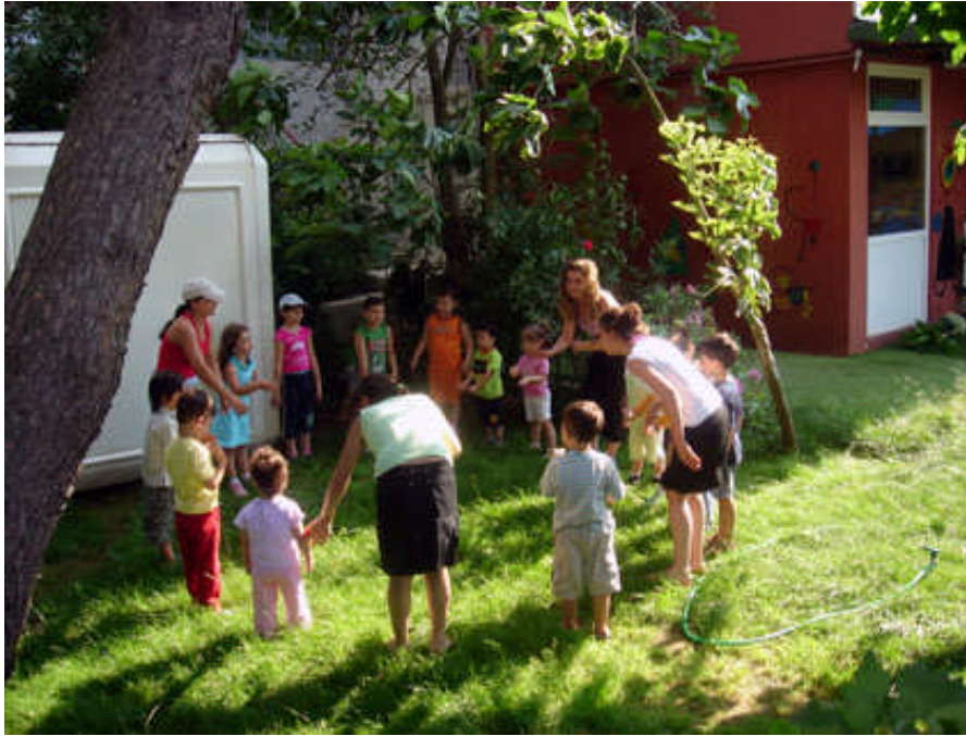
Resim 20: Grupla oyun sosyal gelişimi destekler

Çocuklar arasından birisi çağırılır ve ona: “Şimdi senin gözlerini kapatacağız ve arkadaşlarından birinin yanına göndereceğiz, onu tanıyabilecek misin?” denir. Ebe önce elleriyle kız mı, erkek mi olduğunu anlamaya çalışır. Bundan sonra arkadaşının sesinden tanımak için kuş gibi, kedi gibi ses çıkarır. Eğer başarı gösterirse yeni bir ebe seçilir.