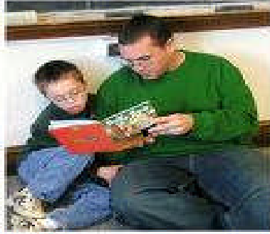
Resim11: Onun en iyi “yaparak” öğrenebileceğini unutmayın

Aynı zamanda engelli bireyin okulda ve çevresinde, kısaca toplum içinde kabul görmesi önceleri biraz zor olmakla beraber belli bir zaman sürecinin ardından bu birey toplum tarafından normal karşılanmakta ve onun da sağlıklı insanlar gibi sosyal yaşam alanı ve sosyal yaşam hakkı olduğu kabul edilmektedir.