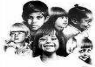
Resim9 : Eğitim sürecine katılım