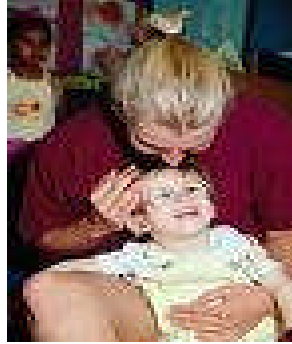
Resim 12: Yapabildikleri yapamadıklarından daha önemlidir