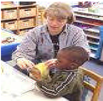
Resim10 : Çocuğunuzun içindeki cevheri keşfedin ve onu destekleyin

Bu çalışmalar iki yönlüdür. Birincisi, ailelere psikolojik yardım yapıp onları rahatlatmak ve özürlü çocuklarının kabulüne yardımcı olmaktır. İkincisi ise okul ve yuvada çocuklarına verilen eğitim programları konusunda bilgilendirerek çocuklarının eğitimine katkıda bulunmalarını sağlamaktır.