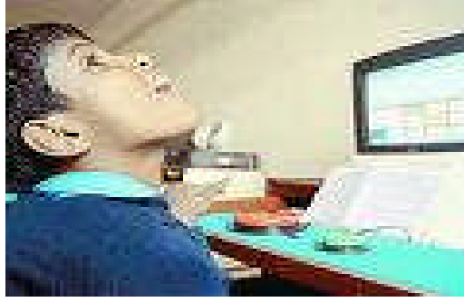
Resim 1.2: Ne olursa olsun çocuklarımızı sevmeliyiz