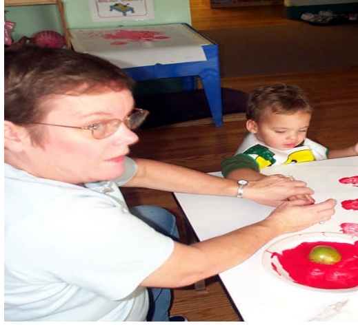
Resim8: ocuk eđitilirse, engel ařılır

Aynı zamanda engelli bireyin okulda ve evresinde, kısaca toplum iinde kabul gormesi nceleri biraz zor olmakla beraber belli bir zaman surecinin ardından bu birey toplum tarafından normal karřılanmakta ve onun da sađlıklı insanlar gibi sosyal yařam alanı ve sosyal yařam hakkı olduđu kabul edilmektedir.