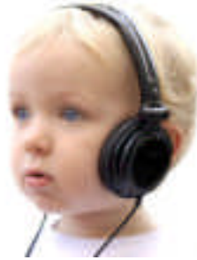
Resim :7 Çocuğun olduğu gibi kabul edilmesi, ileride karşılaşılabilecek sorunların üstesinden gelinmesinde atılacak önemli bir adımdır

Engelli çocuğun kabulüne yönelik yapılan çalışmaları araştırınız. Bir rapor haline getirip edindiğiniz bilgileri arkadaşlarınıza sunarak paylaşınız.