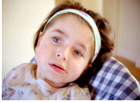
Resim6:Engelli bir çocuk için erken teşhis çok önemlidir