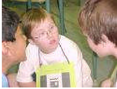
Resim 3 : Engelli çocuklara, engelli olmayan çocuklarla eşit davranınız

Engelin önlenmesi konusunu araştırarak bilgisayar ortamında sunuş oluşturacak şekilde rapor haline getirip edindiğiniz bilgileri arkadaşlarınıza sunarak paylaşınız.