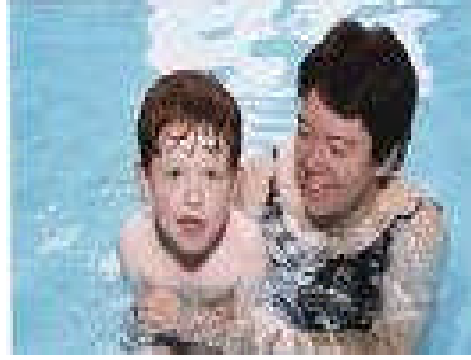
Resim4 : Eğitimle mutlu olan bir anne ve çocuğu