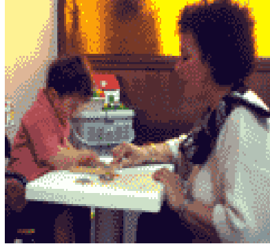
Resim 5: Engelli çocuğa öğretilenler sık sık tekrarlanmalıdır