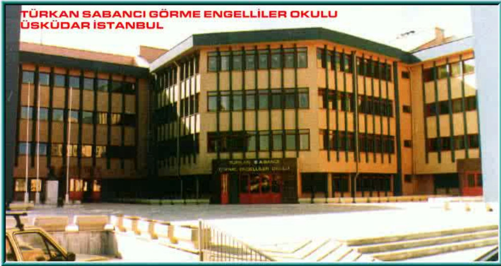
Resim 2.1: Türkan Sabancı Görme Engelliler Okulu

Özel eğitim okulları, erken çocukluk eğitiminden başlayarak yüksek öğrenime kadar her düzeyde açılan ve özel eğitim gerektiren bireylerin bir arada eğitim aldıkları kurumlardır. Tanımından da anlaşılacağı gibi özel eğitim okulları doğrudan kaynaştırma eğitiminin uygulandığı kurumlar değildir. Bu kurumlarda sadece herhangi bir nedenle normal çocuklardan farklı olan çocuklara eğitim verilmektedir.