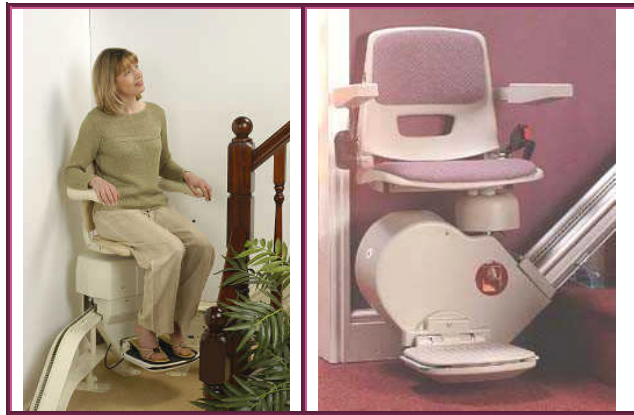
Resim 1.10: Ortopedik engelliler için tasarlanmış bu sandalye lift, merdiven ve meyil çıkımlarında onlara kolaylık sağlayacaktır