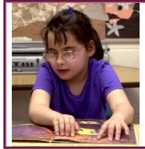
Resim 2.8: Az gören kaynaştırma öğrencisi

Kaynaştırma uygulamaları yapılan okul ve kurumlarda, kaynaştırma eğitimini ve özel eğitim gerektiren kaynaştırma öğrencileri için bireyselleştirilmiş eğitim programını geliştirmek, uygulamak, izlemek ve değerlendirmek için bireyselleştirilmiş eğitim programı geliştirme birimi oluşturulur.