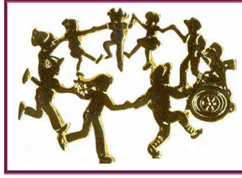
Resim 1.2:Kaynaştırma öğrencisi normal çocuklarla birlikte etkinliklere katılmalıdır