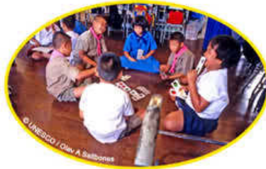
Resim 1.20: Küçük grup çalışması