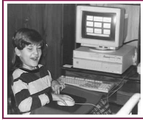
Resim 1. 13: Gözleri görmeyen bir çocuk, özel hazırlanmış fare ve klavye ile bilgisayar kullanabilir