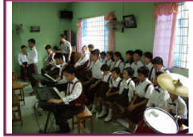
Resim 1. 15: İlgi ve becerileri doğrultusunda sınıf içi aktivitelerde görev alması sağlanabilir

Öğrencinin var olan performansı, onun yeterli ve yetersiz olduğu alanlar hakkında temel bilgileri oluşturur. Bu bilgiler onun eğitsel programının düzenlenmesine yardımcı olur. Uzun dönemli amaçların belirlenmesi ve uygulanması, var olan performansın doğru olarak belirlenmesine bağlıdır. Bireyin o anki performans düzeyi, öğretime hangi noktadan başlanacağını belirtir. Örneğin, öğrenci 1'er 1'er 100'e kadar sayabilmektedir. Öğrenci için bir sonraki uygun basamak ifadesi, “onar onar 100'e kadar sayar” olabilir.