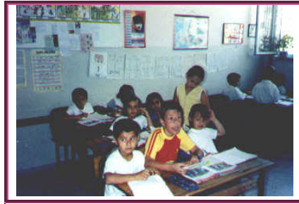
Resim1.1:Kaynaştırma öğrencisi bulunan sınıf

Bütün bu ve buna benzer varsayımlardan hareketle başta Kuzey Avrupa ülkeleri ve Amerika Birleşik Devletleri olmak üzere, birçok ülkede “Özel Gereksinimli Çocukların Normal Eğitim Ortamında Eğitilmesi” uygulaması yaygınlaşmaya başlamıştır.