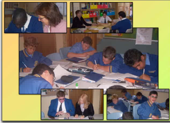
Resim 1.24:Kaynaştırma eğitiminde grup çalışması

Farklılığı olan çocuklara sosyal olgunluğu ile uyuşan çeşitli sorumluluklar verilmeli, başarabildiği kadarıyla birçok şeyleri başlatıp bitirmesi sağlanmalı, başarıma duygusu tattırılmalıdır. Grup etkinliklerine yönlendirilip katılımları sağlanmalıdır. Çünkü çocuk grupta aktif olarak görev alır ve başarı ile tamamlarsa grup tarafından saygı ve kabul görecektir. Grup etkinlikleri derken bu çocuklara katılacakları grupta en iyi yapabilecekleri rol ve sorumluluklar verilerek bu güzel sonuca erişilebilir. Bunun yanı sıra yapamayacakları rollerin verilmesinin ise ona daha çok zarar verilebileceği ve yetersizlik duygusu geliştirmesine neden olacağı unutulmamalıdır.