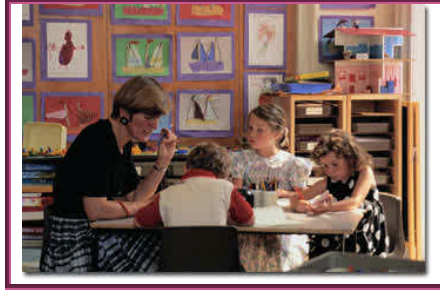
Resim 1. 16: Uzun dönemli ve kısa dönemli hedeflere sınıf içi etkinliklerle ulaşılabilir

“Bireyselleştirilmiş Eğitim Programının BEP Geliştirme Birimince hazırlanmasından sonra öğretmen tarafından “BÖP” hazırlanır. Bireyselleştirilmiş Öğretim Planı (BÖP), BEP’in amaçlarına ulaşılmasında gerekli özel öğretim planlarını içeren uygulama planıdır.