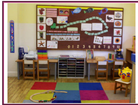
Resim 1.22: Kaynaştırma öğrencisinin katıldığı etkinlik ürünlerinin sınıf panosunda sergilenmesi yararlı olacaktır

Kaynaştırma eğitimi alan öğrencinin sınıftaki diğer öğrencilerde gibi bir değerlendirilmesinin yapılması gerekmektedir. Ancak bu değerlendirme normal akranlarına yapılan değerlendirme ile aynı ölçütlerde değildir. Özel eğitim gerektiren kaynaştırma eğitimi öğrencisinin değerlendirilmesi, Özel Eğitim Yönetmeliğinin değişik 18/12/2004 tarih ve 25674 sayılı 73. maddesinde belirlenen şekillerde yapılmaktadır.