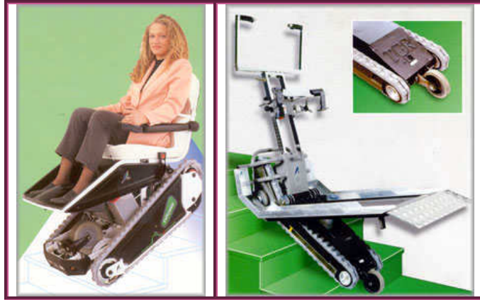
Resim 1.9: Ortopedik engelliler için merdiven çıkmayı ve inmeyi sağlayan özel taşıyıcı sandalye