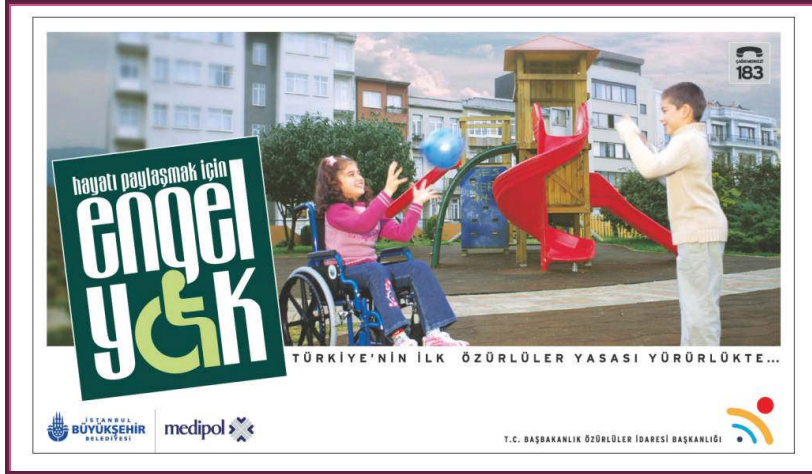
Resim 2.4: T.C. Başbakanlık Özürsüzler İdaresi Başkanlığı tarafından hazırlanmış afiş

Sosyal Hizmetler ve Çocuk Esirgeme Kurumu Genel Müdürlüğü tarafından sunulan hizmetler ise Özel Rehabilitasyon ve Eğitim Hizmetleridir. Bu kuruluşların işleyişi, Sosyal Hizmetler ve Çocuk Esirgeme Kurumu Genel Müdürlüğüne bağlı Özel Özel Eğitim Hizmetleri, Özel Rehabilitasyon ve Eğitim Merkezleri Yönetmeliği doğrultusunda sürdürülmektedir.