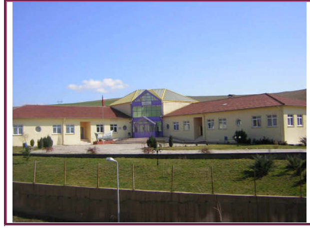
Resim 2.2: Safranbolu Hasan Gemici Eğitim Uygulama Okulu ve İş Eğitim Merkezi - Zihinsel Engelliler Okulu

Ancak özel eğitim kurumu dolaylı olarak kaynaştırma eğitimine destek olmaktadır. Kaynaştırma eğitimi alan bir öğrenci aynı zamanda da bir özel eğitim kurumundan destek eğitimi alabilir. Bu süre zarfında özel eğitim okulundaki öğretmen ile çocuğun kaynaştırma eğitimi aldığı okul öğretmeni arasında sıkı bir işbirliği söz konusudur. Bazen de kaynaştırma eğitimi alan çocuğun ayrıca bir özel eğitim okulundan destek eğitimi almasına gerek olmadığı durumlar vardır. Yine de kaynaştırma öğrencisi olduğu okulun öğretmeni, çocuğun daha önceden eğitim aldığı özel eğitim kurumu ile işbirliği içinde olması faydalı olacaktır. Bu sayede öğrencisini daha iyi tanıyabilecek, olumsuzlukların nedenlerini daha çabuk bulabilecektir.