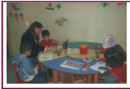
Resim 1.3: Özel eğitim gerektiren öğrenciler her sınıfa eşit olarak dağıtılır

a) Özel eğitim gerektiren bireylerin akranları ile birlikte okul öncesi, ilköğretim, orta öğretim ve yaygın eğitim kurumlarında aynı sınıfta eğitim görmesi ve sosyal açıdan bütünleştirilmesi için özel eğitim destek hizmetleri, özel araç-gereç ve eğitim materyalleri sağlanır. Eğitim programı bireyselleştirilerek uygulanır ve gerekli fiziksel düzenlemeler yapılır. Kaynaştırma uygulamaları yapılan okullarda, sınıf mevcutlarının okul öncesi eğitim kurumlarında 14, ilköğretim kurumlarında 30 öğrenciyi aşmamasına dikkat edilir. Özel eğitim gerektiren öğrenciler her sınıfa eşit olarak dağıtılır, bir sınıfta yetersizliği aynı olan en fazla iki öğrenci uygulamaya katılır.