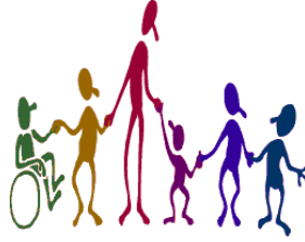
Resim 1.21:Engelli birey de uygulamaların içinde olmalıdır

Öğretmenin, kendisini merkezden çıkarıp yönlendirici konumuna çekerek oluşturduğu öğretim stratejisine, "keşfetme (buluş) yoluyla öğretim yaklaşımı" denmektedir. Burada öğretmenin görevi, sorulan soru ve verilen örneklerle öğrencileri öğrenmeye hazır hale getirerek öğrencilerin konuyu analiz ve sentez yoluyla geliştirmelerini ve pekiştiricilerle öğrencilerin konu hedeflerine ulaşmalarını sağlamaktır.