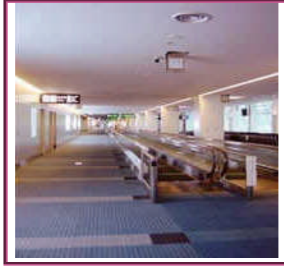
Resim 1.12: İşitme engelli öğrenciler için koridora elektronik yazı panoları yerleştirilebilir