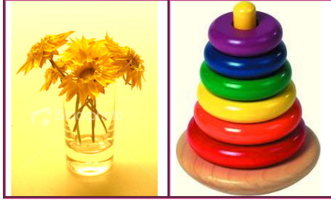
Resim 1.19: Verilen ipuçları yaşantısının içinden, onun tanıdığı nesne ve olaylardan seçilmelidir