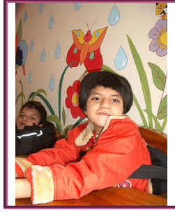
Resim 1.7: Kaynaştırma öğrencisi