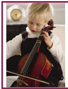
Resim 1.5: Üstün ve özel yetenekli çocuk

Akademik alanda ve/veya sanat alanındaki yetenekleri açısından akranlarına göre üst düzeyde performans gösterme durumunu ifade eder