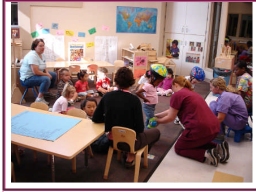
Resim 1.17: Kaynaştırma öğrencisi için hazırlanan BEP doğrultusunda okulun mevcut programı uygulanır