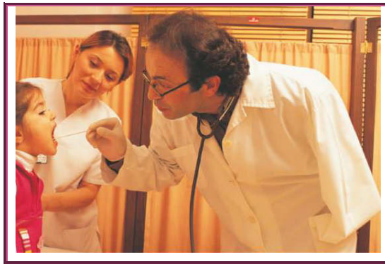
Resim 2.6:Gerekli imkanlar sağlandığında engelliler de birçok iş alanında görev yapabilirler

Engellilerin istihdam edilmesinde özürlerinin cinsi ve derecesinin yanı sıra, aldıkları mesleki eğitim ve kursların da göz önünde bulundurulması çalışma hayatındaki başarılarını artıracak ve kendilerine güven duymalarını sağlayacaktır.