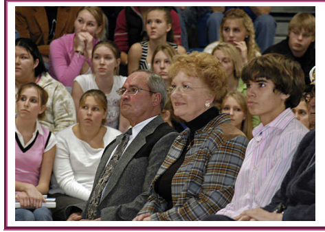
Resim 1. 14: Ailelerle toplantıda anne babaların yanı sıra kardeşler de bulunabilir

Kaynaştırma eğitiminde ailelere önemli görevler düşmektedir. Bu nedenle kaynaştırma eğitimine katılacak özürli çocuğun ailesi ve sınıfta bulunan diğer çocukların aileleri ile görüşmeler düzenlenmeli, mevcut durum ve karşılaşılabilecek olası problemler hakkında bilgilendirilmelidirler. Kaynaştırma eğitimi süresince de bu toplantılara devam edilmeli, ailelerden bilgi alınmalı ve gelişmeler hakkında aileler bilgilendirilmelidir.