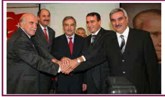
Resim 2.5: Milli Prodöktivite Merkezi, Türkiye İş Kurumu Genel Müdürlüğü ve İş Sağlığı ve Güvenliğı Genel Müdürlüğü yetkilileri ile protokollerin imzalanması töreni

Ülkemizde özürliilere, onların istihdamına ve iş sağlığına verilen önem doğrultusunda devletin pek çok biriminde çalışmalar yürütölmektedir. Bu çalışmalardan belki de en önemlileri 2006 yılında Milli Prodöktivite Merkezinin Türkiye İş Kurumu Genel Müdürlüğü ile ve yine Milli Prodöktivite Merkezinin İş Sağlığı ve Güvenliğı Genel Müdürlüğü ile yaptığı protokollerdir. (Milli Prodöktivite Merkezi Türkiye İş Kurumu Genel Müdürlüğü ile “Engellilerin Verimlilik ve İstihdamının Artırılmasına Yönelik Eğitim ve Araştırma Faaliyetleri” konusunda, İş Sağlığı ve Güvenliğı Genel Müdürlüğü ile de “Verimlilik Kapsamında İş Sağlığı ve Güvenliğı ve Ergonomi Alanında Araştırma ve Eğitim Projesi” konulu iki Protokolü 28 Eylül 2006 tarihinde imzalamıştır. )