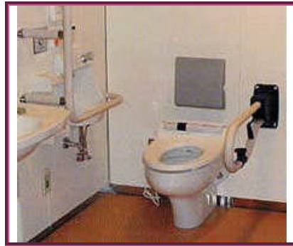
Resim 1.8:Kaynaştırma eğitimi uygulanan okulda ortopedik engelli öğrenci için düzenleme yapılmış tuvalet ve lavabolar

Ortamın kaynaştırma eğitimi için çocuğun engeline göre önceden düzenlenmesi, onun adaptasyonunu kolaylaştıracak önemli bir etkidir. Engelli çocukların normal akranlarıyla bir arada bulunduğu sınıflarda aynı sırayı ortak kullanmaları, aynı etkinliklere katılmaları aralarındaki iletişimi etkileyen etmenlerdendir. Bu da eğitim ortamındaki düzenlemelerle sağlanabilir. Kaynak odalar oluşturularak engelli öğrencilerle ders dışı zamanlarda da ilgilenme ve öğrenciyi eksik olduğu yönlerde geliştirmeye yönelik uygulamalara gidilmelidir. Millî Milli Eğitim Bakanlığı Özel Eğitim Hizmetleri Yönetmeliğinin ( Madde 4) 18.12.2004 tarihli ve 25674 sayılı Resmî Gazetede yayımlanan düzenlemesine göre kaynak oda ( destek eğitim odası); eğitim kurumlarında, özel eğitim gerektiren öğrencilere ihtiyaç duyulan alanlarda destek eğitim hizmetleri verilmesi için düzenlenmiş ortam şeklinde ifade edilmiştir.