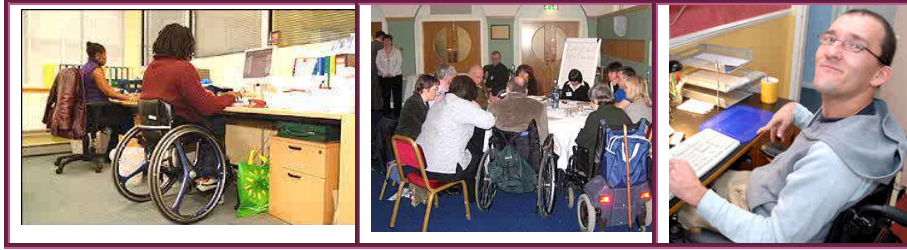
Resim 2.7: Bedensel engelliler ve çalışma mekanları