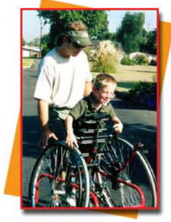
Resim 1.4:Ortopedik engelli

Bir organını ya da fonksiyonunu kaybetmiş; iskelet, eklem, sinir sistemi ve kaslarında bir sakatlık bulunan ancak sınıfta başkasına bağımlı olmadan kalabilen çocuklar.