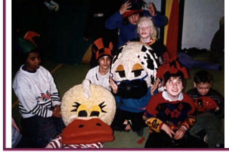
Resim 2.9: Kaynaştırma sınıfı