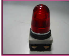
Resim 1.11: Teneffüs saatlerini bildiren ışıklı alarm