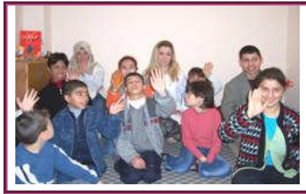
Resim 1.6: Kaynaştırma eğitiminde görev alacak öğretmen aileler ve öğrencilerle görüşmeler düzenlemelidir

Sınıfta kaynaştırma öğrencisi bulunan öğretmenlerin yapması gereken bazı hazırlıkları aşağıdaki şekilde sıralamak mümkündür;