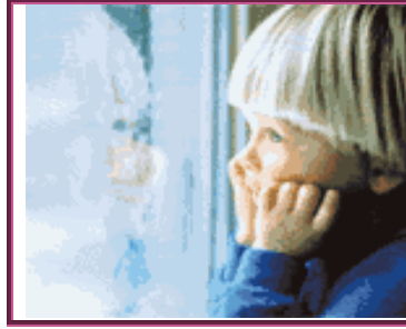
Resim 1.23: Otistik çocuk

Sosyal uyum güçlüğü olan öğrencilerin durumu okul tarafından ayrıntılı bir rapor düzenlenerek özel eğitim hizmetleri kuruluna gönderilir. Özel eğitim hizmetleri kurulu, bu öğrenciler için tedavi, psikolojik danışmanlık, rehabilite, bakım-gözetim-koruma altına alma, moral ve maddi destek gibi konularda ilgili kurum ve kuruluşlarla iş birliği kurarak, gerekli önlemlerin alınmasını sağlar. Bu öğrencilerin değerlendirilmesinde rehberlik ve psikolojik danışma hizmetleri servisinin görüşü dikkate alınır, esnek ve hoşgörülü davranılır.