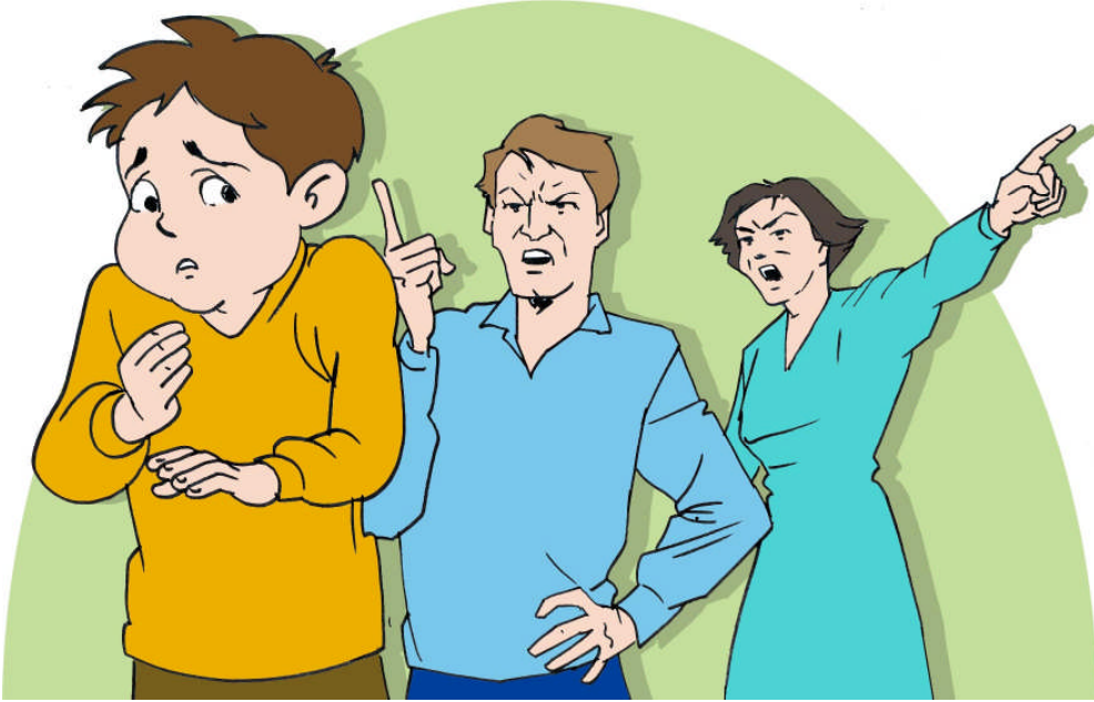
Resim 1.3:Ailenin, ocuęun yaratıcı fikirlerini hayata geirmesine fırsat vermemesi yaratıcılıęını olumsuz etkiler.