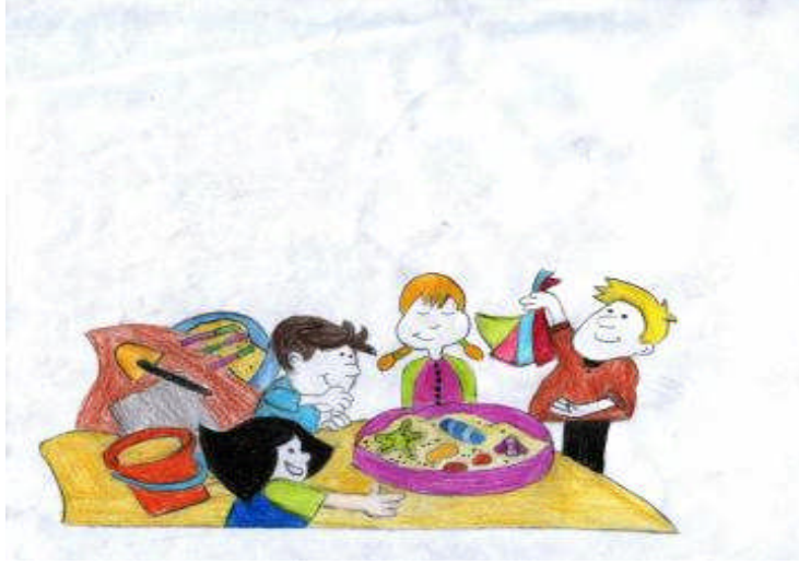
Resim 2.1 : Yaratıcı drama çalışmalarında isteyerek grupta yer almak önemlidir

Doğaçlamalardan oluşan yaratıcı drama katılımcıların kendi yaratıcı düşünceleri ile buldukları, özgün düşünce yapılarının ürünleri, hatırladıkları yaşama dair birikimleri ve bilgileri önceden yazılmış bir metin olmadan uygulanır. Yaratıcı drama etkili eğitimde yaşayarak öğrenmeyi sağlayan yaşamsal bir faktördür.