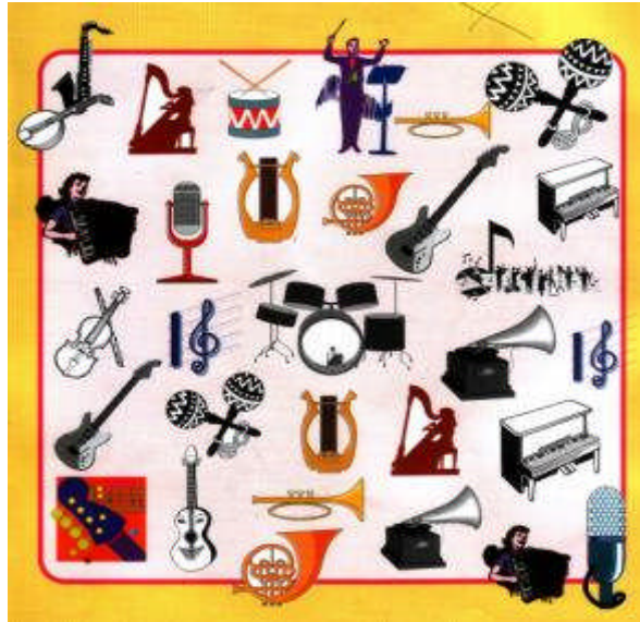
Resim 3.1: Müzik araçları ile bir oyun oluşturulabilir

Katılımcının karakter portresine ve etkinliğin özelliğine göre müzik seçilmeli ve teknik donanımla desteklenmelidir. Örneğin, duygusal durumlarda klasik veya romantik, heyecan varsa hızlı ritimli, coşku varsa ritmik, koro sesleri içeren müzikler seçilebilir.