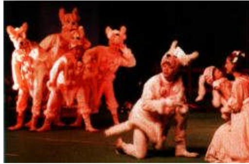
Resim 1.2: Drama,kişiler arasında doğrudan iletişimi sağlar

Drama;kişiler arasında doğrudan iletişimi sağlayan; kendini ve karşısındakini tanıma, birbirini anlama, doğaçlama ve yaratma gibi etkinlikleri içeren bir yöntemdir. mış gibi yapabilmeyi. Dramada tiyatro tekniklerinden yararlanılır ancak drama tiyatro demek değildir.drama bir grup etkinliğidir. Seyirci ve oyuncu ayrımı yoktur. Bütün grubun katılımı ile anında oluşturulur . belli bir metni yoktur ve önceden prova yapmayı gerektirmez.dekor kostüm ve aksesuar zorunluluğu yoktur.Grup dinamiğine dayalı oyunlaşımadır.anında oluşturmayı, yaratmayı içerdiği için yaratıcı drama olarak kaynaklarda yer almaktadır. Yararlanıldığı alanlara göre de farklı anlam taşıyarak adlandırılmaktadır.psikoloji alanında yararlanılan psiko-dramanın yaratıcı drama ile karıştırılmaması gerekir.. Drama genel eğitim sisteminin pek çok alanında ve her kademesinde uygulanabileceği, grup dinamiğine dayalı oluşundan hareketle eğitici,eğitsel drama olarak da karşımıza çıkmaktadır. Farklı kaynaklarda benzer tanımlarla drama, yaratıcı drama, ve eğitici drama kavramlarının birbirinin yerine kullanıldığını görüyoruz.