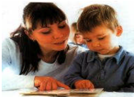
Resim 2.1: Aile ,çocuğun yaratıcı orijinal cevaplarını ödüllendirmeli ve yeni denemeler için cesaretlendirmelidir.