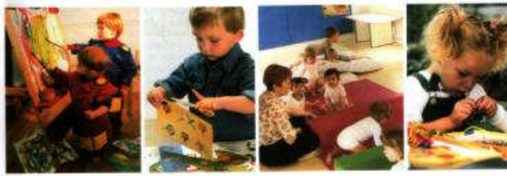
Resim 3.1: İlgî köşeleri yaratıcı drama için uygun bir ortamdır

Örnek Çalışma: Sınıf ortamında erken çocukluk eğitim kurumlarında bulunan ilgi köşeleri gibi yaratıcı drama ortamı oluşturacak şekilde bir köşe düzenleyiniz.