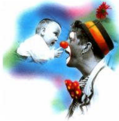
Resim 2.2: İletişimde bireyler etki alışverişinde bulunmaktadır

Yaratıcı drama çalışmalarında ortaya koyulan tüm ürünler paylaşılmaktadır. Bu çalışmaların özünde birlikte üretme ve paylaşma isteği bulunmaktadır. Bu istek katılımcıların ve izleyicilerin bir arada olacağı bir ortamda gerçekleştirilir. Bu durumda bir iletişimin oluşması olasıdır. İzleyiciler gerçek anlamda izleyici değildirler. Öte yandan bu izleyiciler görmek işitmek isteyeceklerdir. Bu noktada katılımcılar işitmeyi, görülmeyi, kendilerini net bir şekilde anlamaları gerektiğini kısaca iletişim gerçeğini öğreneceklerdir. İletişim her yaratıcı drama çalışmasını izleyen tartışma da doğal olarak ortaya çıkacaktır. Yaratıcı dramada çocuklar iletişim kurma becerilerini kazanmakta ve geliştirmektedirler. Çocuklar bu etkinlik içinde düşünme, konuşma, dinleme, anlatma becerilerini de kazanmaktadır.