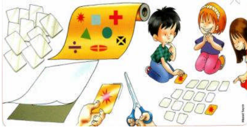
Resim 2.2: Drama çalışmalarında öğrenciler sınıfta öğrenmeye açık hale gelirler

Kendini ifade etme, özgüven duygusu geliştirme, psiko-motor, zihin dil yönünden gelişim sağlama, empati kurarak çok yönlü düşünebilme, iş birliği, dayanışma, paylaşım gibi duyguların gelişimi, eğitim ve öğretimde olumlu rol oynama, rahatlama, öğrenilen bilgilerin kalıcı olabilmesi, olaylara ve durumlara farklı bakış açılarına sahip olma, demokratik ortamlar oluşturarak tartışma eleştirme ve eleştirilere açık olmayı öğrenmesini sağlayan bir süreçtir.