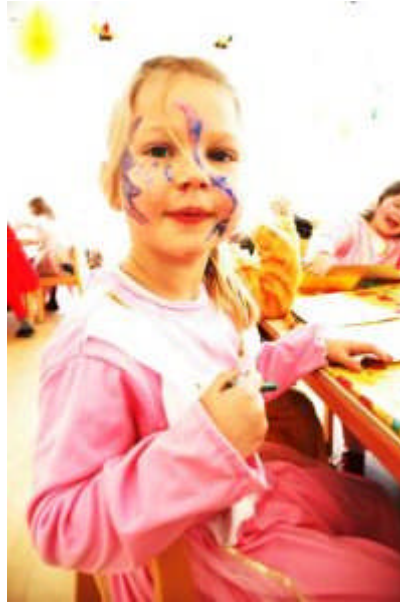
Resim 1.1: Her insan az ya da ok yaratıcılık yetisine sahiptir

Yaratıcı düşünce için yalnızca sanat ya da müzik alanlarını düşünmek ölçüt deęildir. Yaratıcı düşünce beř duyunun ve zekânın bileřiminden oluşur. İnsan yaşamındaki tecrübeler, ocukluktan başlamak üzere oynanan oyunlar yaratıcı düşüncenin her yerde karşılaşılabilecek bir süreç olduğunu gösterir.