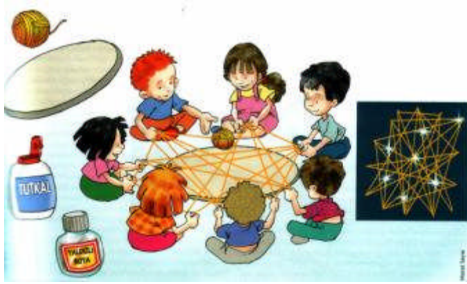
Resim 1.2 :Çocuklar algıladığı, çağrışımlarla bulduğu sembelleri ve birçok imgeyi oyunlarda kullanır

Küçük yaş çocukları için seçilen oyuncakların seçiminde;