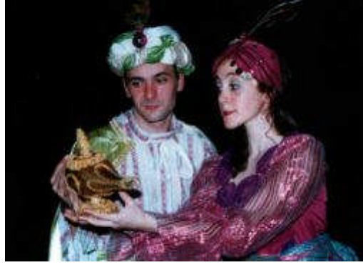
Resim 1.3: Drama hayal gücünü kullanmayı ve doğaçlamalarla anında eğitimi sağlar